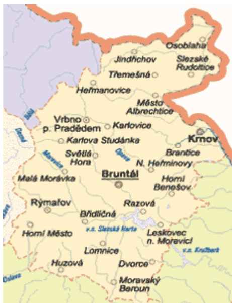
Obr. 1 Mapa regionu Bruntálsko

Historický vývoj území, rozdílný geografický potenciál, sídelní poměry, spádovost a funkce krajiny vytvářejí na území Severomoravského kraje tři socioekonomické podoblasti, jejichž význam je značně rozdílný. Bruntálsko patří do podoblasti Jesenické.[57]