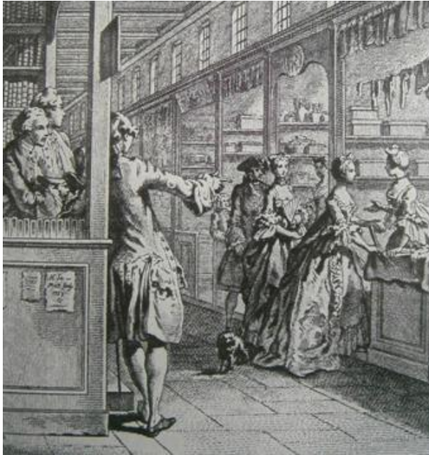
Gravelot H. F., Z Corneillových her, 1764, rytina v kovu, převzato z knihy „Ilustrace“.