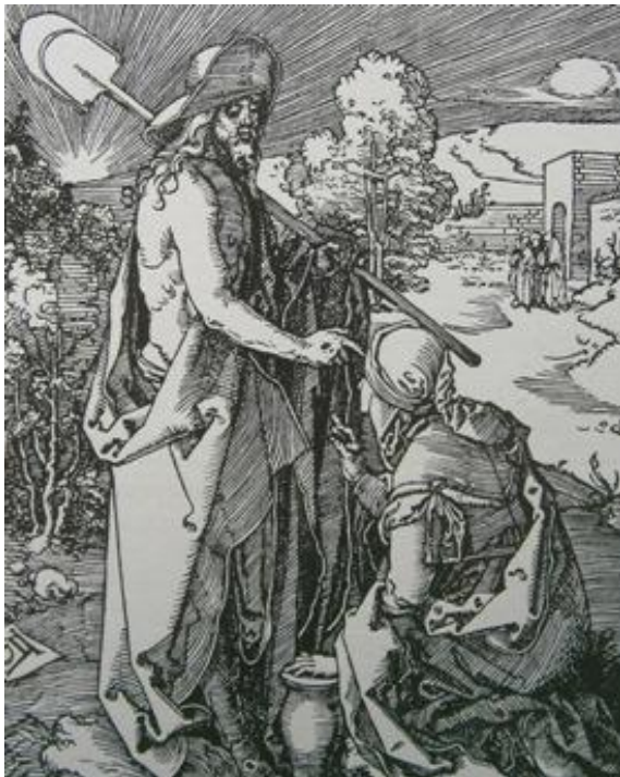
Dürer Albrecht, Kristus jako zahradník, Z Dürerových Malých pašjí, 1511, dřevorez, převzato z knihy „Ilustrace“.