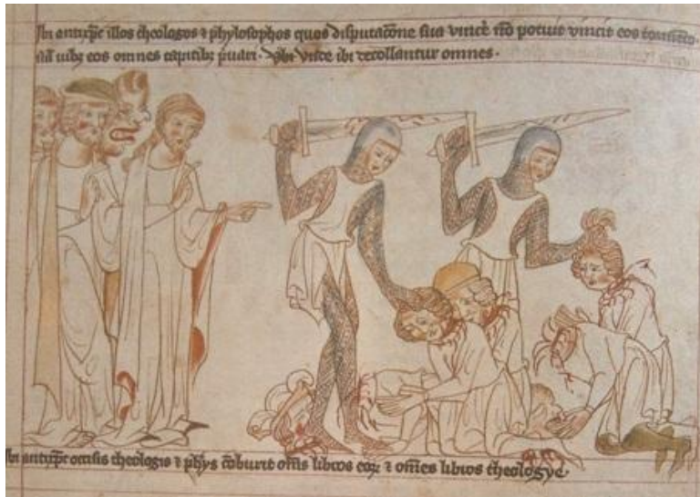
Antikrist dává stínat teology a filozofy a spálit jejich knihy, Velislavova bible, mezi lety 1325 – 1349, iluminace, převzato z knihy „Česká kniha v proměnách staletí“.