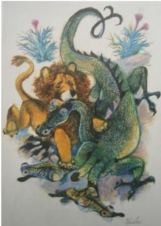
Trnka Jiří, Myslivec a labutí panna, Sedmikráska – Německé pohádky, 1960, voskový pastel, převzato z knihy „Jiří Trnka“.