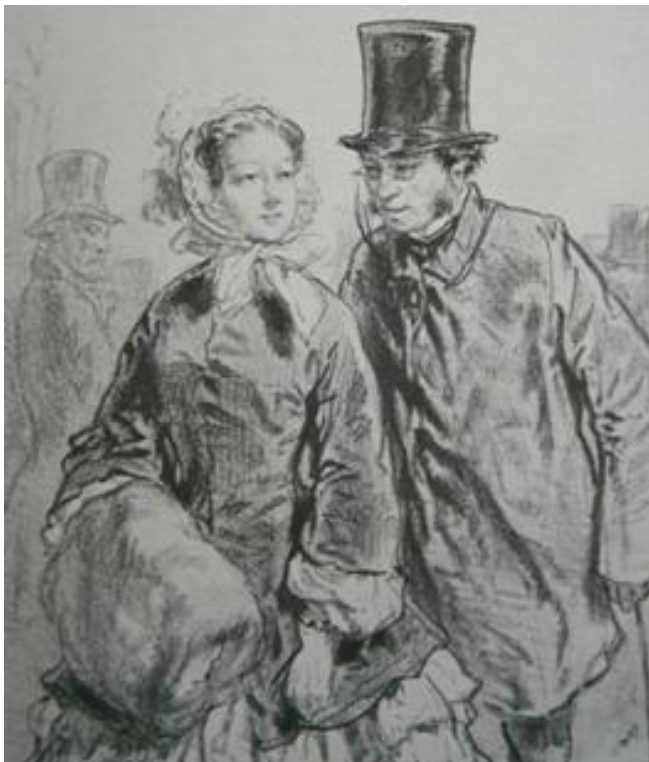
Gavarni S.G., z alba Sem tam, 1857, litografie, převzato z knihy „Ilustrace“.