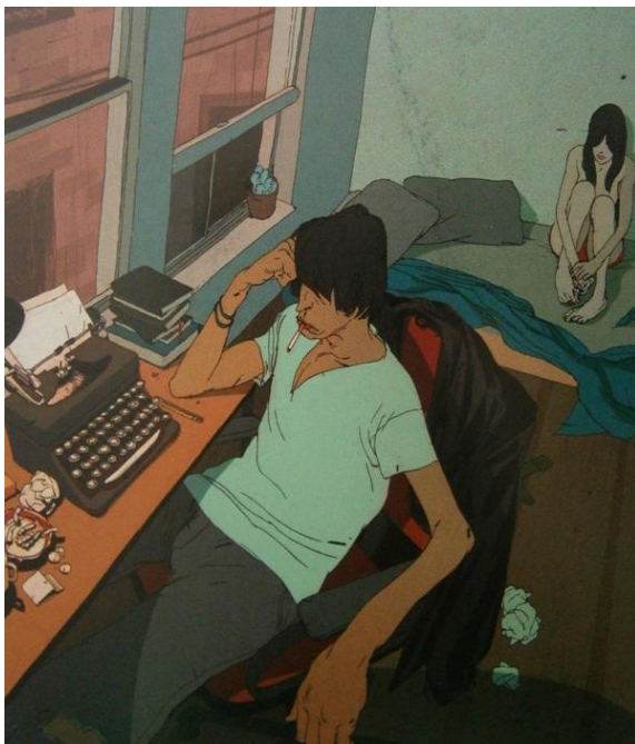
Stockton Frank, Sekond Chances – More magazine, 2008, inkoust a photoshop, převzato z knihy „Illustration Now! Volume 3“.