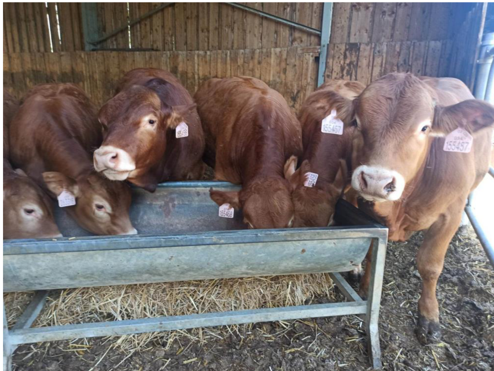
Obrázek 5: Přikrmování mladých býků před odsunem na OPB

Býci jsou po zvážení ve 210 dnech odvezeni na OPB v Cunkově, kde probíhá jejich test vlastní užitkovosti a následně, pokud jsou vybráni při základním výběru na konci testu jsou prodáváni v dražbě na OPB. Pokud vybráni nejsou, posílají se na jatka.