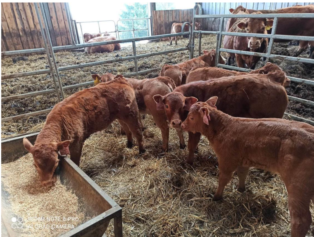
Obrázek 4: Příkrmování telat startérem

Telata jsou odchovávána pod matkou až do odstavu. Dokud jsou telata ve stáji, mají vyčleněný malý box, tzv. „školku“, do které mají přístup jen oni. V tomto boxu je žlabové příkrmiště, kde jsou příkrmována startérem, z důvodu lepšího rozvoje předžaludků. Na pastvinách je pro telata speciální přikryté příkrmiště, kde se jim také podává startér.