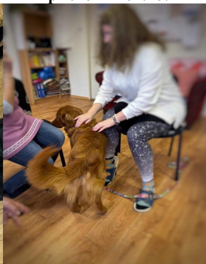
Hlazení psa a pozdrav s nově příchozí klientkou