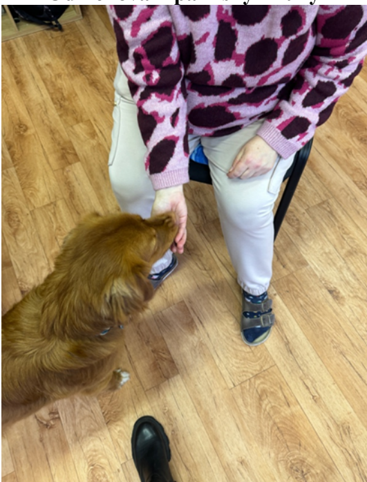
Odměňování pamlsky z ruky