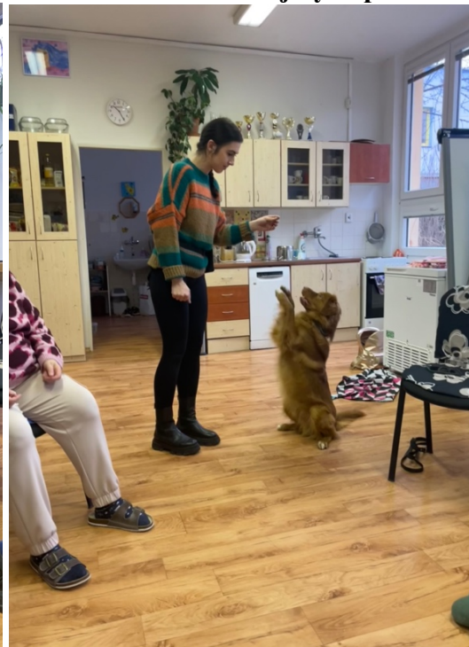
Předvádění triků a jiných povelů