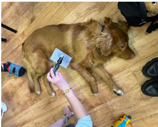
Péče o psa, nácvik ohleduplného přístupu