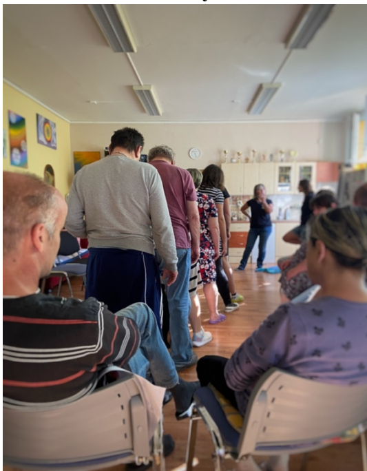
Obr. 1: Ukázka z canisterapie, klienti vytvořili tunel z rozkročených nohou