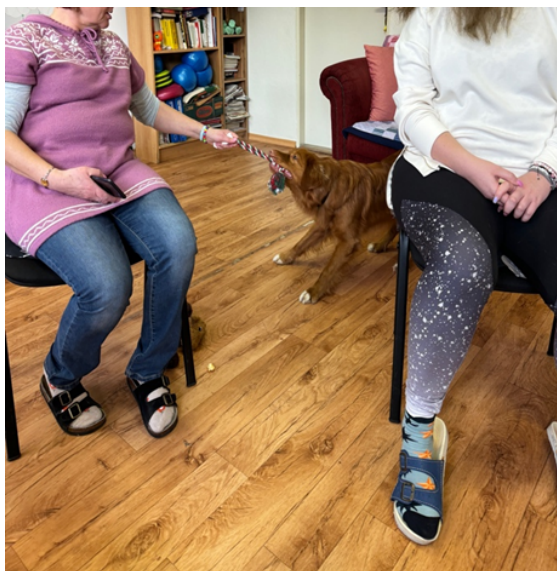
Hra se psem, přetahování