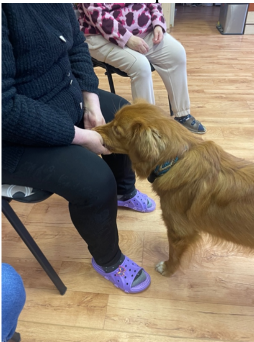
Hledání pamlsku v dlani, odměnění psa