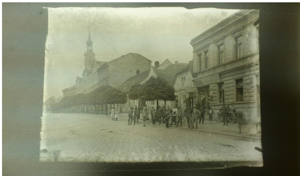
Obrázek 5: Pohled na gymnázium v Kolíně z Kutnohorské ulice, přibližně v roce 1910 (v současné době Obchodní akademie)