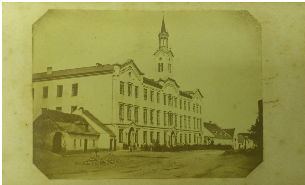
Obrázek 3: Reálná škola v Kolíně, v letech 1860–1863 (v současné době Obchodní akademie)