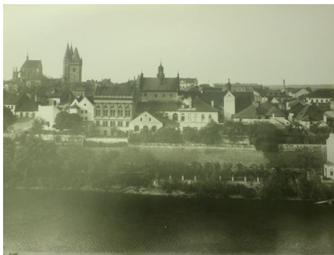
Obrázek 2: Pohled na Kolín na začátku 20. století, František Krátký, 1907