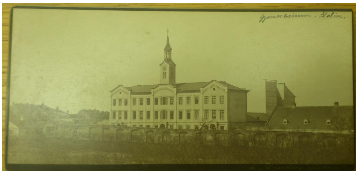
Obrázek 4: Reálné gymnázium v Kolíně, v letech 1878–1883 (v současné době Obchodní akademie)