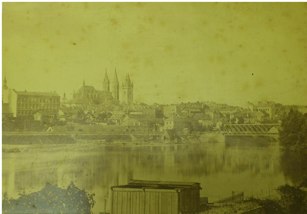
Obrázek 1: Pohled na Kolín od Zálabí v 19. století, J. Eckert, 1879