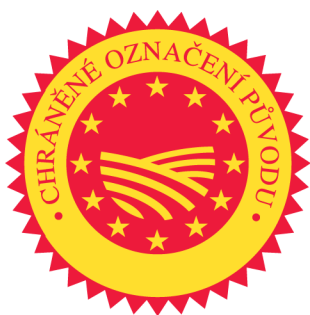
Obr. 1 Chráněné označení původu, logo