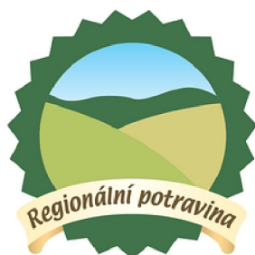
Obr. 5 Regionální potravina, logo Zdroj: Regionální potravina (2021)

Jedinečnost oceněných potravin tkví v tradiční lokální receptuře, v originálním výrobním postupu či ve využití specifické místní suroviny, informuje webová stránka projektu (2021). Zákazník tedy nákupem certifikovaných výrobků podpoří svůj kraj, lokálního zemědělce, producenta nebo prodejce a to může mít i za následek rozšíření počtu pracovních míst v dané oblasti, dodává. Dále poukazuje na rozdíly v chuti a čerstvosti a také na ekologickou zátěž, kterými se vyznačují produkty dovezené ze zahraničí, a vyzdvihuje místní produkci. Dle oficiálních stránek Regionální potraviny (2021) spočívá výhoda místní produkce i v blízkém kontaktu výrobce s koncovým spotřebitelem a tlaku ze strany kontrolní inspekce.