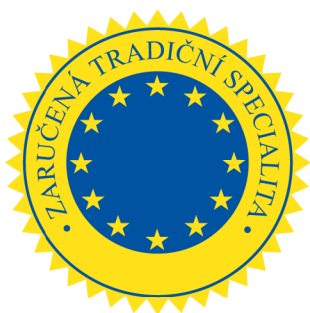
Obr. 3 Zaručená tradiční specialita, logo

Mezi další režim jakosti definovaný Evropskou unií a upravený Evropskou komisí (2018) je značení Zaručená tradiční specialita (ZTS) , která zdůrazňuje tradiční aspekty výrobku, jako je výrobní postup nebo složení, ale není spojená s konkrétní zeměpisnou oblastí.