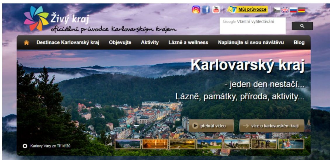
Obr. 9 Webová stránka Živého kraje – destinační agentury pro Karlovarský kraj

Web návštěvníkům nabízí použití vyhledávače, který využívá i výsledky Google vyhledávače. Hesla „regionální produkt Krušnohoří“, „regionální produkt Poohří“, „Asociace regionálních značek“ se k datu 15. června 2021 neshodovala s žádnými výsledky na stránkách. Výsledky ale odkázaly na záložku Tradiční produkty . Mezi tradičními produkty zmíněnými na stránce se objevují výrobky sklárny Moser, bylinný likér Becherovka, Karlovarské lázeňské oplatky, Hudební nástroje Amati, pokamenělé předměty, karlovarský porcelán a balneorašelina. Ani u jednoho produktu však není zmínka o ocenění certifikátem, občas se v textu vyskytnou hesla tradiční výrobek či tradiční výroba . Odkaz na produkt Karlovarský porcelán zahrnuje do výčtu nejznámější porcelánky v kraji, Thun 1794 a.s., držitel ocenění regionální produkt Krušnohoří, mezi nimi je. Další informace ale k dispozici nejsou a heslo Thun 1794 a.s. jen návštěvníky přeměruje na oficiální internetové stránky porcelánky, znovu zde není uvedena žádná informace o certifikátu.