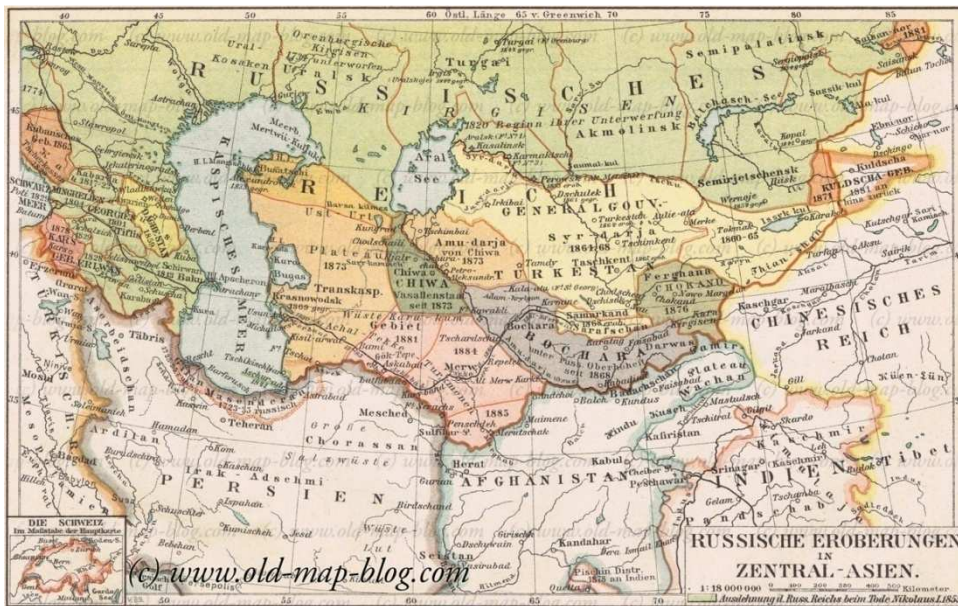
Obrázek č. 3: Historická mapa oblasti Střední Asie