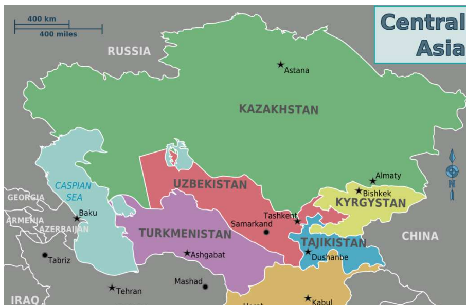
Obrázek č. 2: Mapa současných států Střední Asie