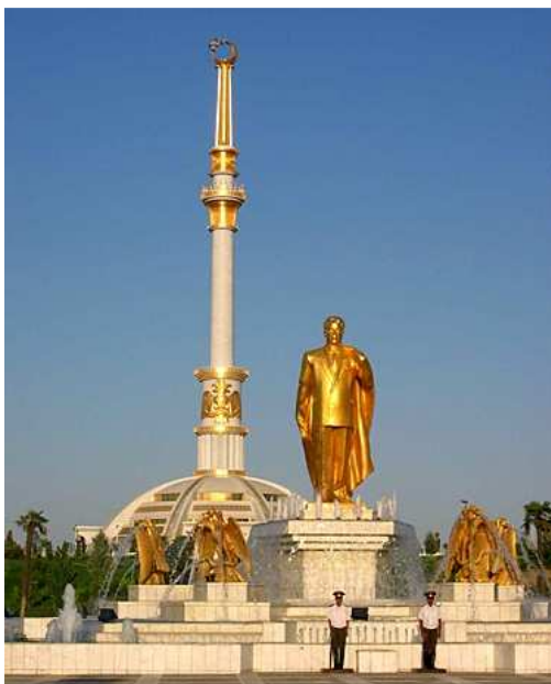
Obrázek č. 4: Turkmenbašihů zlatá socha