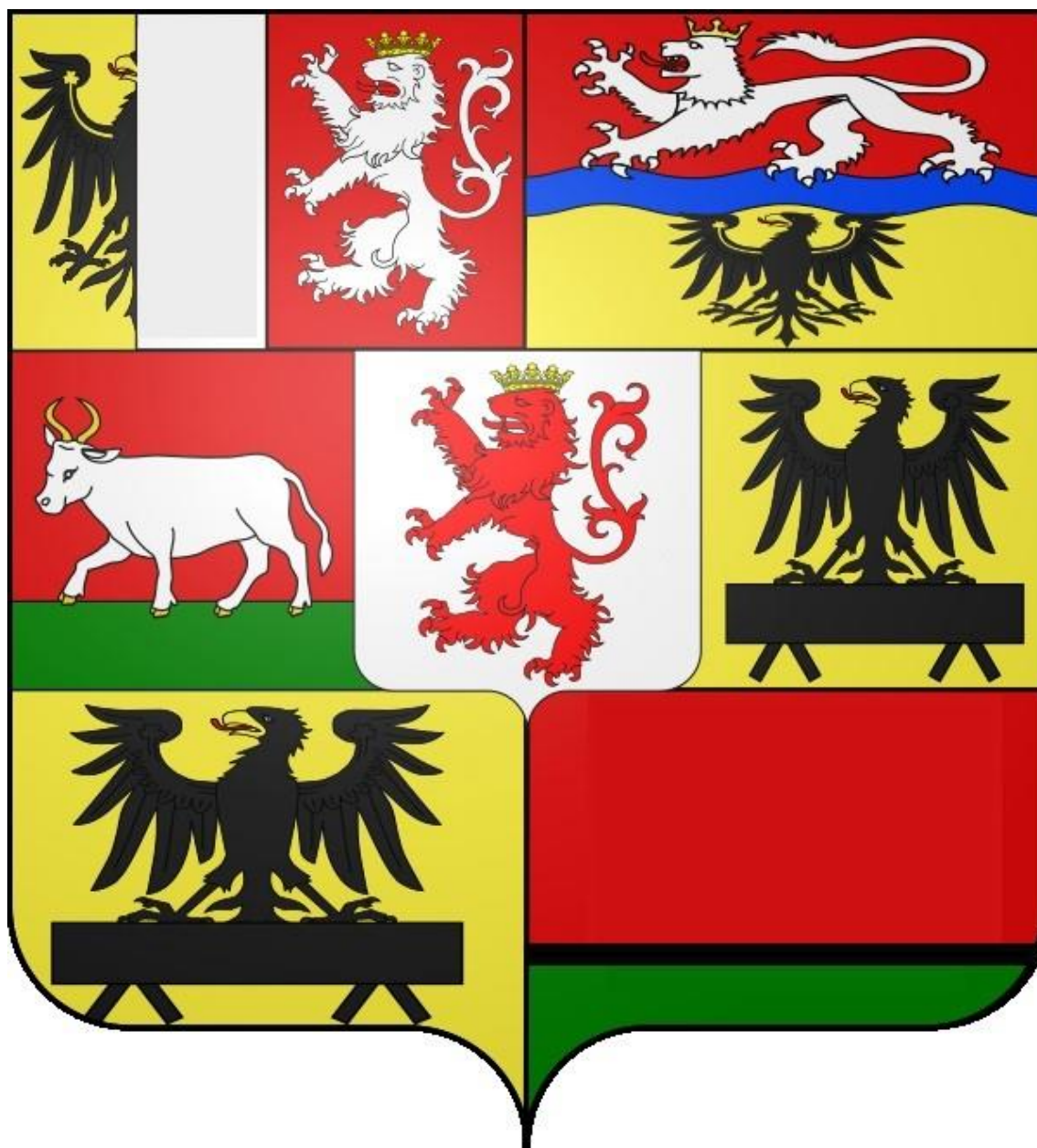
Obrázek č. 5: Erb Auerspergů

9. Najdi v expozici erb Auerspergů a dokresli chybějící části.