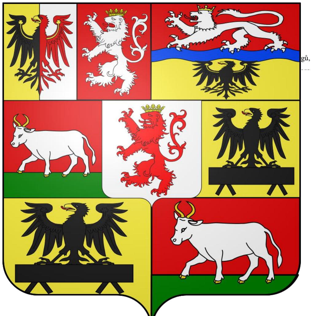
Obrázek č. 6: Erb Auerspergů