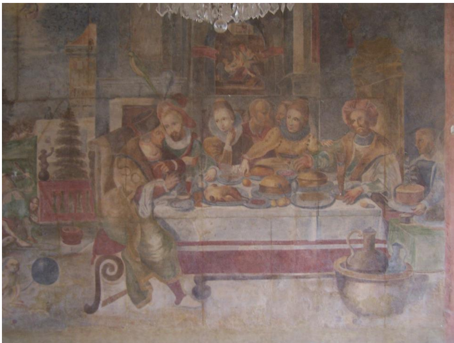
Obr. č. 15a. Starý zámek. – Podklad: Foto autor (2016).