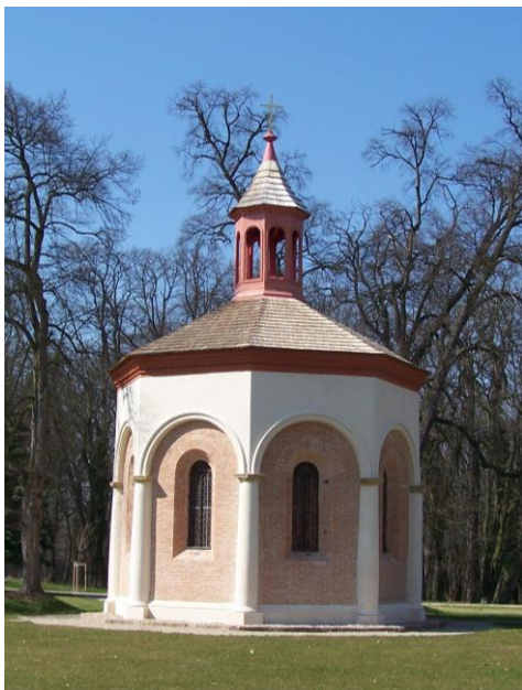
Obr. č. 13c. Kaple Nejsvětější Trojice.

První fotografie (detail z pohlednice) zobrazuje kapli na počátku 20. století. Druhá dokumentuje stav před rekonstrukcí. Poslední představuje zrekonstruovanou kapli (střecha je kryta šindelem) včetně úpravy nivelity terénu.