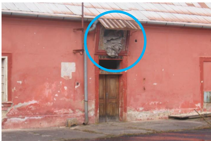
Obr. č. 14a. Starý zámek. – Podklad: Foto autor (2006).