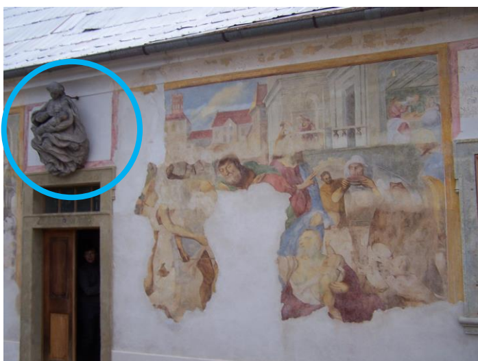
Obr. č. 14b. Starý zámek.