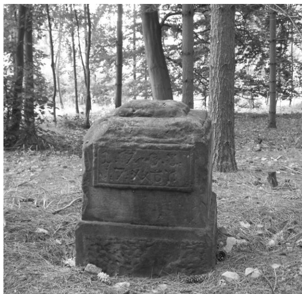
Obr. č. 18a. Šporkův kámen.