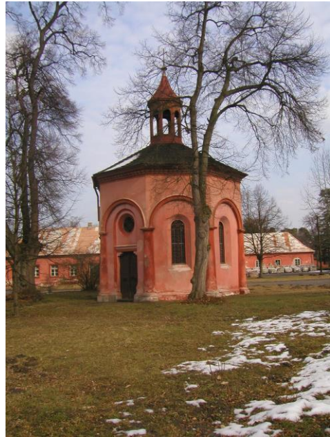
Obr. č. 13b. Kaple Nejsvětější Trojice.