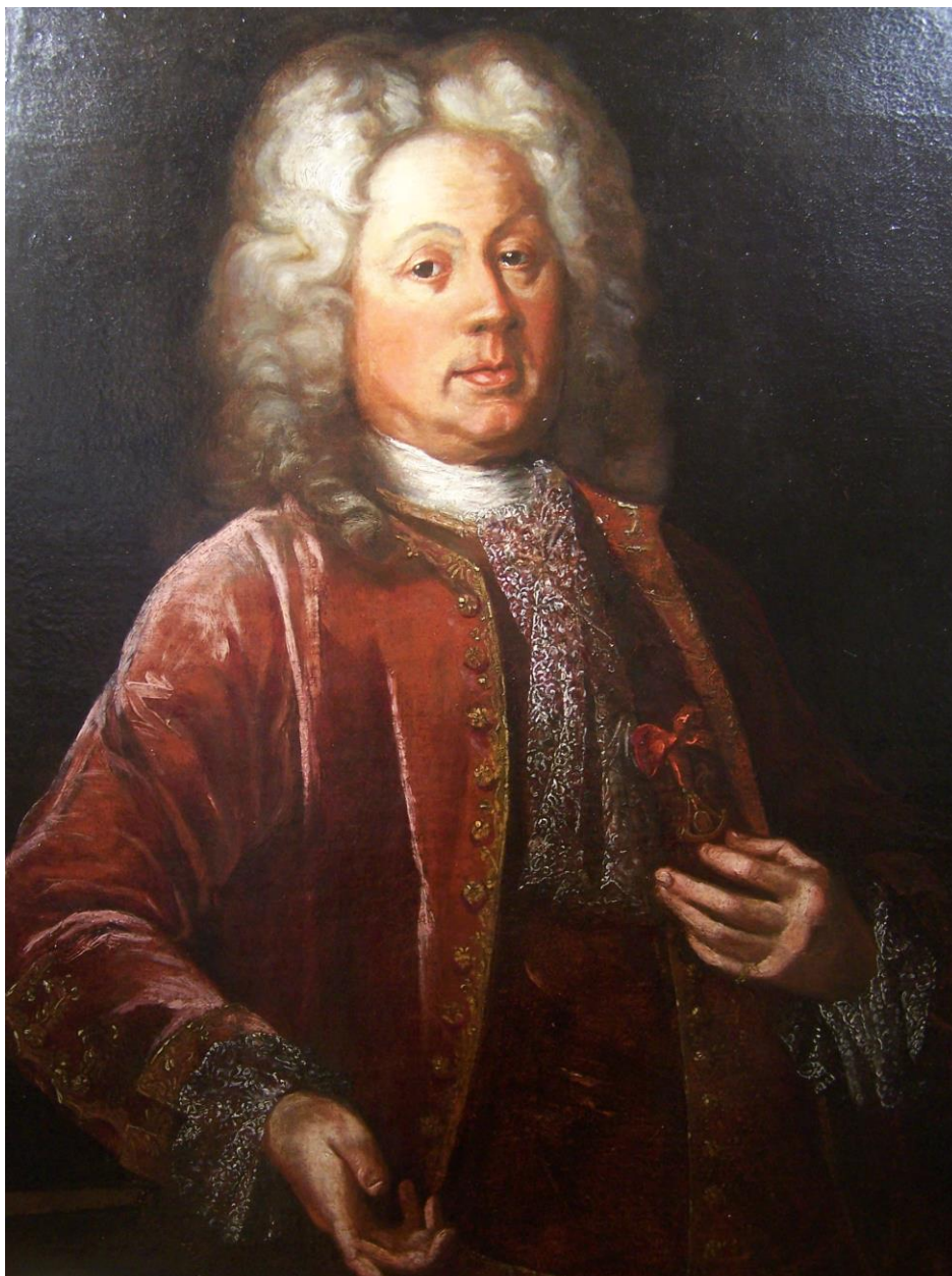
Obr. č. 19. František Antonín Špork s Řádem sv. Huberta. – Podklad: Polabské muzeum, Muzeum Bedřicha Hrozného, Obraz hraběte Františka Antonína Šporka , přírůstkové číslo 46/80.