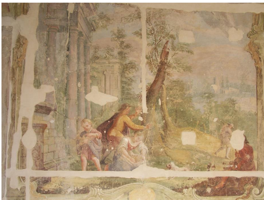
Obr. č. 12. Nový zámek, průběh restaurování maleb Přichovského sálu. – Podklad: Foto autor (2006).

Zatímco nástropní iluzivní freska v centrálním sále Nového zámku byla vždy předmětem ochrany, nástěnné fresky byly zatřeny běžnou interiérovou malbou. Nevědomost o jejich existenci vedla v důsledku elektroinstalace k poškození fresek pocházejících z rokokové přestavby zámku.