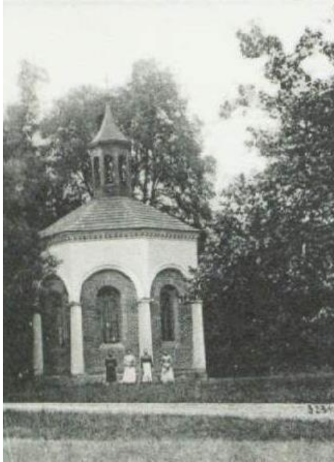
Obr. č. 13a. Kaple Nejsvětější Trojice.