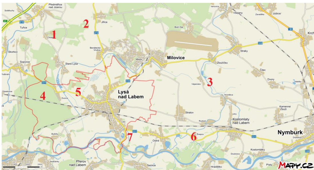
Obr. č. 17. Rozmístění loveckých atrakcí hraběte Šporka na panství Lysá. – Podklad: Základní mapa dostupná online ( www.mapy.cz ), [citováno k 11. VII. 2016].