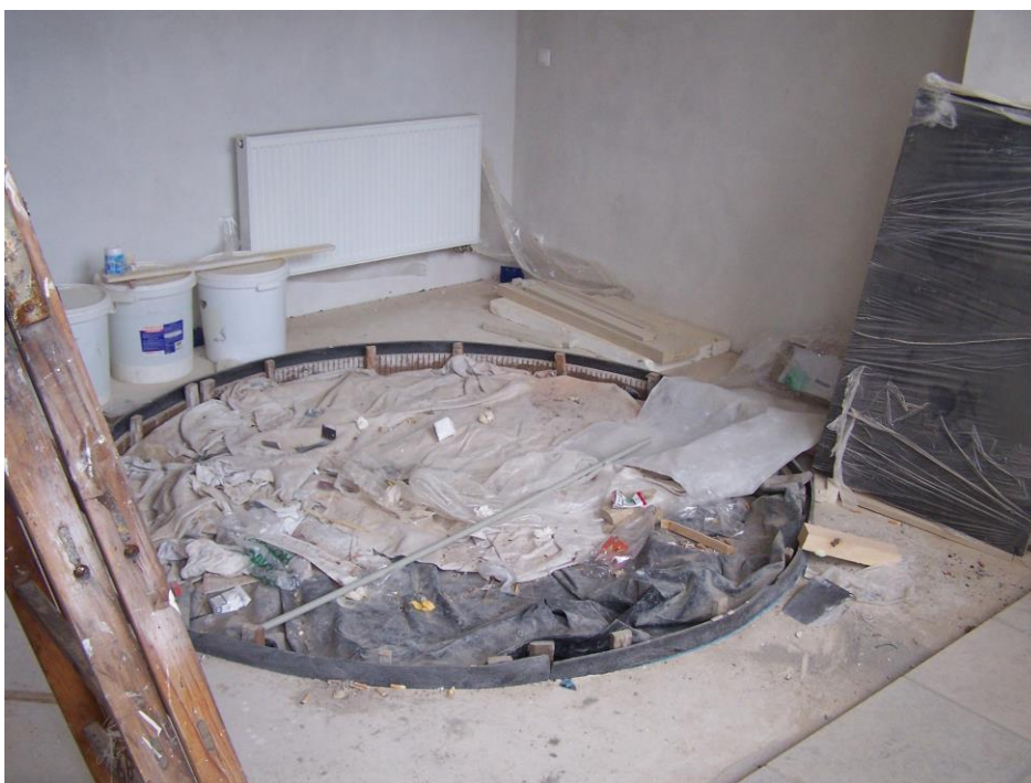
Obr. č. 15b. Starý zámek. – Podklad: Foto autor (2016).

První fotografie představuje nejstarší známou fresku tzv. Hostinu bohatcovu, která byla nalezena při adaptaci důstojnické jídelny. Následně byla transferována na nové místo a restaurována ještě za působení armády. Druhá fotografie zobrazuje provizorně zakrytý otvor tzv. Neumannovy stříbrné studny.