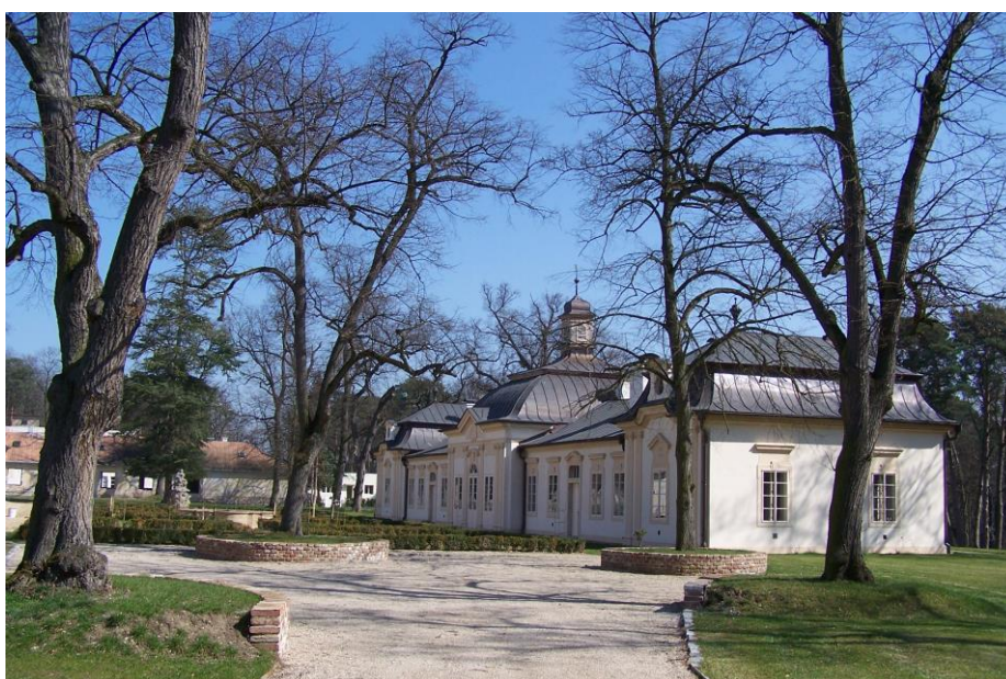
Obr. č. 16a. Úprava parteru kolem fontány před severním průčelím Nového zámku.