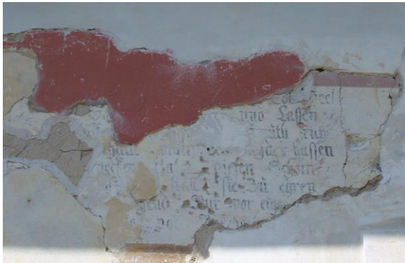
Obr. č. 23b. Texty na jižní fasádě Starého zámku. – Foto autor (2016).

Nápis HERKOMANNUS na kamenném ostění nadsvětlíku vstupu do Starého zámku (dříve pavilonu pro služebnictvo).