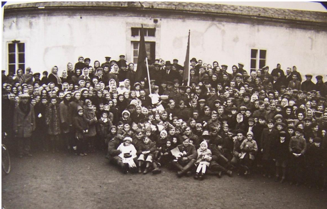
Obr. č. 27. Bon Repos 1945.

Na fotografii je zachycen prostor před jižním křídlem Starého zámku, kde se shromáždili obyvatelé Čihadel, Staré Lysé a okolí. Mezi obyvateli byli přítomni i vojáci sovětské armády.