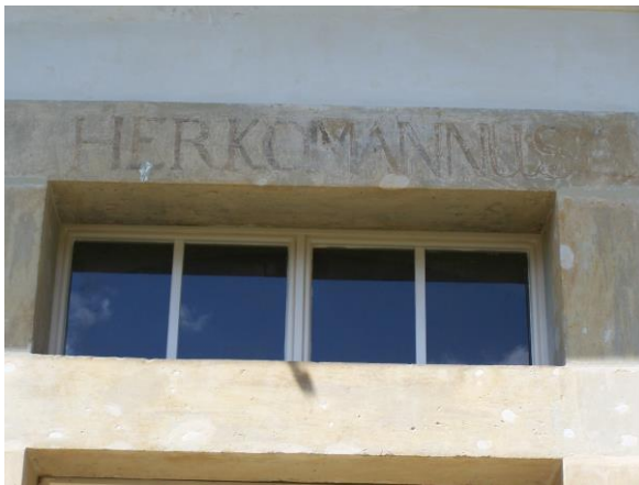
Obr. č. 23a. Texty na jižní fasádě Starého zámku. – Foto autor (2016).

Nápis HERKOMANNUS na kamenném ostění nadsvětlíku vstupu do Starého zámku (dříve pavilonu pro služebnictvo).