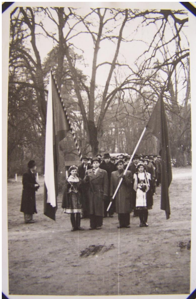
Obr. č. 28. Bon Repos 1951. – Podklad: SOkA Nymburk, f. Obecní úřad, fotoalbum IV., fotopříloha ke kronice obce Stará Lysá.

Fotograf zachytil řazení průvodu k Pochodu míru, který vycházel z areálu „Politické školy“ na Bon Repos.