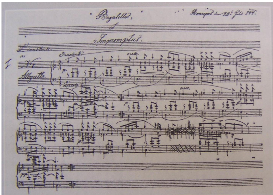
Obr. č. 25. Kopie notového zápisu klavírní Bagatelles et Impromptus . – Podklad: Jan KRÁLIK, Hudebníci brandýského Polabí , Brandýs nad Labem-Stará Boleslav 2008, s. 24.

V horní části notového zápisu je uvedena datace 20. VII. 1844 a označeno místo vzniku - Bonrepos.