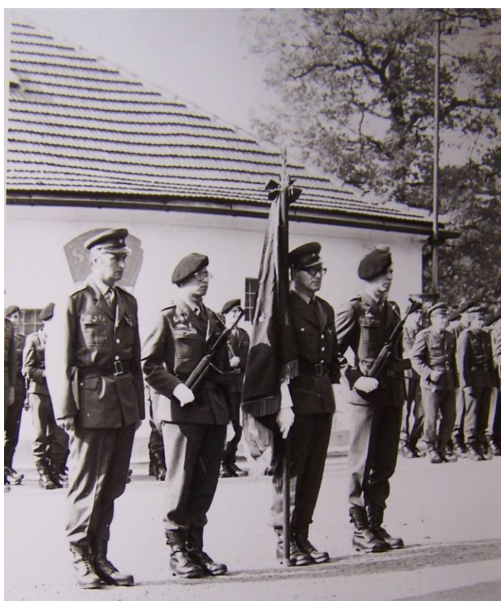
Obr. č. 30. Ze života vojenského útvaru.

Horní snímek je dokladem o tematické výzdobě fasády východního traktu hospodářského dvora. Dolní snímek byl pořízen v ploše mezi hospodářským dvorem a technologickým zázemím na východě.