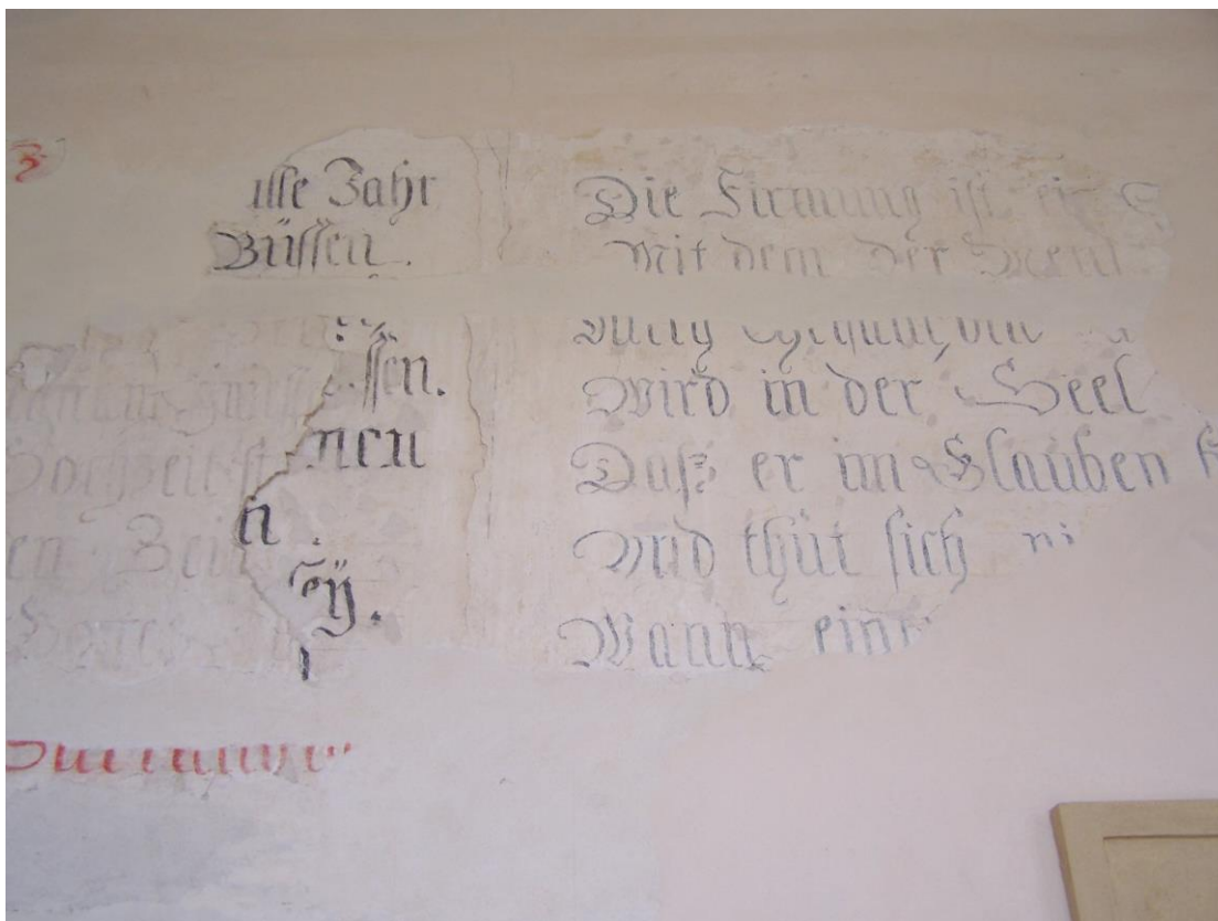
Obr. č. 22. Texty na severní fasádě Starého zámku. – Foto autor (2016).

Texty s právníkou tematikou inspirované knihou Litis abusus se dochovaly na severní fasádě Starého zámku (původním pavilonu pro služebnictvo). Na fotografii je dobře patrná vrstevnatost textů. Spodní vrstva odkazuje na autocenzurní zásah Šporka, ke kterému došlo v souvislosti s kacírským procesem. Špork za účasti svého přítele, mladoboleslavského krajského hejtmana hraběte z Klenové, nechal 23. IX. 1729 „ motu proprio odstranil všechny pohoršlivé nápisy, jakož i vyobrazení a sochy v Bon Repos, pokud nebyly přeměněny do zbožné podoby “. O tom Špork následně 6. XI. 1729 napsal místodržícím memoriál adresovaný na královské gubernium v Praze.