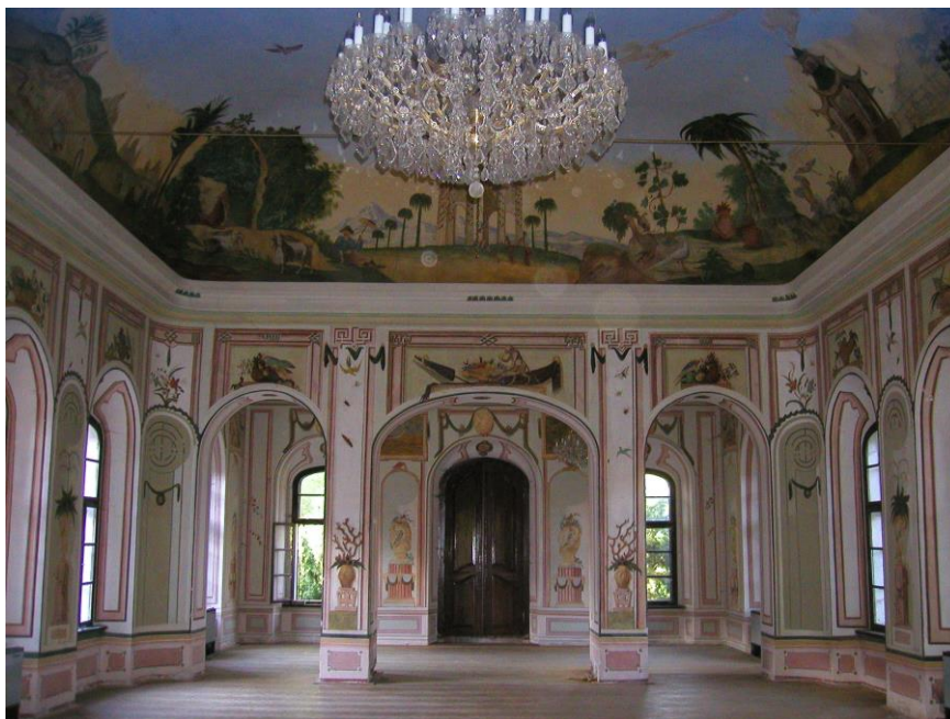
Obr. č. 24a. Interiér Čínského pavilonu. – Foto autor (2004).