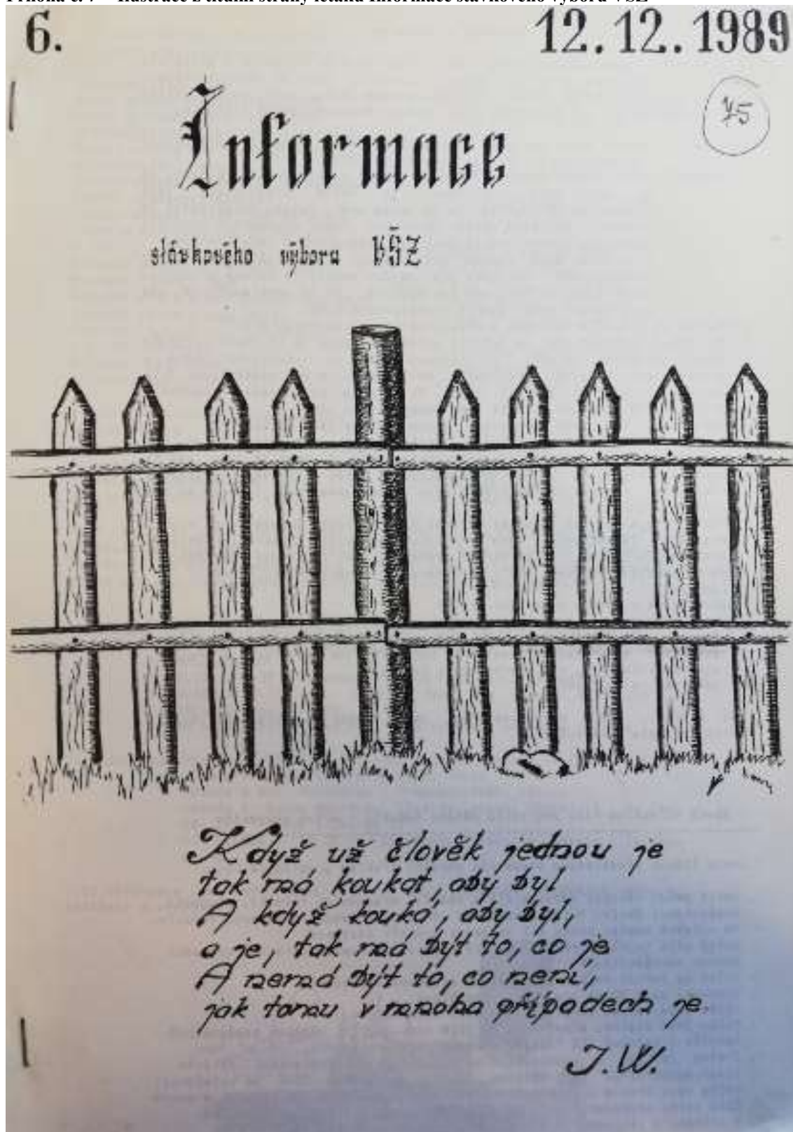
Zdroj: Archiv ČZU, fond OF – VŠZ DOKUMENTY IX. 89 – VI. 90, „Informace stávkového výboru VŠZ“ (12. 12. 1989).