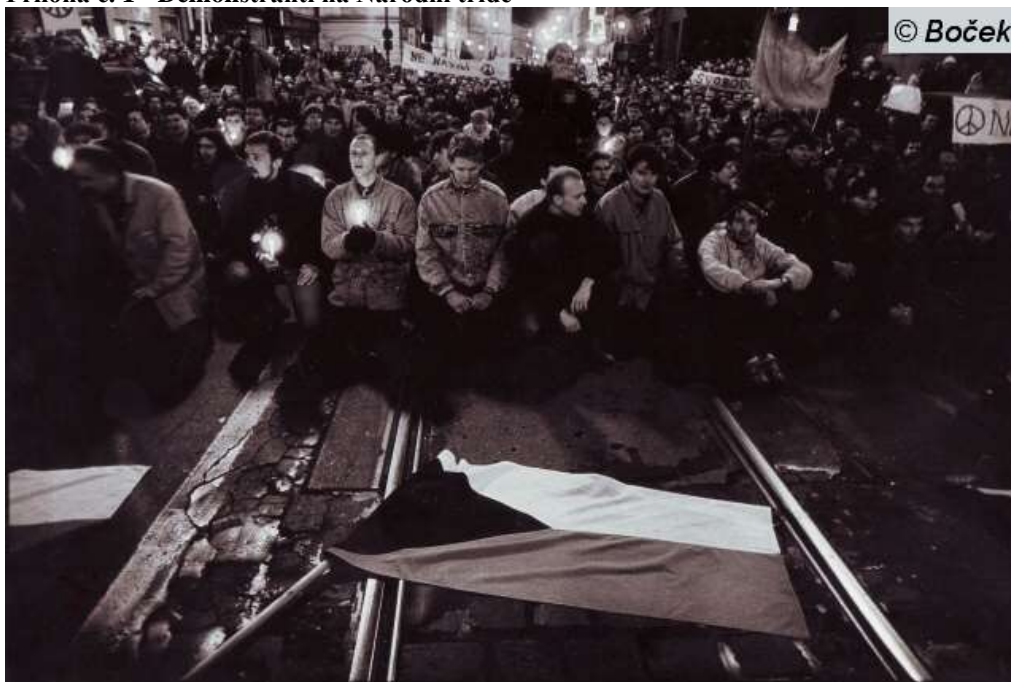
Příloha č. 1 - Demonstranti na Národní třídě