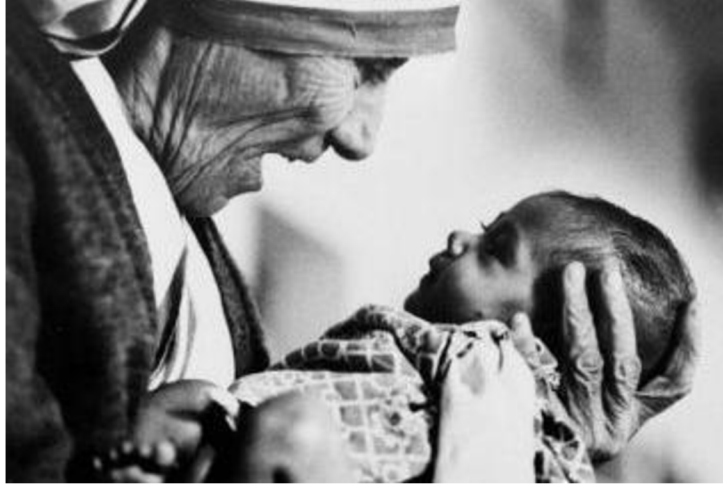
Obrázek 1- Matka Tereza s dítětem

„Pokud chcete změnit svět, chod'te domů a milujte svoji rodinu.“