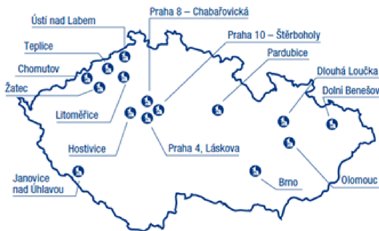
Obrázek 1 - Přehled ZDVOP FOD Klokánků pro rok 2022

Klokánky mají pověření MPSV jako zařízení pro děti vyžadující okamžitou pomoc. Podle interních informací od paní ředitelky z jednoho nejmenovaného Klokánku se bude jeden Klokánek v Janovicích nad Úhlavou rušit z důvodu nadbytečnosti ZDVOPů v kraji. Mají tam dostatek státních zařízení a má dlouhodobě nízké číslo umístěných dětí. Bude plně uzavřen po odchodu stávajících dětí. Další děti už nepřijímá. Klokánků bude brzy jen 14 (Zdroj: www.fod.cz ).