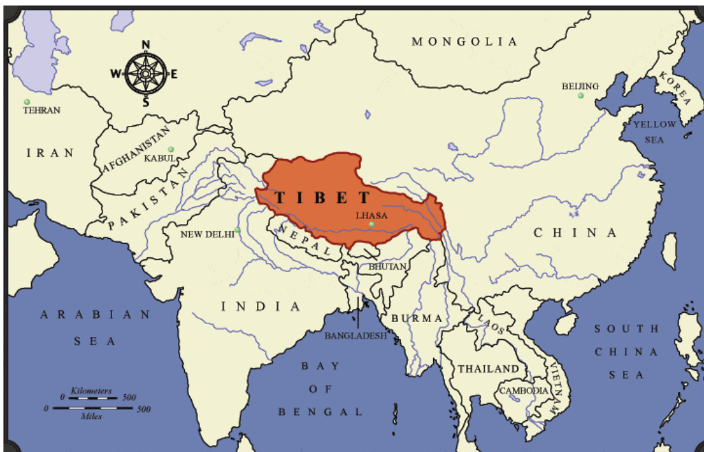
Mapa Autonomní oblasti Tibet