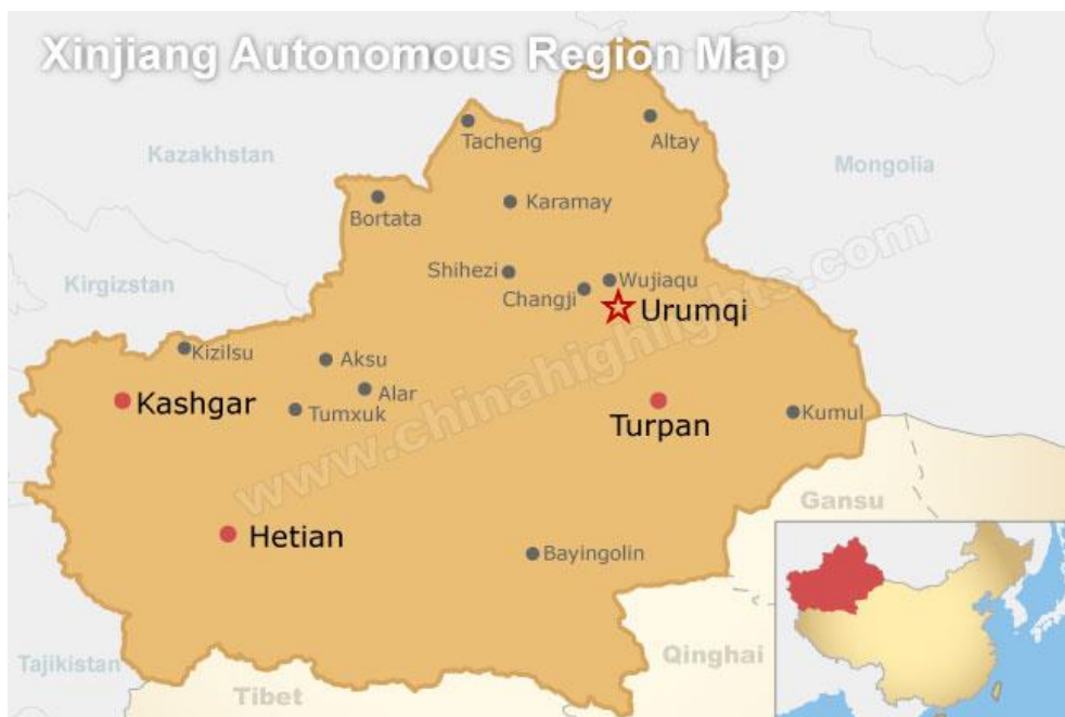
Mapa Ujgurské autonomní oblasti Sin-ťiang