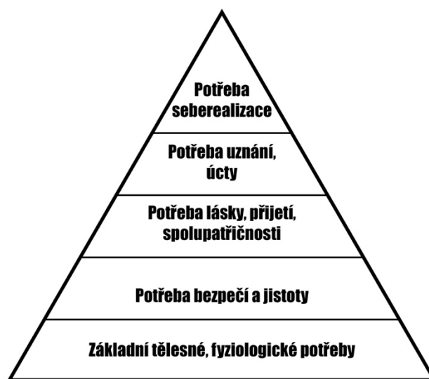
Obrázek 1 – Pyramida potřeb

Cílem mateřské školy je tedy vytvářet vhodné podmínky pro realizaci vzdělávání. Středem zájmu jsou především děti a jejich naplňování potřeb, kterými se zabýval Maslow (2014) ve své knize O psychologii bytí rozděluje potřeby do pěti pater tzv. „pyramidy“, kde jsou patra rozdělena podle nejdůležitějších oblastí. Podle Maslowa platí, že pokud není splněno nižší patro, nemůže dojít ke splnění patra vyššího. Není-li naplněna jedna z pěti potřeb, dítě není schopno se vzdělávat a z dlouhodobého hlediska se může jednat o dítě ohrožené (Svobodová, 2010). Může dojít i k výjimkám, kdy se potřeby chovají autonomně a děti si v zápalu hry své potřeby neuvědomují (Svobodová, 2007).