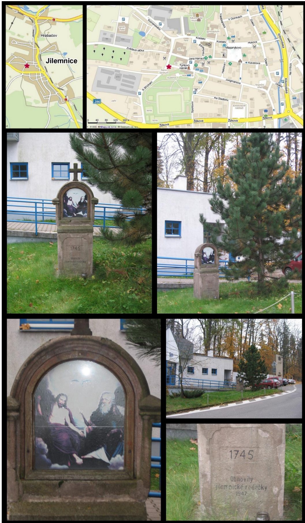
Obr. č. 6 Fotodokumentace - Boží muka u centra SANO