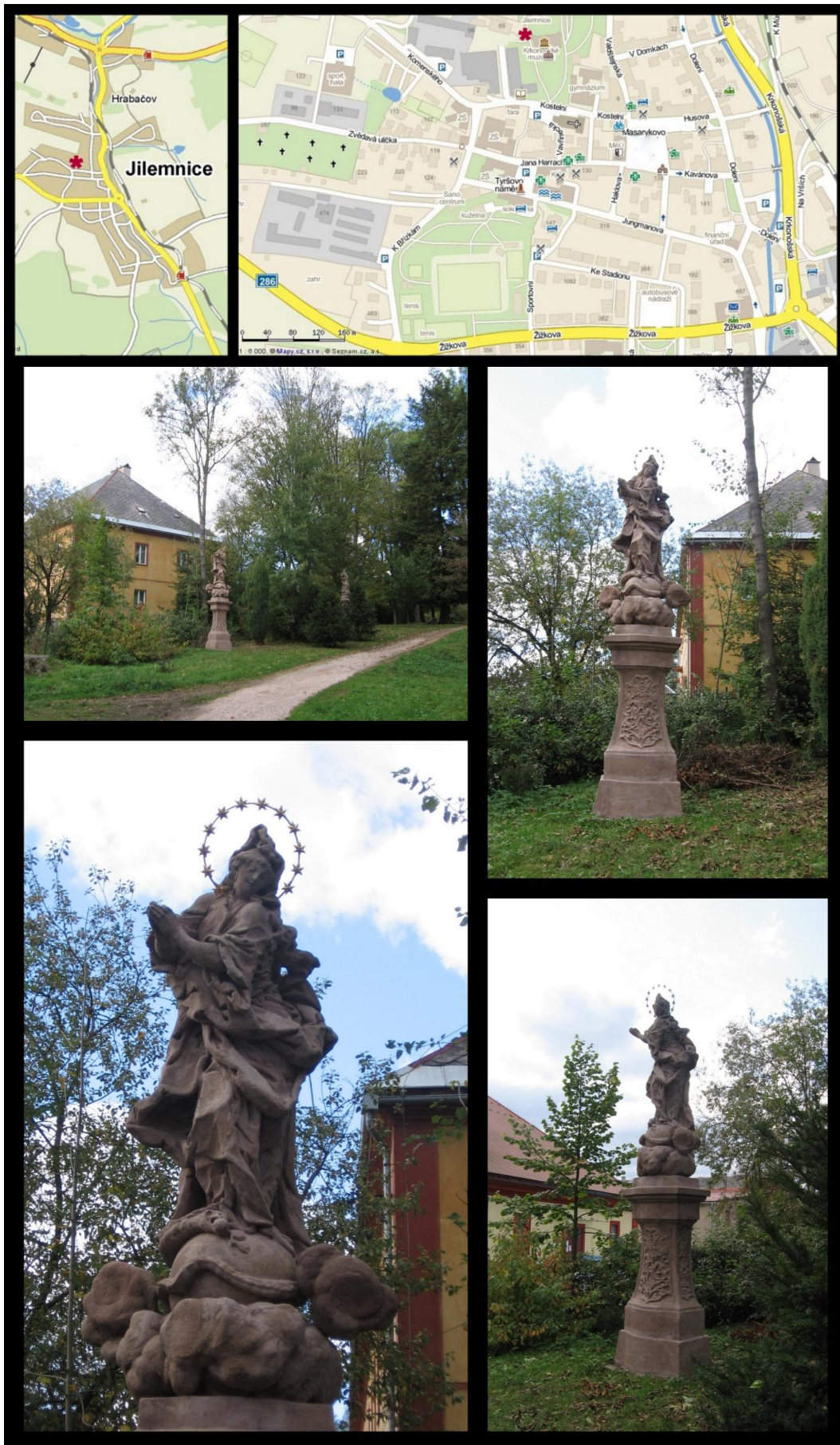
Obr. č. 20 Fotodokumentace - Socha Panny Marie - Immaculaty