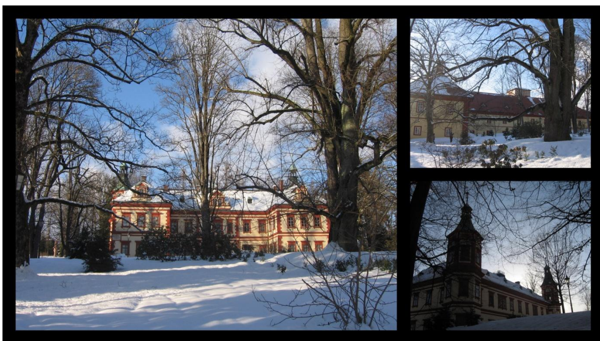
Obr. č.3. Jilemnický zámek

V parku severozápadně od náměstí stojí původně renesanční zámek z 16. století postavený na místě gotické tvrze. V roce 1646 i s městečkem byl vypálen Švédy. V roce 1701 ho koupil Aloisi Harrach a nechal ho v roce 1716 barokně upravit. Dnešní novorenesanční podobu získal po přestavbě v letech 1895-98. Je to trojkřídlá patrová budova, se dvěma šestibokými nárožními věžemi a členitou fasádou, na kterou navazuje volně řešený zámecký park. U zámku je bývalý barokní pivovar z roku 1701 s výrazným barokním portálem zdobeným znakem Harrachů. Po válce budova i pozemky připadly československému státu. Dnes je zde Krkonošské muzeum založené v roce 1891 v souvislosti s prvními přípravami na Národopisnou výstavu československou v Praze. Největší částí je expozice dějin lyžařství a dále láká také unikátní pohyblivý betlém (David a kol., 2010).