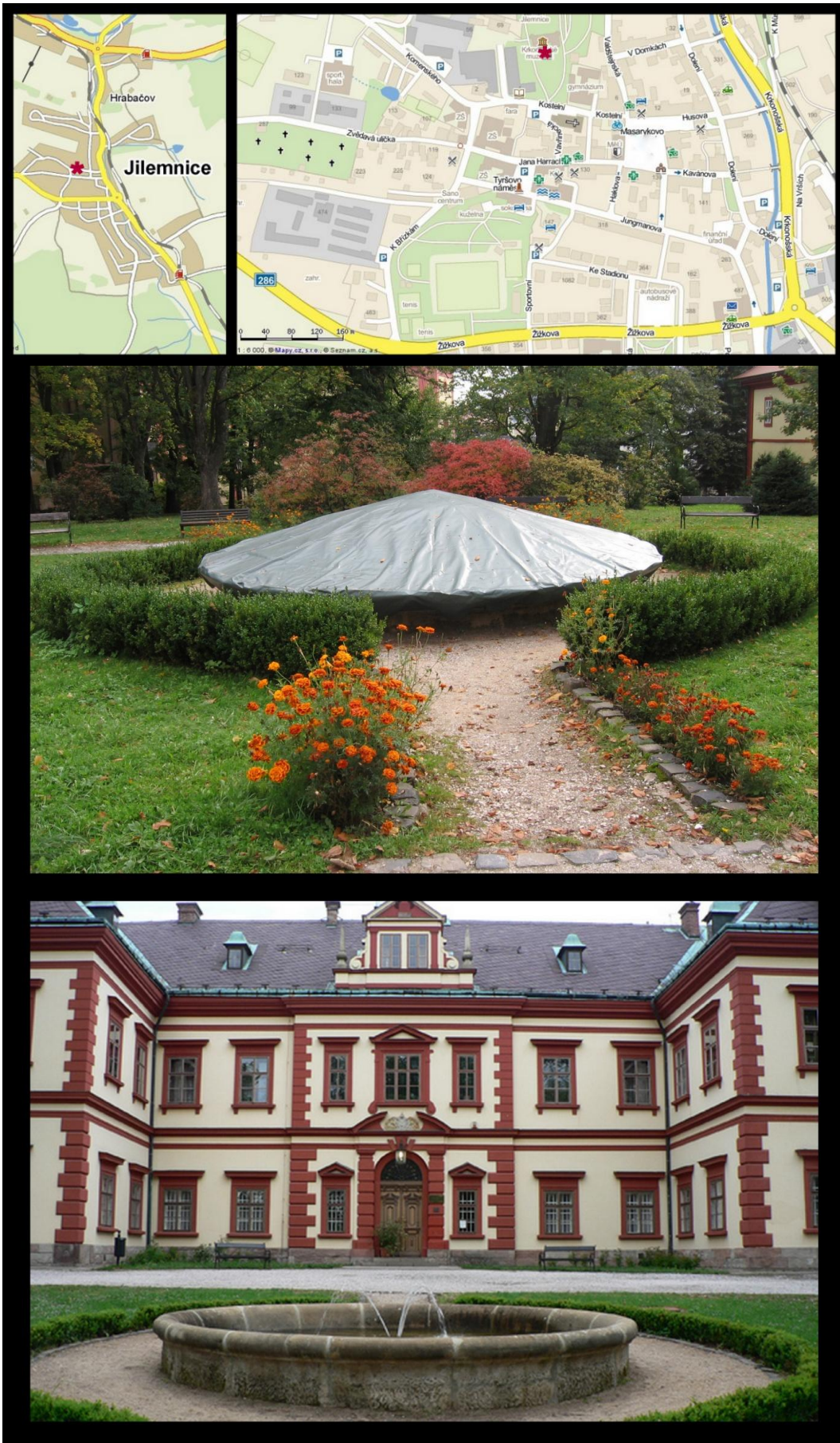
Obr. č. 12 Fotodokumentace - Kašna v zámeckém parku