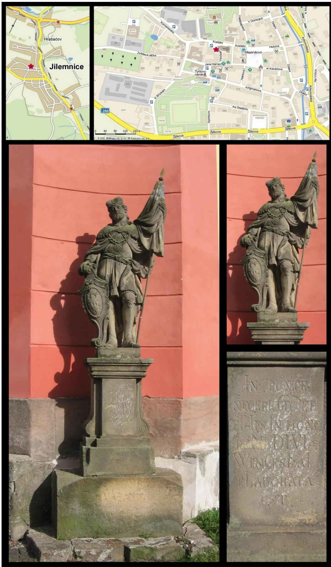
Obr. č. 28 Fotodokumentace - Socha svatého Václava