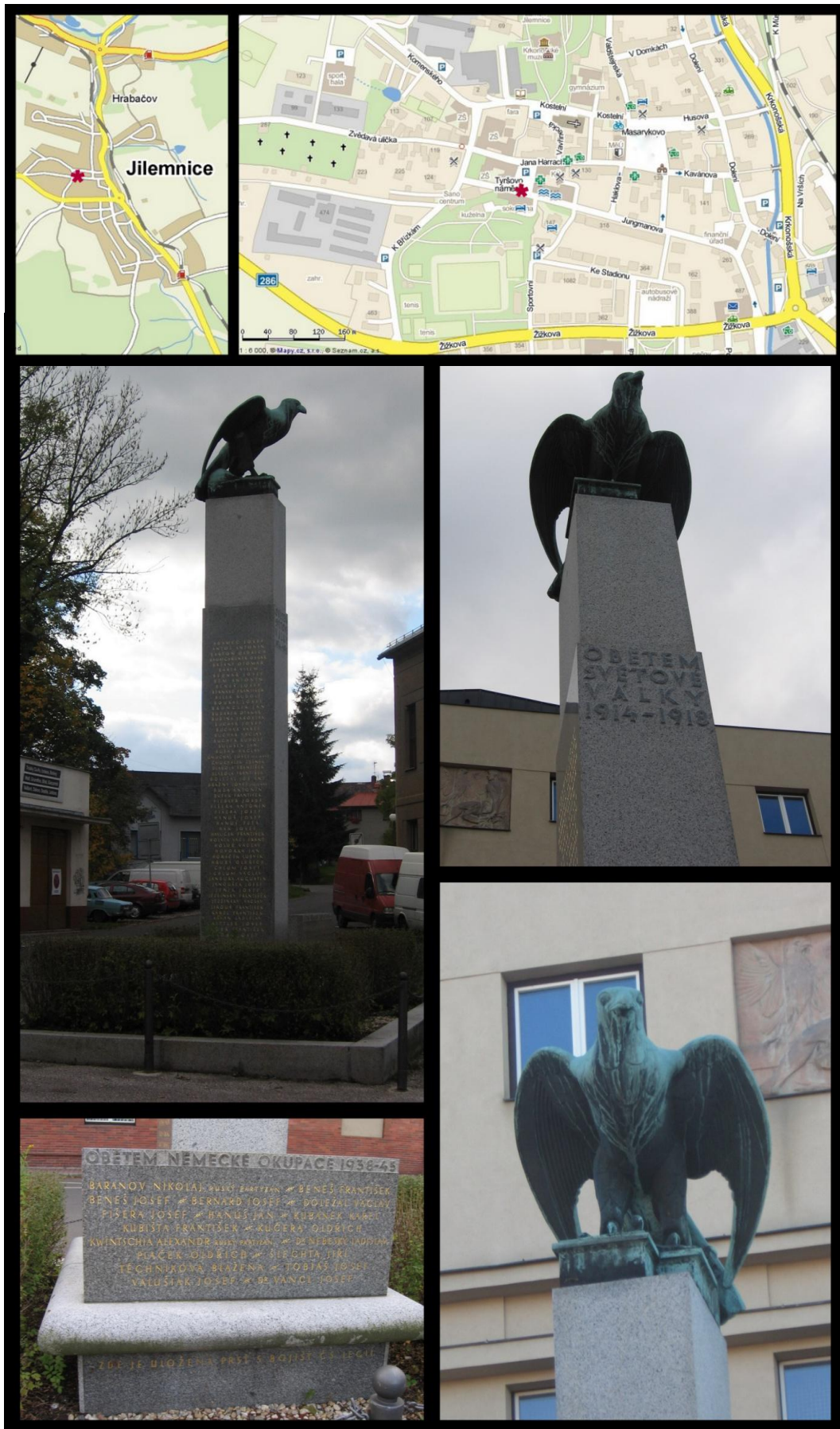
Obr. č. 18 Fotodokumentace - Pomník obětem 1. sv. války a obětem německé okupace