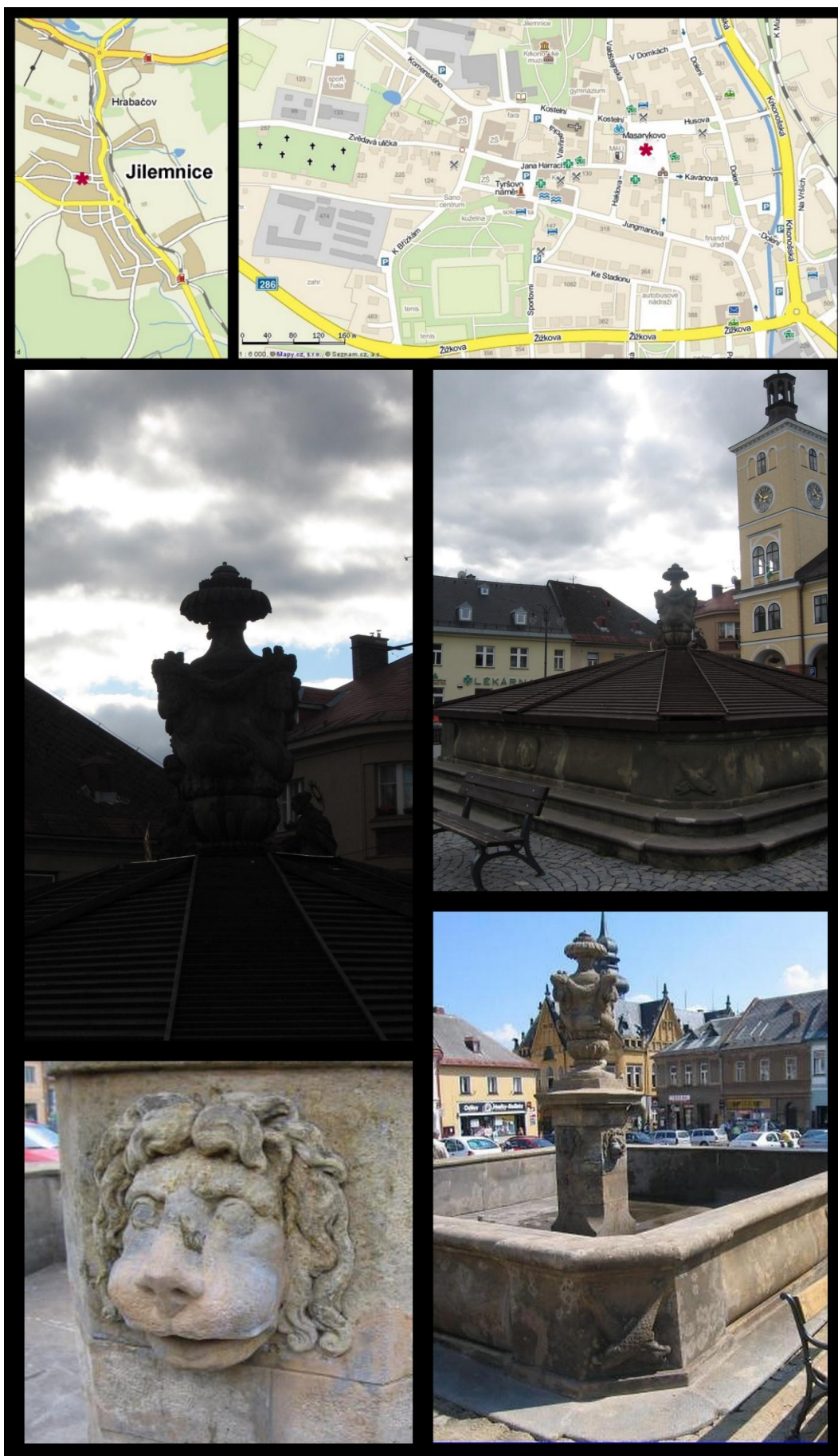
Obr. č. 13 Fotodokumentace - Kašna na Masarykově náměstí