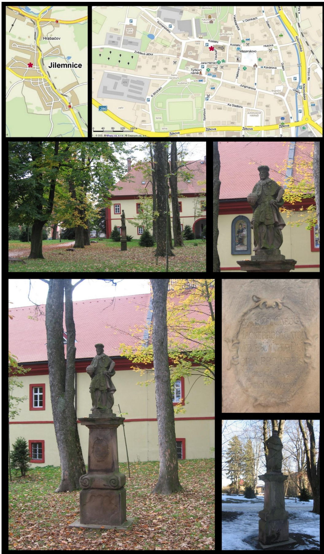
Obr. č. 27 Fotodokumentace - Socha sv. Karla Velikého