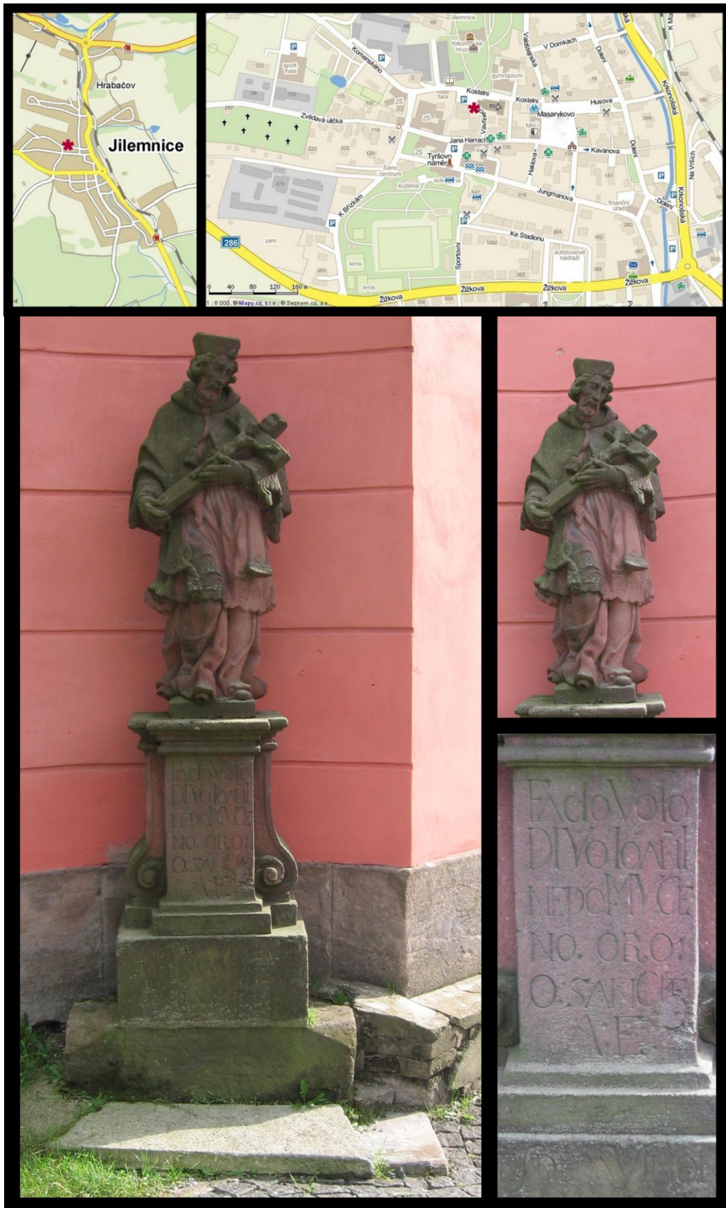
Obr. č. 24 Fotodokumentace - Socha svatého Jana Nepomuckého v areálu kostela sv. Vavřince