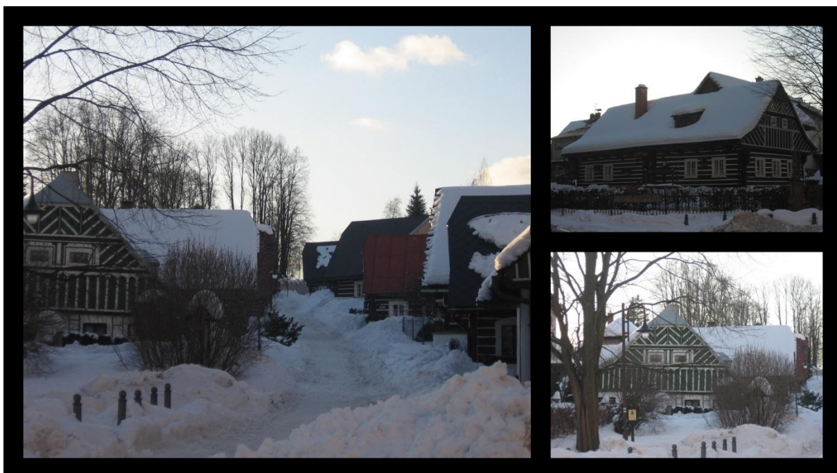
Obr. č. 4. Zvědavá ulička

většinou o jednu okenní osu směrem do ulice. Domy Zvědavé uličky jsou roubeny z mohutných trámů a spáry mezi nimi zvané lišty jsou vyplněny mazaninou z jílu, plev a pazdeří. Trámy se původně konzervovaly volskou krví, lišty se bílily. Nejhonosnější část stavby roubených domů tvoří lomenice pobíjené ozdobně vyřezávanými lištami a uzavřené kuklou, v níž bývalo umístěno bohatě malované záklopové prkno s prosbou o Boží ochranu, údaj o vyzdvižení domu, případně se záznamem pamětihodných událostí příslušného roku. Dnes známe jen zlomek textů, a to pouze z opisu uložených v Krkonošském muzeu. Mnohá stavení byla později doplněna přístavky, změnila se střešní krytina, ještě na počátku 20. století výhradně šindelová. V minulosti ve Zvědavé uličce žili především drobní řemeslníci – tkalci, pekaři, fiakrista, cvočkář, kartáčník a mnoho dalších. Zvědavá ulička tak představuje dnes již ojedinělý doklad krkonošské roubené předměstské zástavby.