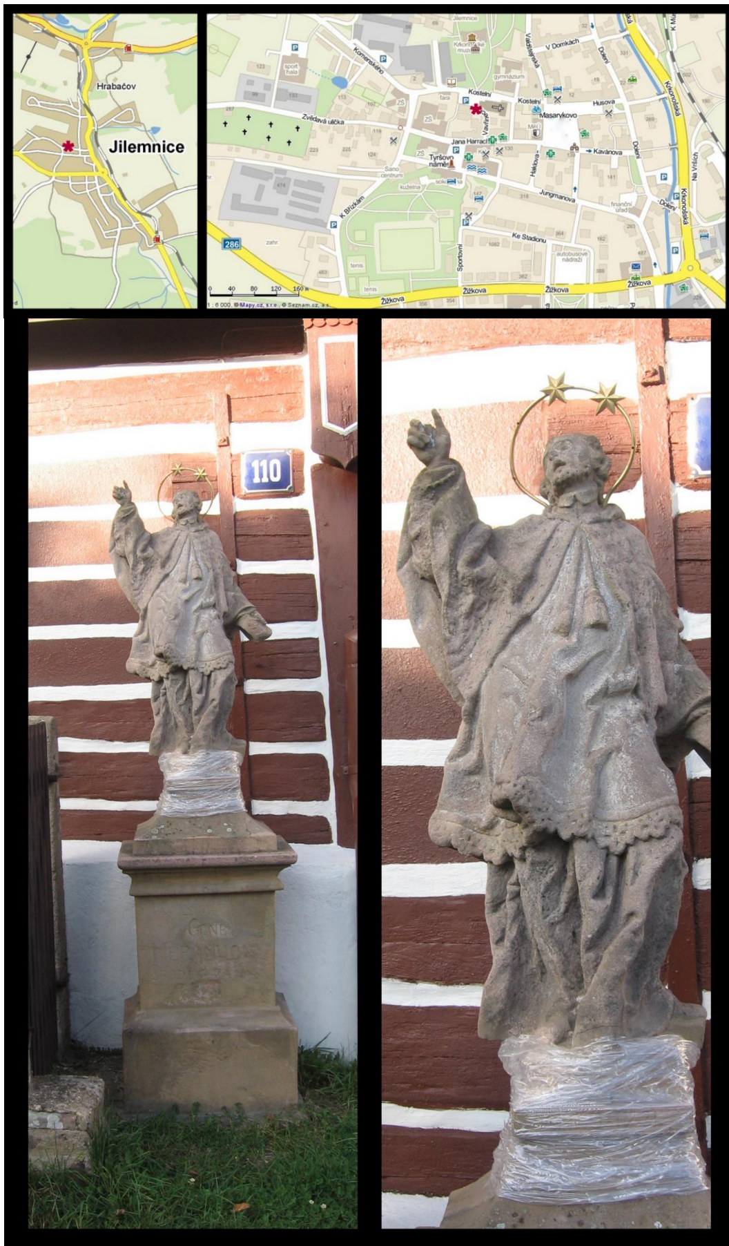
Obr. č. 23 Fotodokumentace - Socha sv. Jana Nepomuckého ve Zvědavé uličce