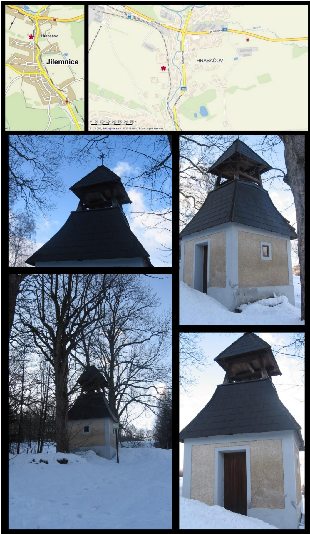
Obr. č. 31 Fotodokumentace - Zvonice