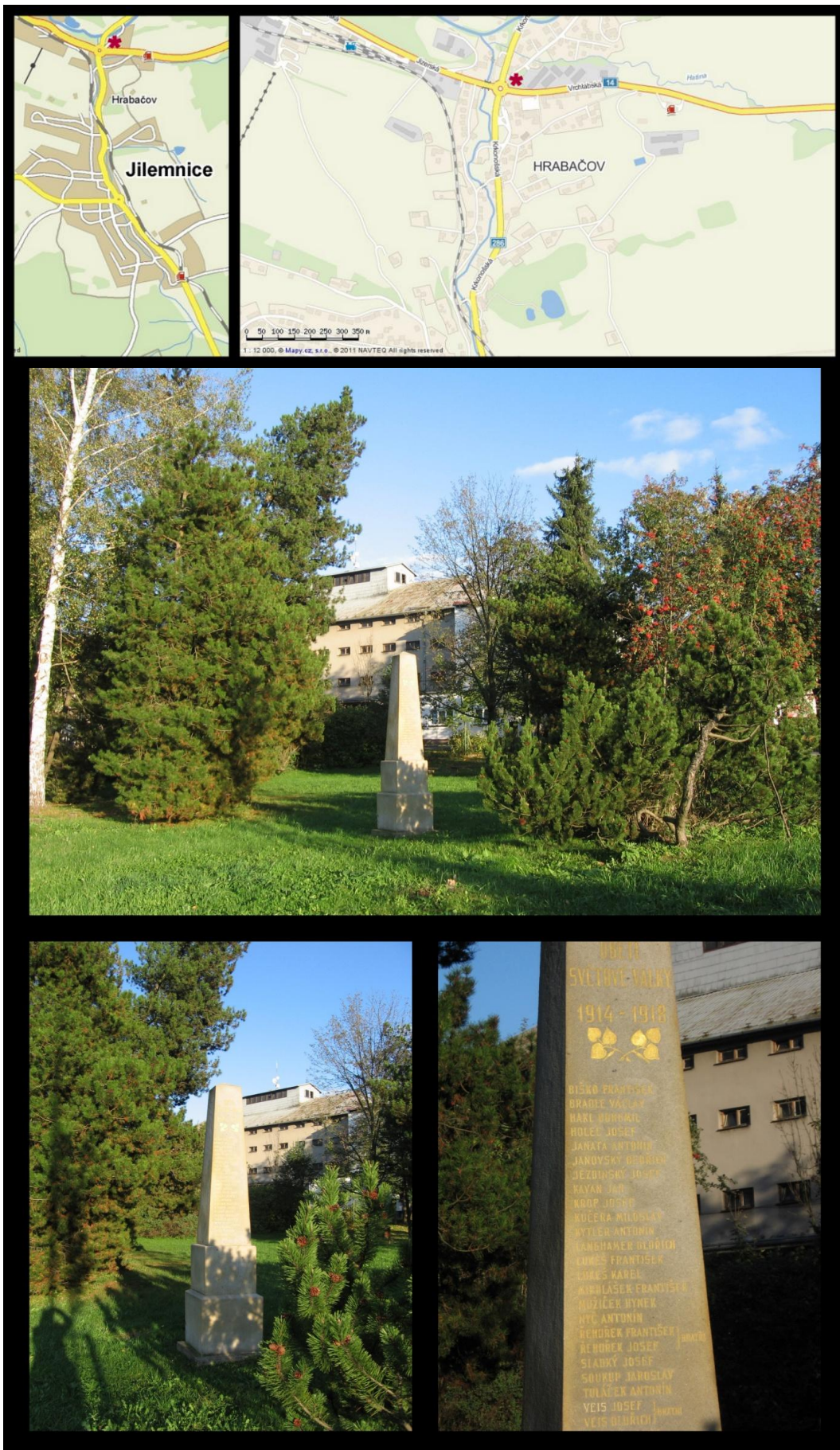
Obr. č. 17 Fotodokumentace - Pomník obětem 1. sv. války