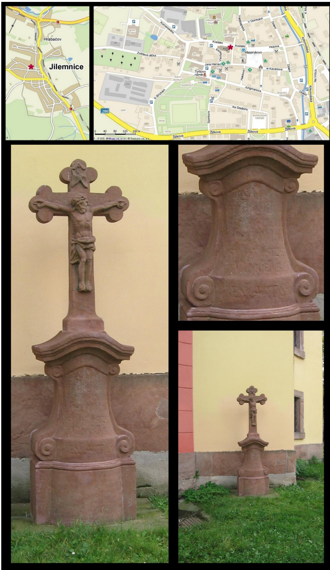
Obr. č. 14 Fotodokumentace - Kamenný kříž