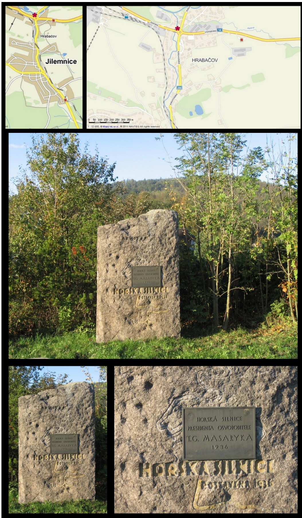
Obr. č. 16 Fotodokumentace - Památník horské silnice T.G.Masaryka