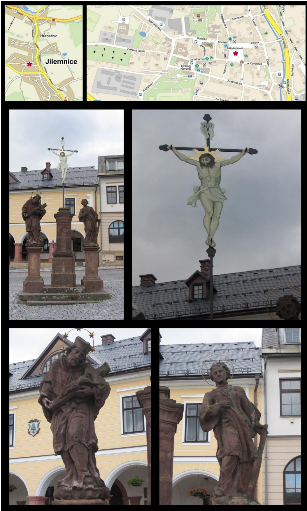
Obr. č. 30 Fotodokumentace - Sousoší Svatého Kříže, Ukřižovaného Krista, sv. Jana Nepomuckého a sv. Vavřince