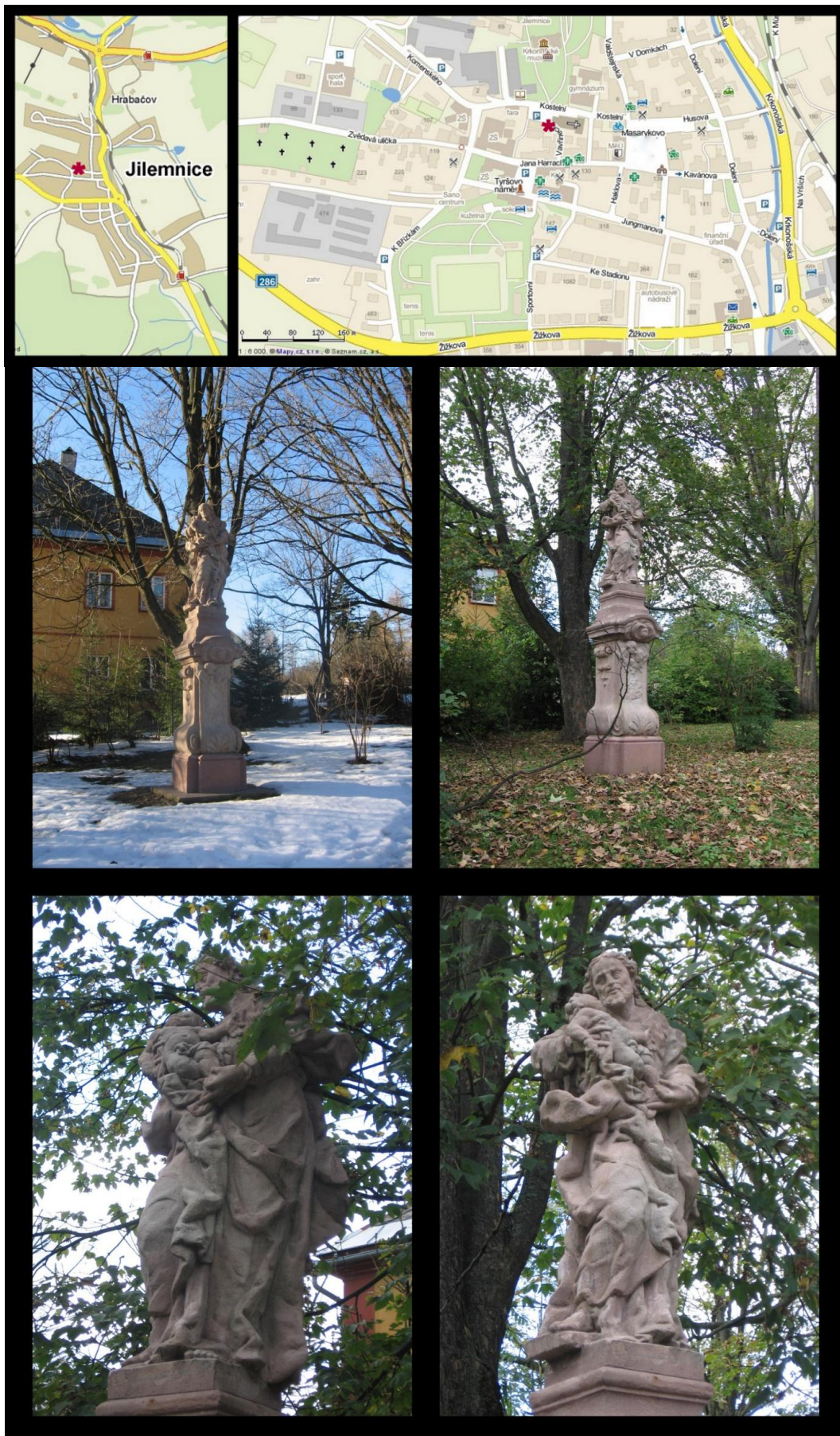
Obr. č. 26 Fotodokumentace - Socha sv. Josefa v zámeckém parku