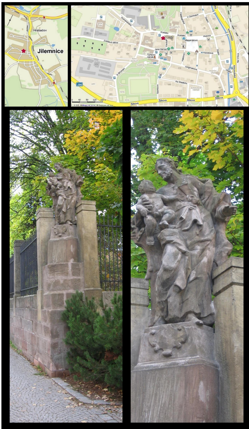
Obr. č. 25 Fotodokumentace - Socha sv. Josefa v ulici Komenského