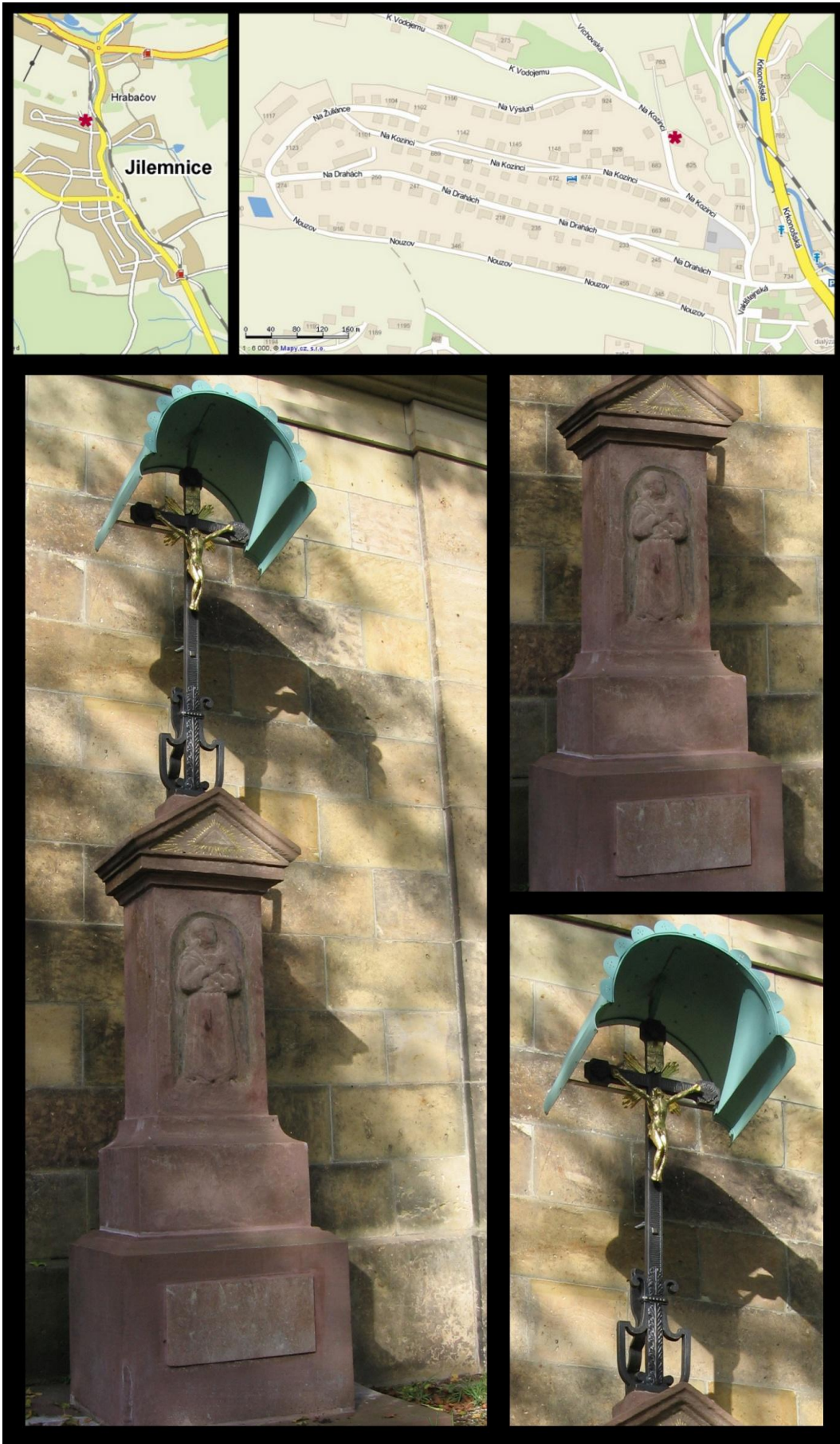
Obr. č. 7 Fotodokumentace - Boží muka u kaple sv. Anny