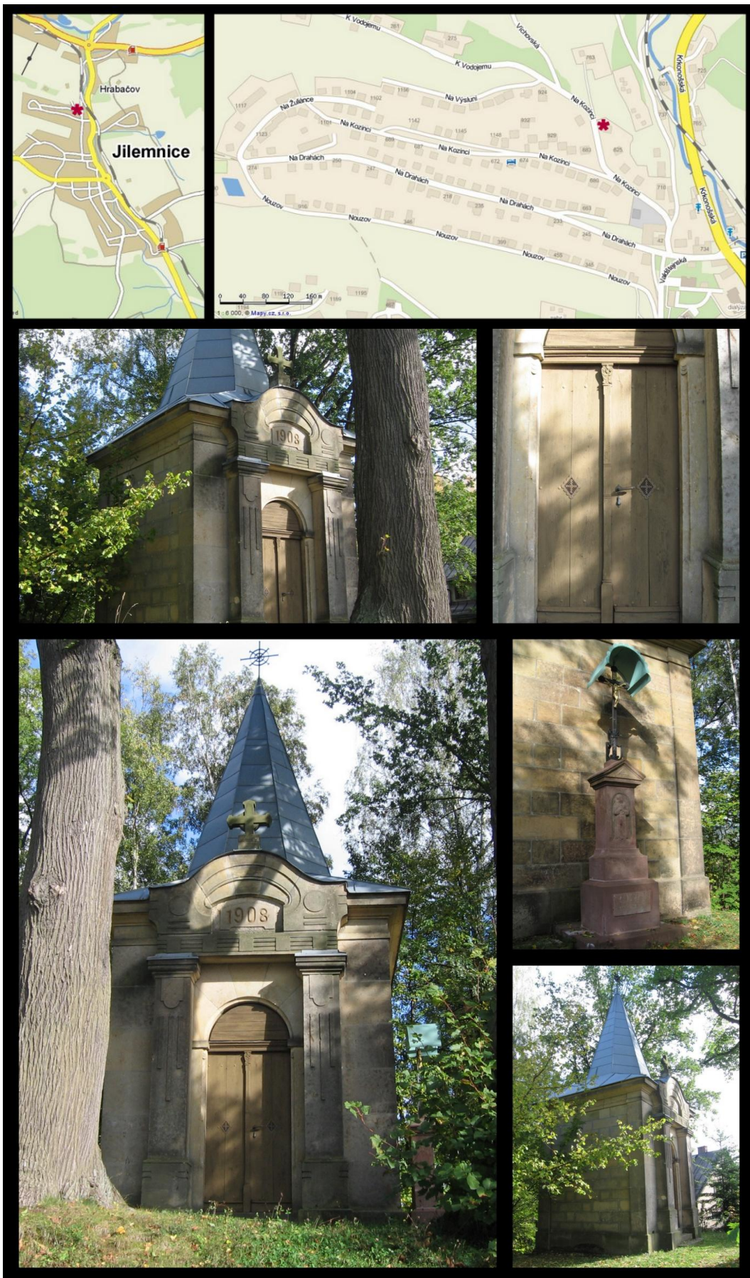
Obr. č. 10 Fotodokumentace - Kaple sv. Anny