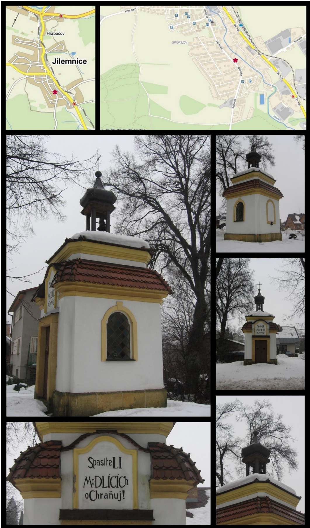
Obr. č. 9 Fotodokumentace - Kaple Božího Těla