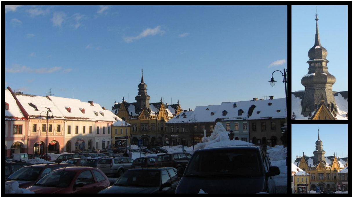
Obr. č. 5 Pohled na náměstí a budovu spořitelny

Z moderní architektury je třeba zmínit novorenesanční bývalou dívčí školu z roku 1898 a spořitelnu z let 1910-11, obě projektované Janem Vejrychem, budovu bývalého soudur roku 1923 od Františka Roitha, funkcionalistickou vilu MUDr. Jiřího Fischera postavenou před rokem 1934 podle návrhu Václava Kolátora, která dnes slouží jako základní umělecká škola. Novobaroční budova bývalé Občanské záložny je z roku 1868 a kopulí z roku 1900.