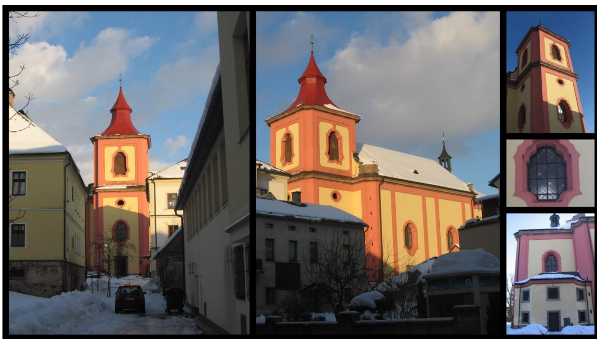
Obr. č. 2. Kostel sv. Vavřince

Druhému celku - zámeckému areálu - dominuje barokní kostel sv. Vavřince a pozoruhodný barokně-renesanční komplex zámeckých budov spolu s příjemným parkem.