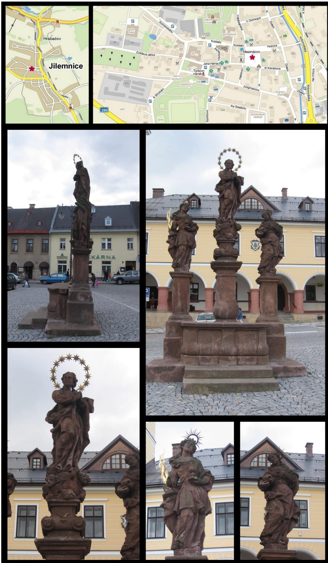
Obr. č. 29 Fotodokumentace - Sousoší Panny Marie, sv. Barbory a sv. Máří Magdalény