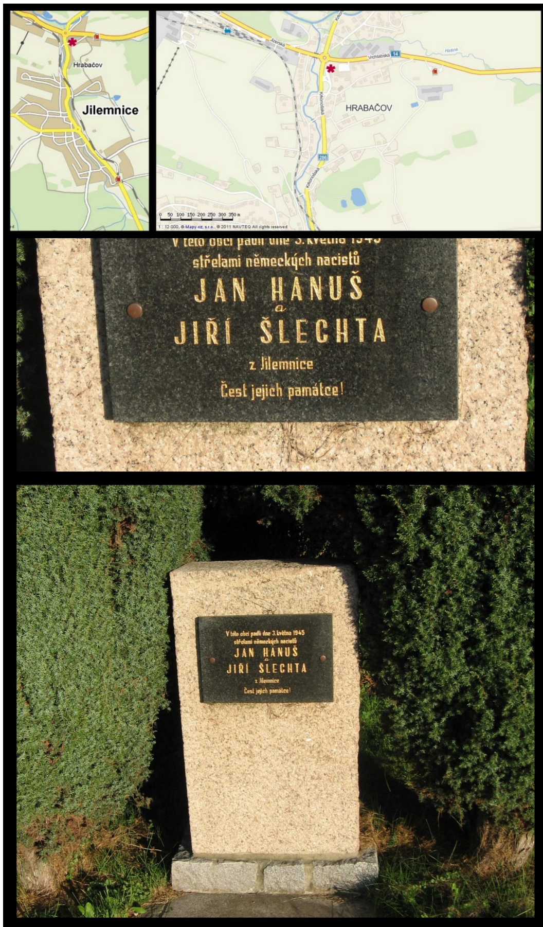
Obr. č. 19 Fotodokumentace - Pomník obětem 2. sv. války