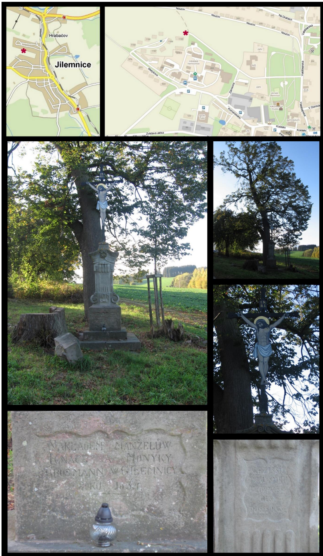
Obr. č. 15 Fotodokumentace - Kříž (tzv. Machačův)