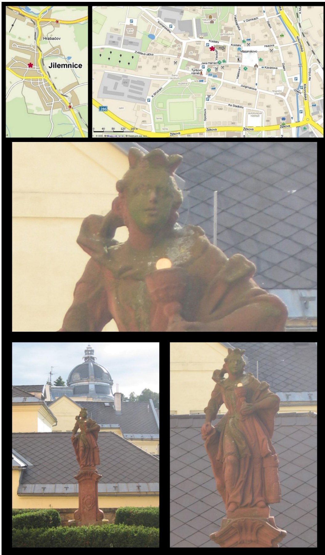
Obr. č. 21 Fotodokumentace - Socha svaté Barbory