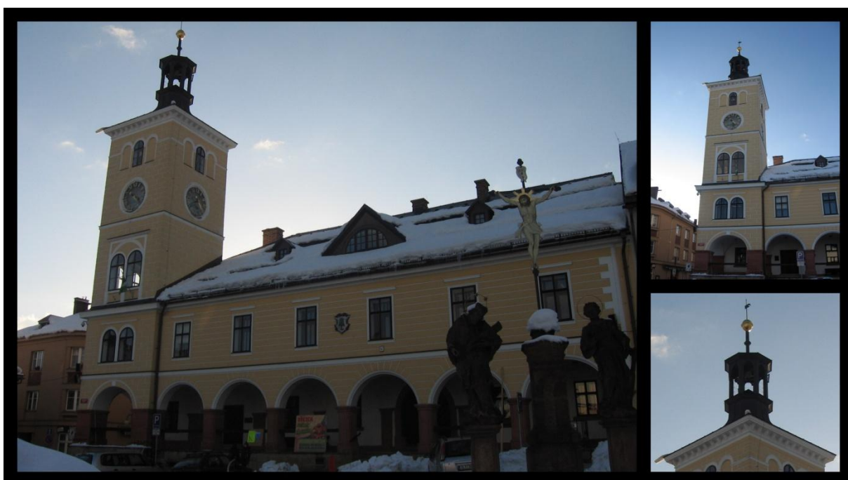
Obr. č. 1. Jilemnická radnice

První tvoří náměstí, které si dodnes uchovalo pravidelný středověký půdorys, a síť ulic z náměstí vycházejících. Klidná a vyrovnaná hladina jednopatrových domů mu propůjčuje přirozenou vyváženost a dobře se v ní uplatňují dvě dominanty - radnice a budova bývalé městské spořitelny.