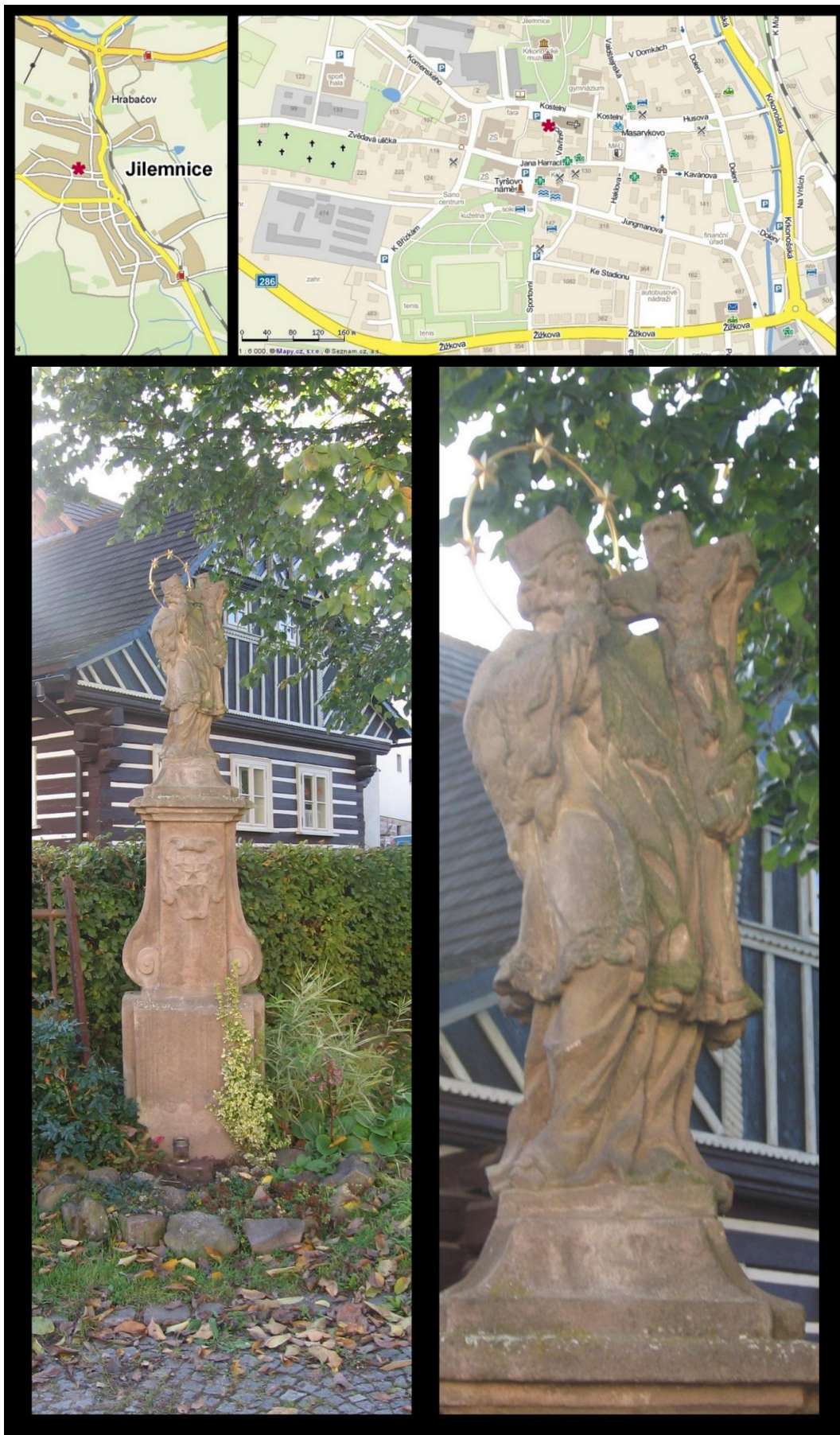
Obr. č. 22 Fotodokumentace - Socha sv. Jana Nepomuckého u tzv. Šaldova statku