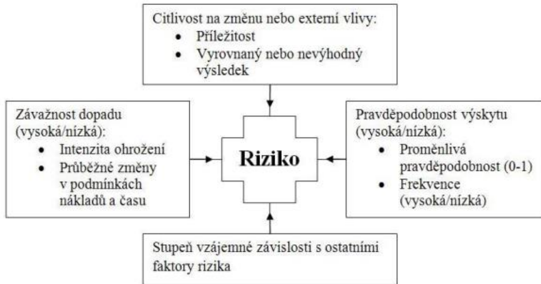
Obrázek 1 - Typické parametry rizika

Model na následujícím obrázku předpokládá, že riziko je složeno ze čtyř základních parametrů: pravděpodobnost výskytu, závažnost dopadu, citlivost na změnu, stupně vzájemné závislosti a z ostatních faktorů rizika. Pokud nejsou přítomny veškeré faktory zmíněné výše, tak potom se situace nebo událost nemůže označovat jako riziko. 5