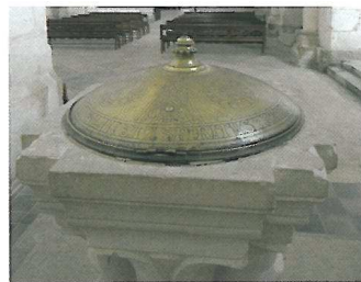
Baptistère de l'église abbatiale de Pontigny. Yonne.