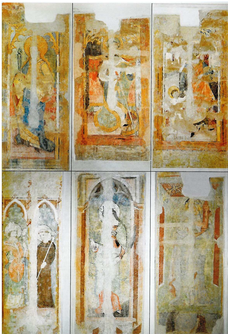
Příloha VI. Kostel Obětování Panny Marie, nástěnné malby na mezilodních pilířích, shora zleva: sv. Apolena, sv. Kateřina, Dětství Kristovo, sv. Jiljí a sv. Biskup, sv. Anežka Římská, sv. Barbora.

Zdroj: PAVELEC, P. Dominikánský klášter v Českých Budějovicích . České Budějovice: Petr Pavelec, 2008, s. 20.