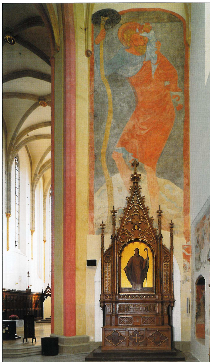
Příloha VIII. Kostel Obětování Panny Marie, nástěnná malba sv. Kryštofa

Zdroj: PAVELEC, P. Dominikánský klášter v Českých Budějovicích . České Budějovice: Petr Pavelec, 2008, s. 15.