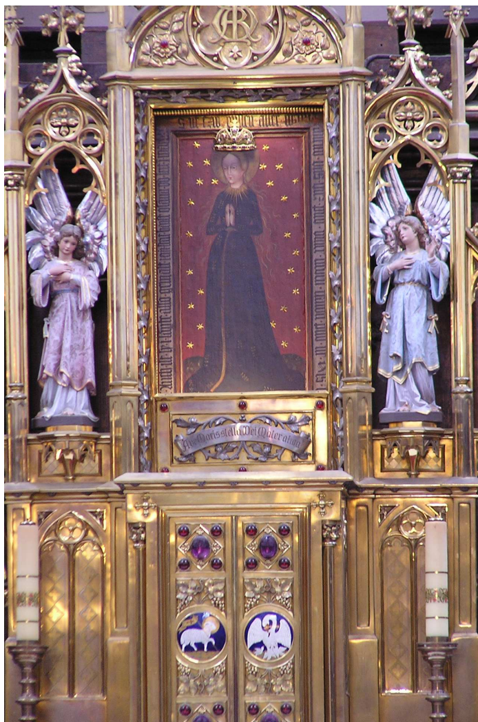
Příloha IX. Kostel Obětování Panny Marie, obraz Panny Marie Budějovické, nad svatostánkem