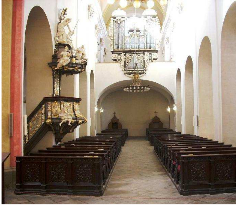
Příloha VII. Kostel Obětování Panny Marie, interiér, hlavní loď od východu s kazatelnou