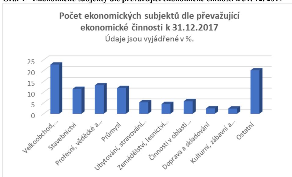
Graf 1 - Ekonomické subjekty dle převažující ekonomické činnosti k 31. 12. 2017

Zdroj: https://www.czso.cz/csu/xs/ekonomicke-subjekty-ve-stredoceskem-kraji-v-roce-2017