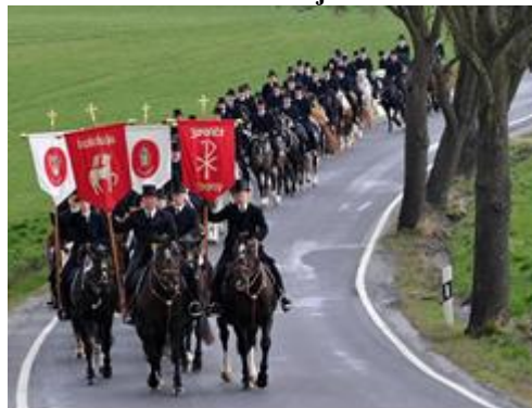
Obrázek 2 - Velikonoční jízda v Ostritz

Fríská svatba je lidovou slavností v Holandském městě Joure. Každoročně je z mladých párů, které chtějí uzavřít sňatek, vybrán jeden, který bude vystupovat na tradiční fríské svatbě. Svatby se účastní též krojovaní hosté, rodiny obou novomanželů a páry z minulých let. Svatební a bohatě nazdobený průvod projede uličkami města, odkud ho každoročně sleduje velké množství diváků. Svatebčané jedou ve dvoukolových sulcích