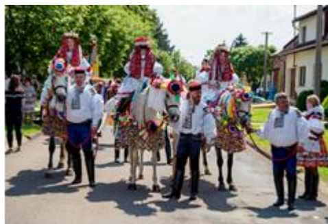
Obrázek 1 - Jízda Králů na Slovácku

Jízda Králů je lidovou tradicí patřící do obyčejů moravského Slovácka. Asi nejznámější je Jízda Králů ve Vlčnově, které se účastní kolem 500 krojovaných účastníků a každoročně přiláká tisíce návštěvníků. Od roku 2011 je akce zapsána na seznamu kulturního dědictví UNESCO. Vlčnovská Jízda Králů se koná na konci května a nabízí pestrou podívanou na typické moravské kroje, bohatě zdobené koně, folklorní zpěv a ochutnávku lokálních produktů a vín. V průvodu jedou na koních mladí, osmnáctiletí muži a umění jezdit na koni má demonstrovat jejich čerstvou dospělost. Králem je mladý chlapec z místní rodiny, na kterého se vybírají od okolí dary. Král jede většinou na bílém koni v dívčím kroji a s růží v ústech na důkaz mlčení.