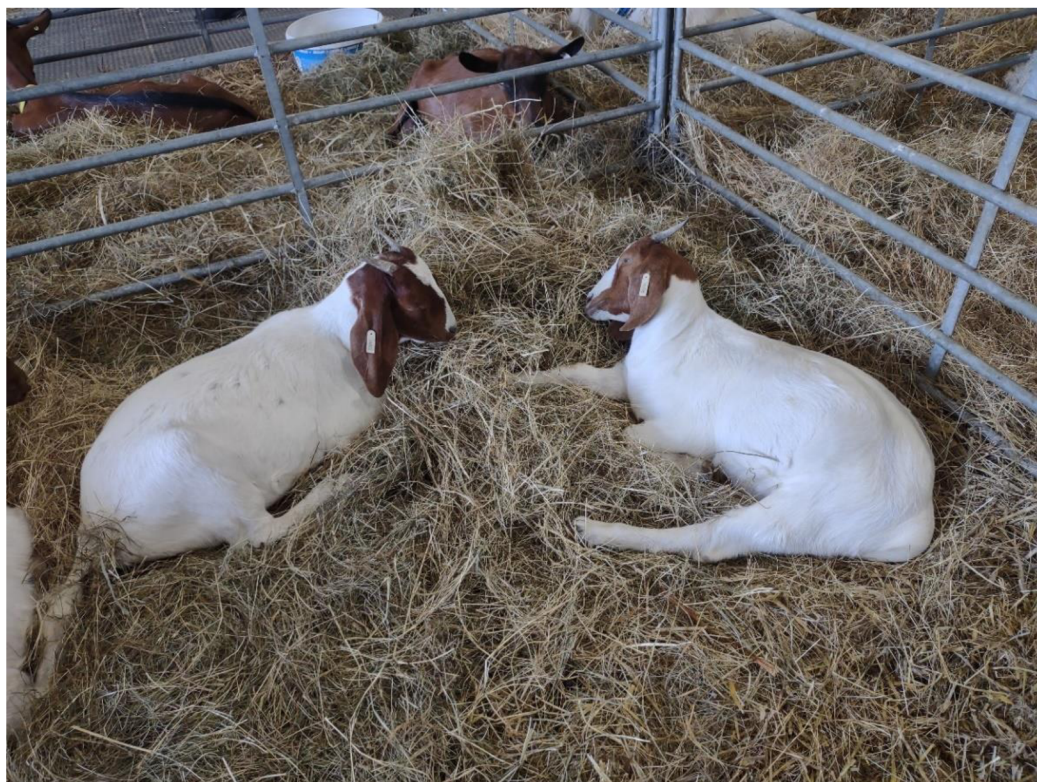
Obr. 3 Kůzlata kozy bůrské (foceno autorkou, 2021).