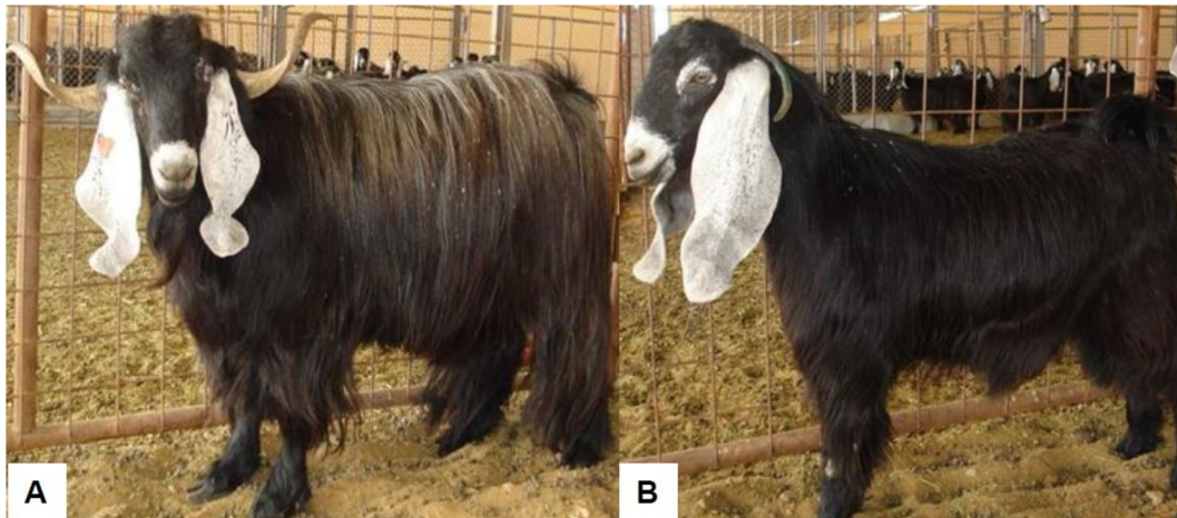
Obr. 5 Plemeno Ardi, A = samec, B = samice (Aljumaah et al., 2012), neupraveno.