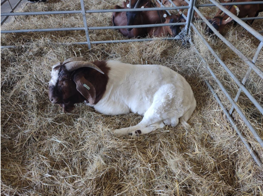
Obr. 1 Kozel búrský.