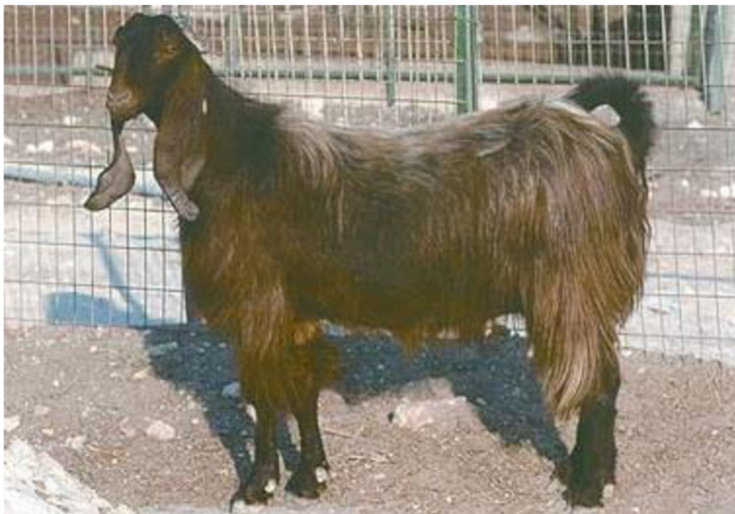
Obr. 6 Koza damašská (Mavrogenis et al., 2006), neupraveno.