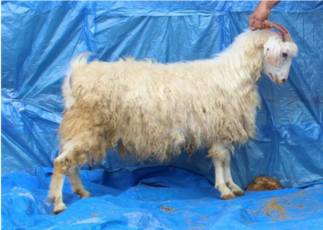
Obr. 9 Plemeno markhoz (Nazari-Ghadikolaei et al., 2018), nepraveno.