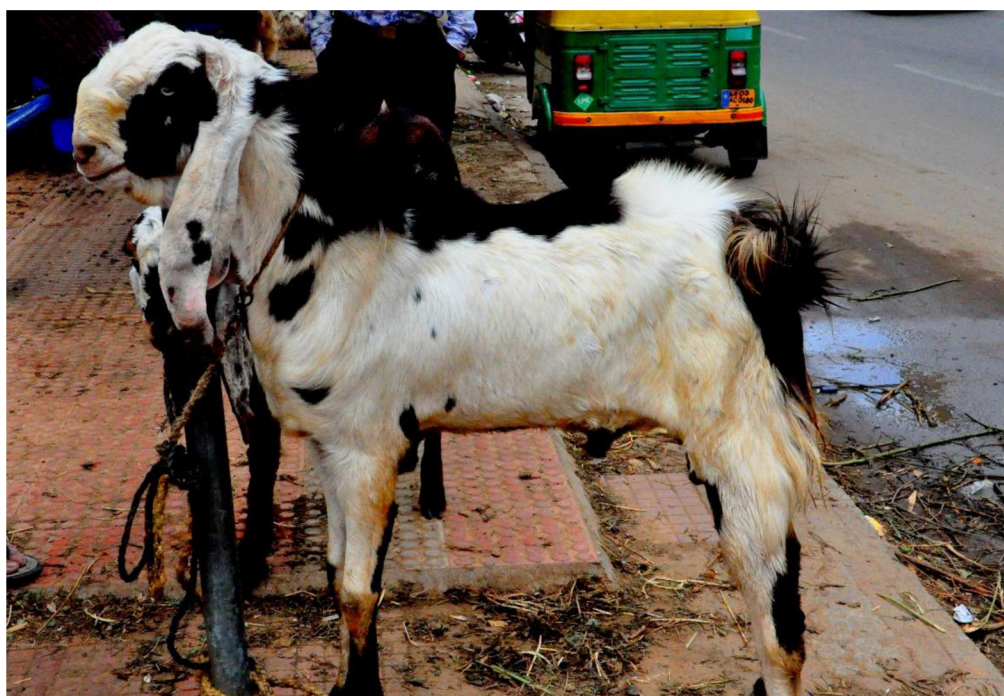
Obr. 8 Plemeno jamunapari (PL Tandom, 2017), neupraveno.

< https://www.flickr.com/photos/13070711@N03/37542532246/ >