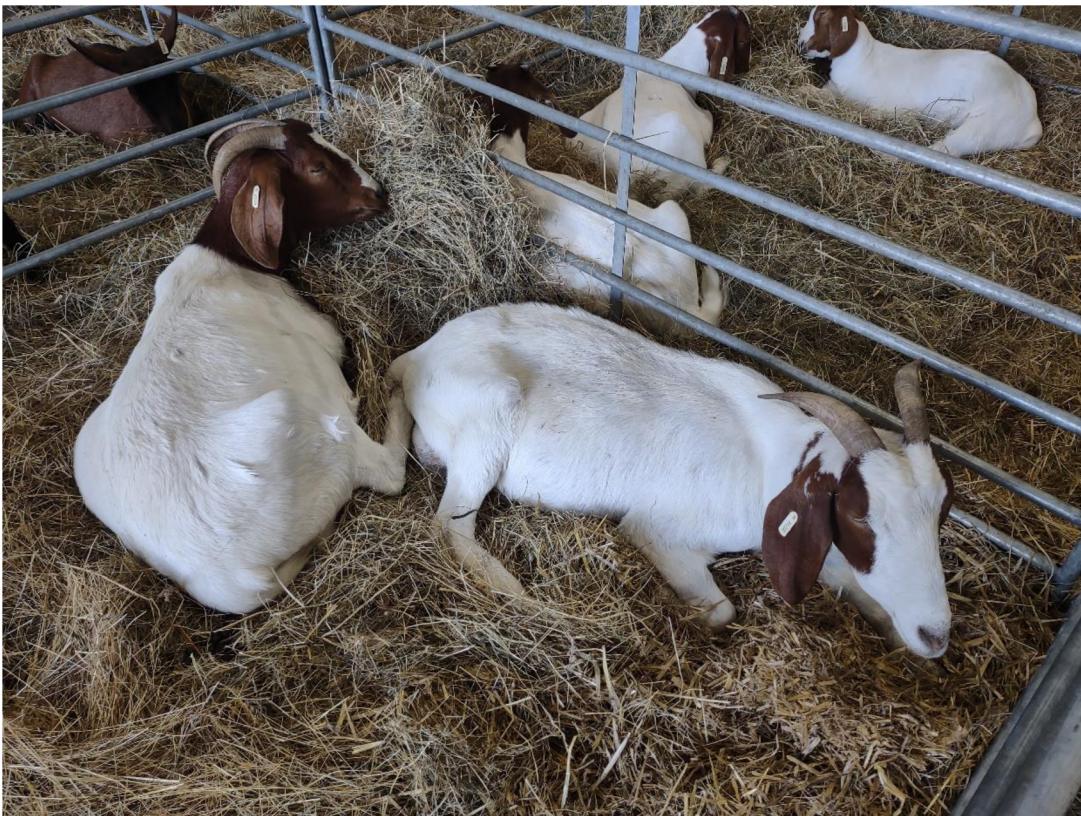
Obr. 2 Kozy búrské (foceno autorkou, 2021).