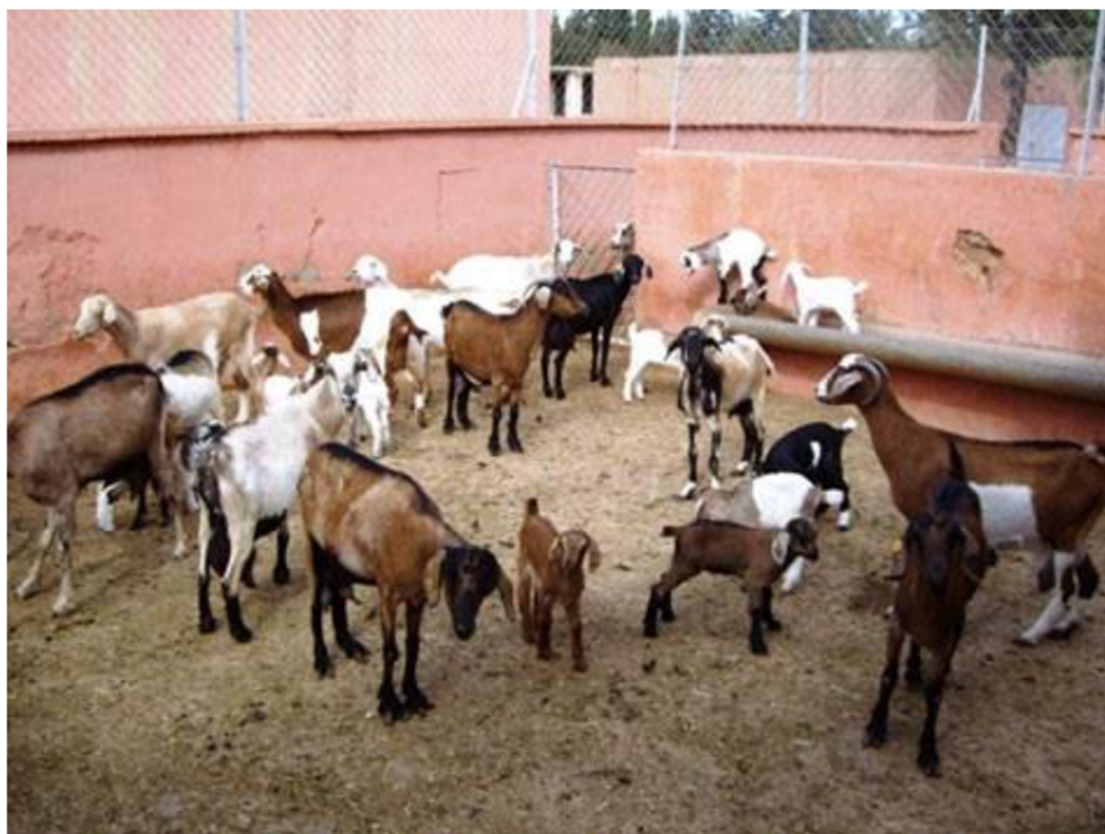
Obr. 7 Plemeno draa (Ibnelbachyr et al., 2015), neupraveno.