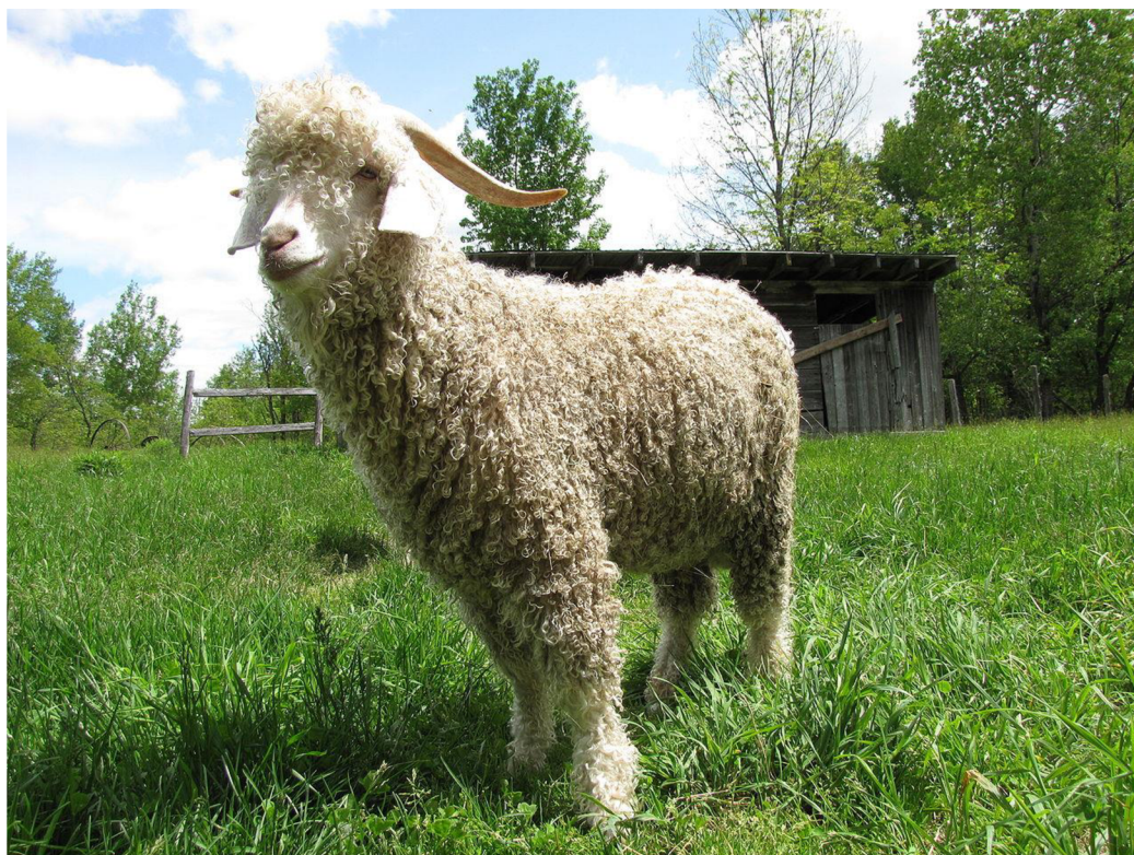
Obr. 4 Koza angorská, neupraveno.