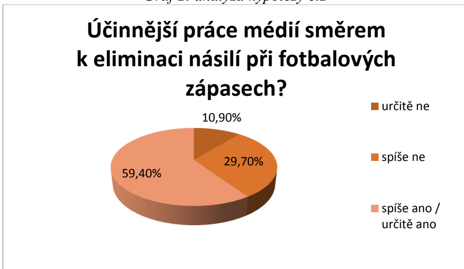
Graf 2: analýza hypotézy č.2