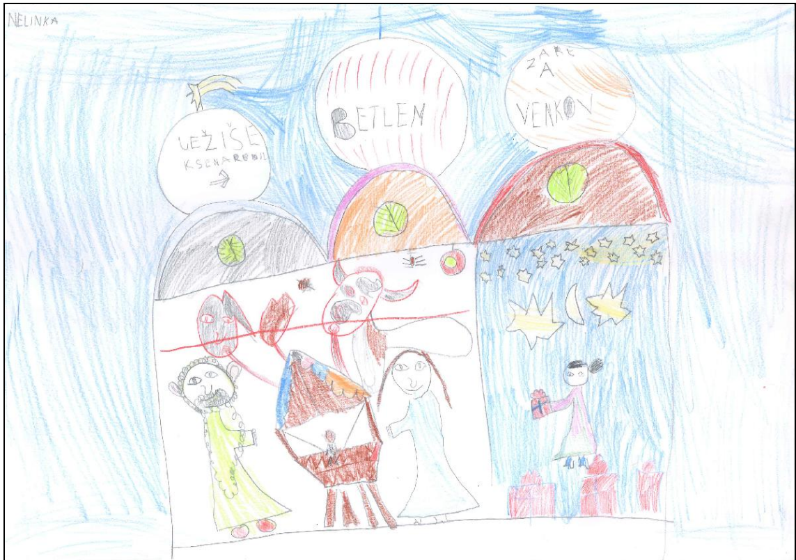
Obrázek č. 11 – Nelinka 6 let