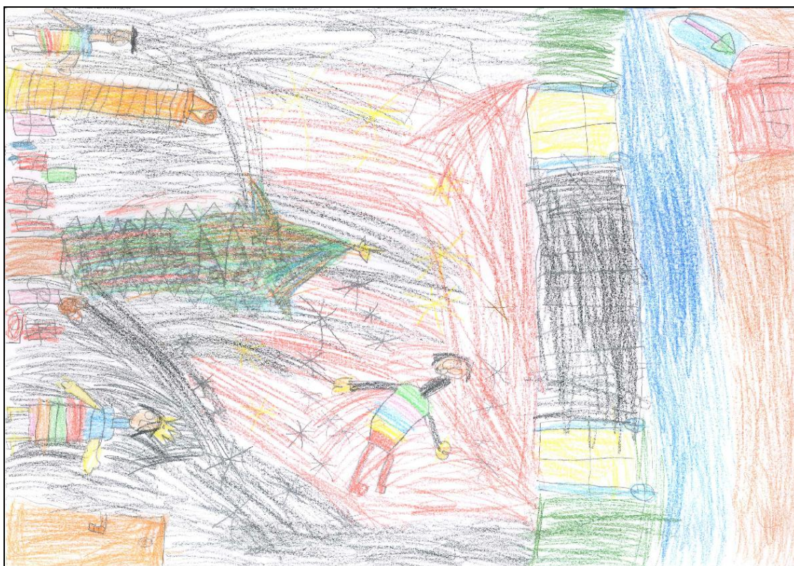
Obrázek č. 2 – Filip 6 let