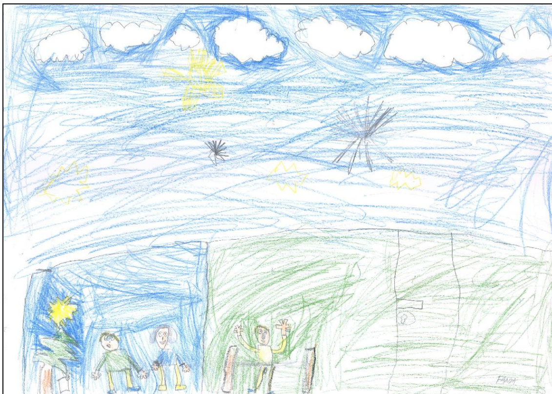
Obrázek č. 1 – Fanda 5 let