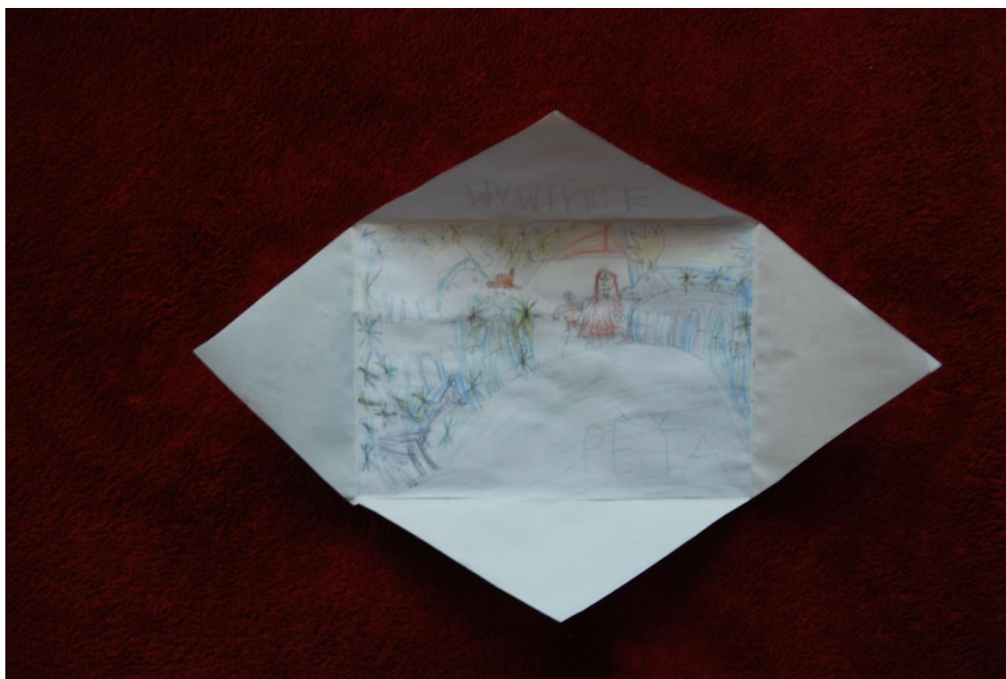
Obrázek č. 16 – foto – betlém ve hvězdičce otevřený