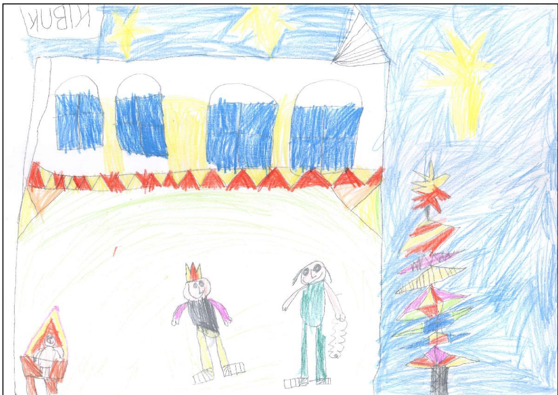
Obrázek č. 15 – Kubík 5 let