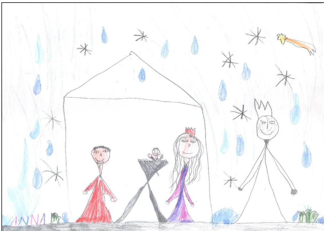
Obrázek č. 10 – Anička 5 let