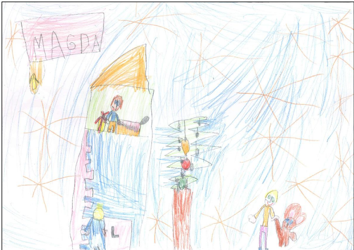
Obrázek č. 6 – Magda 5 let