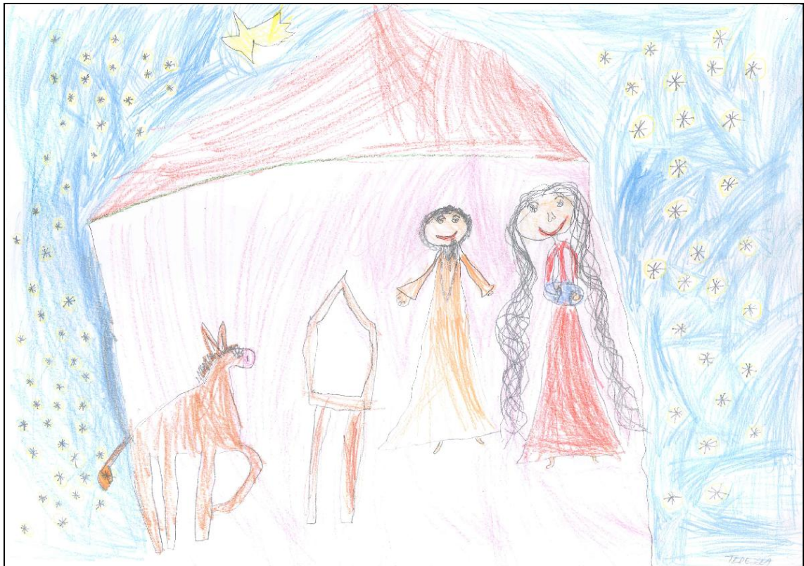
Obrázek č. 3 – Tereza 5 let