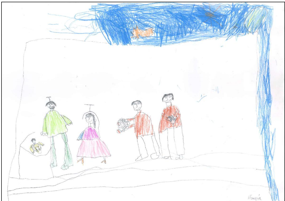
Obrázek č. 4 – Honzík 5 let