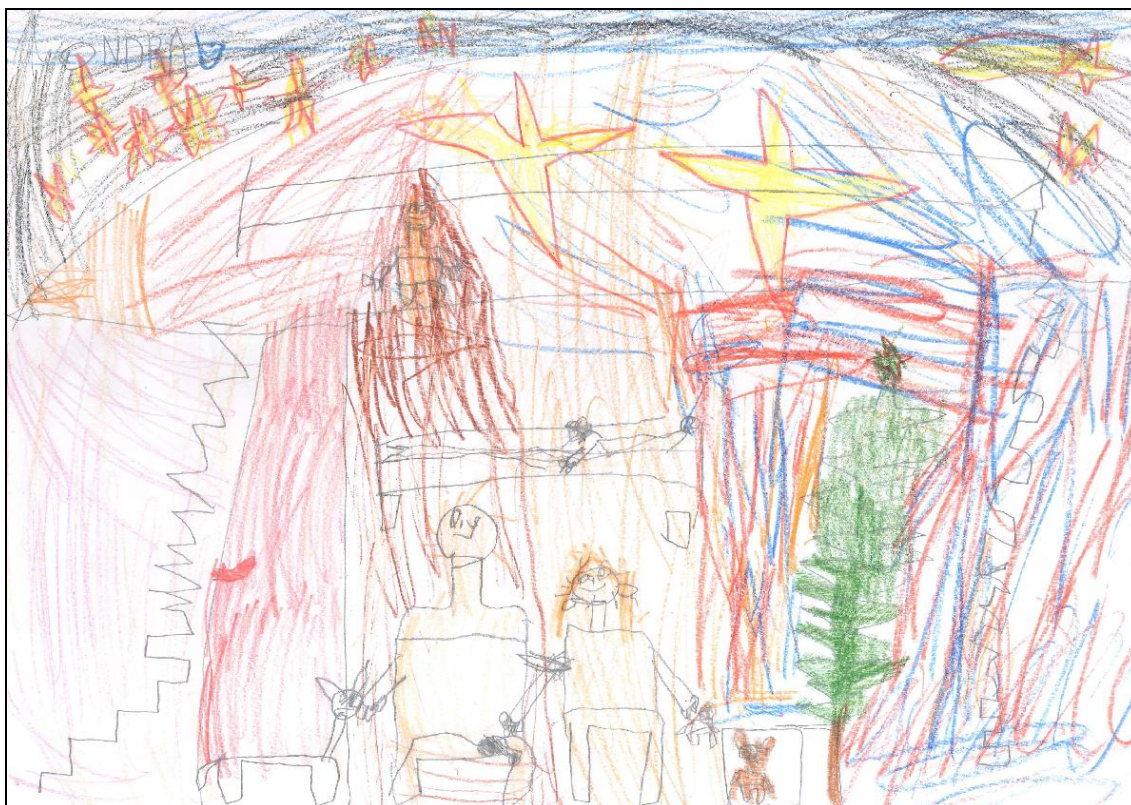
Obrázek č. 9 – Odra 6 let