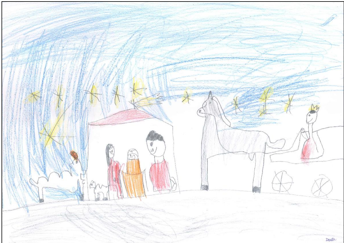
Obrázek č. 5 – Daník 6 let