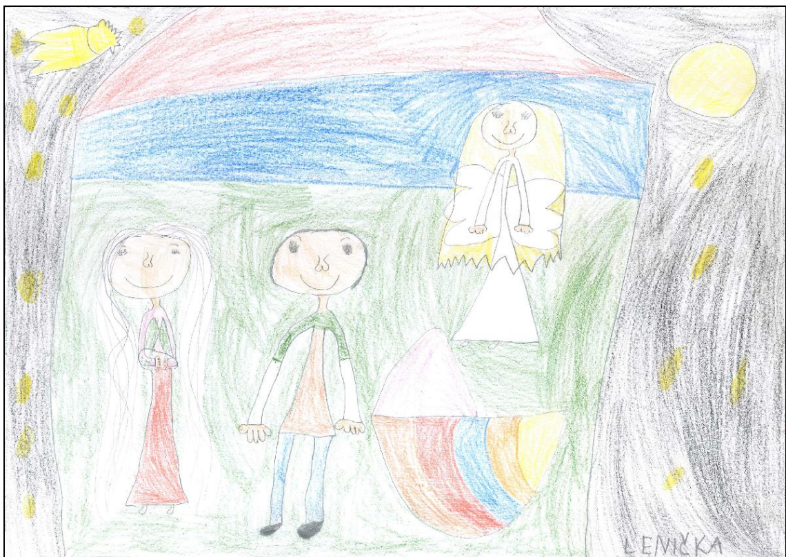
Obrázek č. 8 – Lenička 6 let