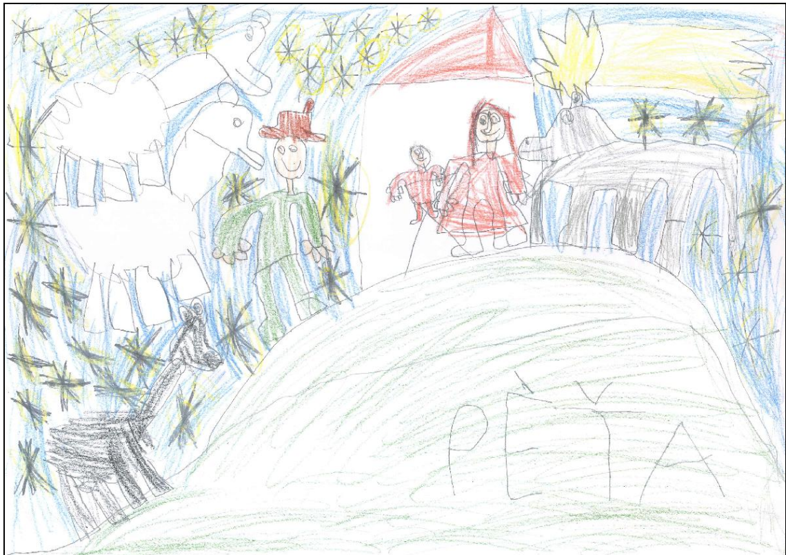
Obrázek č. 13 – Pěťa 6 let