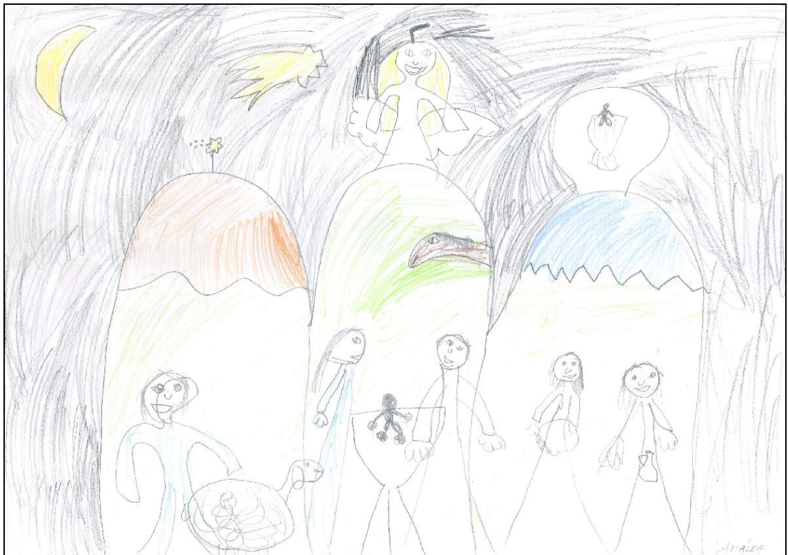
Obrázek č. 12 – Amálka 6 let