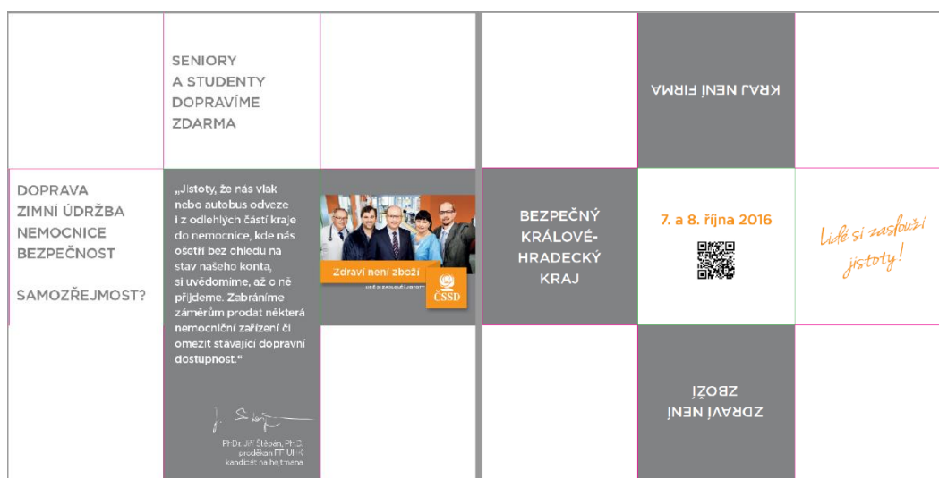
FINÁLNÍ VERZE PROPAGAČNÍHO MATERIÁLU

Barevnost se řídila grafickým manuálem, kde byly barvy stanoveny v CMYK soustavě. Šedá a bílá se opět uplatnily na pozadí jako „nebarvy“, které nechají vyniknout ostatním sdělením.