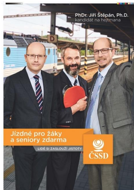
VOLEBNÍ PLAKÁT ČSSD Z R. 2016

Slovo fotografie pochází z řeckých slov: φῶτος (fōtos) - světlo a γραφή (grafé) - zobrazení pomocí čar neboli kreslení. Dohromady tedy tato slova znamenají kreslení světlem.