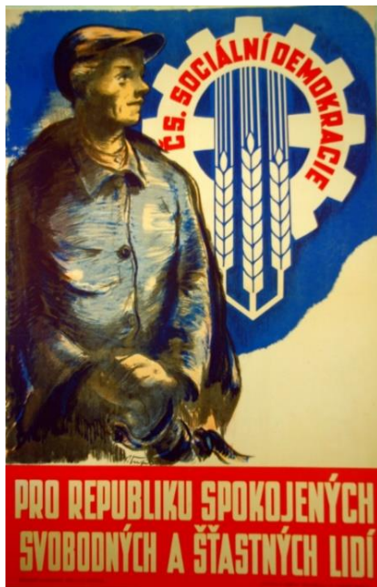
VOLEBNÍ PLAKÁT ČS. SOCIÁLNÍ DEMOKRACIE Z R. 1946

Zatímco ještě počátkem 50. a 60. se na plakátech a volebních letáčích (v té době spíše agitkách) používala především kresba a malba, v dnešní době se setkáváme téměř výlučně s fotografií. S malbou či kresbou se setkáme spíše u plakátů upozorňující na uměleckou událost. Na příkladu plakátů 1946 11 a 2016 12 , je patrné, že sociální demokracie je konzistentní ve svých myšlenkách, pracuje s podobnými metaforami, ale posunula se vzhledem k technologiím ke způsobu zpracování materiálů.