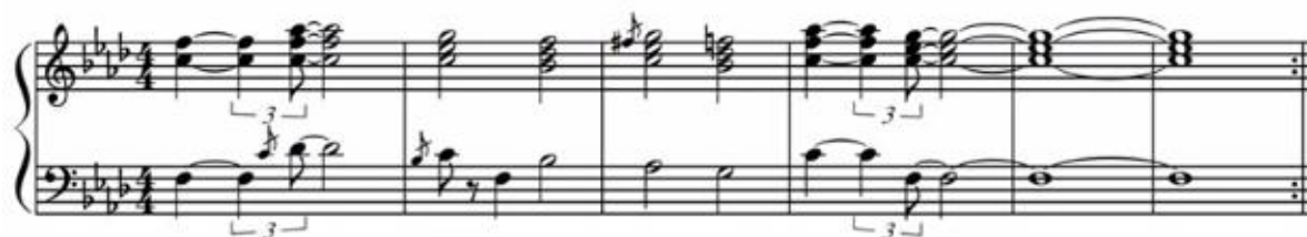
Obrázek 2: Ukázka samplu ze skladby Stakes Is High. 128

Sample výjmul J Dilla ze skladby Swahililand, pocházející z alba Jamal Plays Jamal . Toto album z roku 1974 se poněkud liší od alba The Awakening . Zde vsadil Ahmad Jamal na lehké experimentování s nástroji. Album má vážnější výraz a piano zde už nemá tu hlavní roli. To je také jeden z důvodů, proč si skladby z tohoto alba vybírali hip hopoví producenti jen zřídka. J Dilla vysamploval téměř závěrečnou, výraznou pasáž piana spolu s žestěmi a tuto smyčku doplnil o jeho typické a na první poslech rozeznatelné bicí. Dalším samplem ve skladbě Stakes Is High je sample ze skladby Mind Power od James Browna. Zde se jedná o samplování mluveného slova „Vibe“. 127 Níže je doplněna ukázka základního samplu.