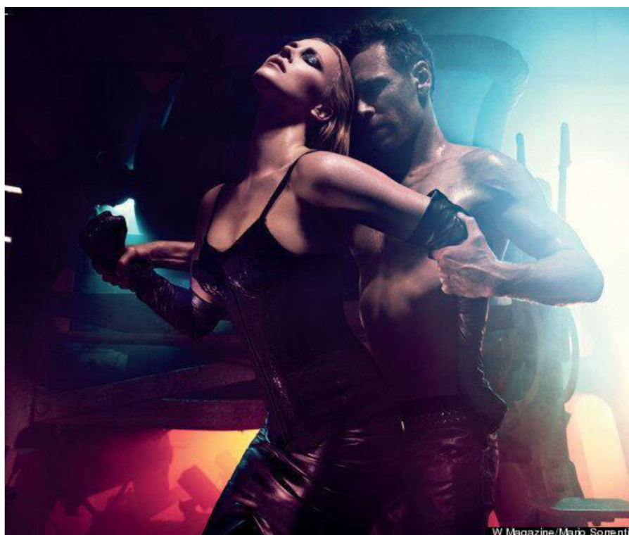
Obr. 10. Mario Sorrenti, Smash of the titans