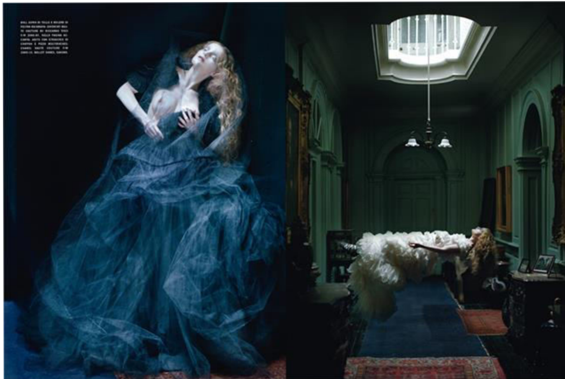
Obr. 11. Tim Walker, Dreaming of another world

Dostupné z: https://www.vogue.it/en/magazine/vogue-supplements/2011/03/dreaming-of-another-world