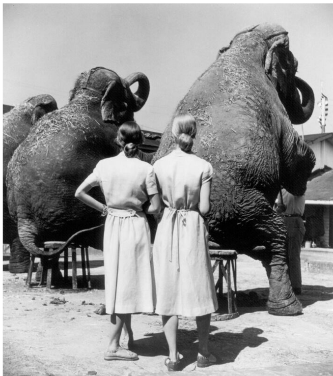
Obr. 1. Louise Dahl-Wolfe, Twins with Elephants

Dostupné z: https://www.artsy.net/artwork/louise-dahl-wolfe-twins-with-elephants-sarasota