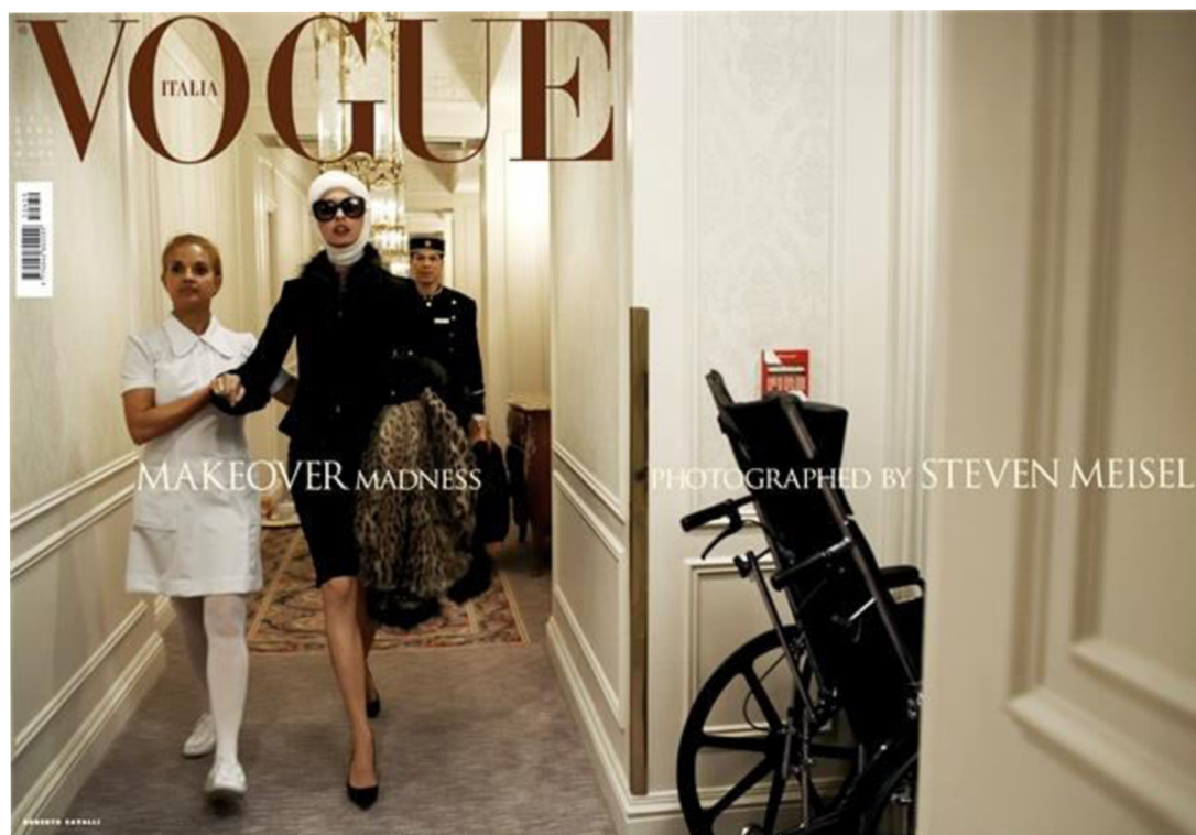
Obr. 12. Steven Meisel, Makeover Madness

Dostupné z: https://www.vogue.it/en/magazine/vogue-supplements/2011/03/dreaming-of-another-world