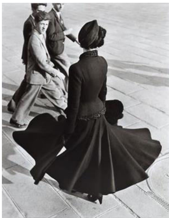
Obr. 5. Richard Avedon, Renée, The New Look of Dior, Place de la Concorde, 1947