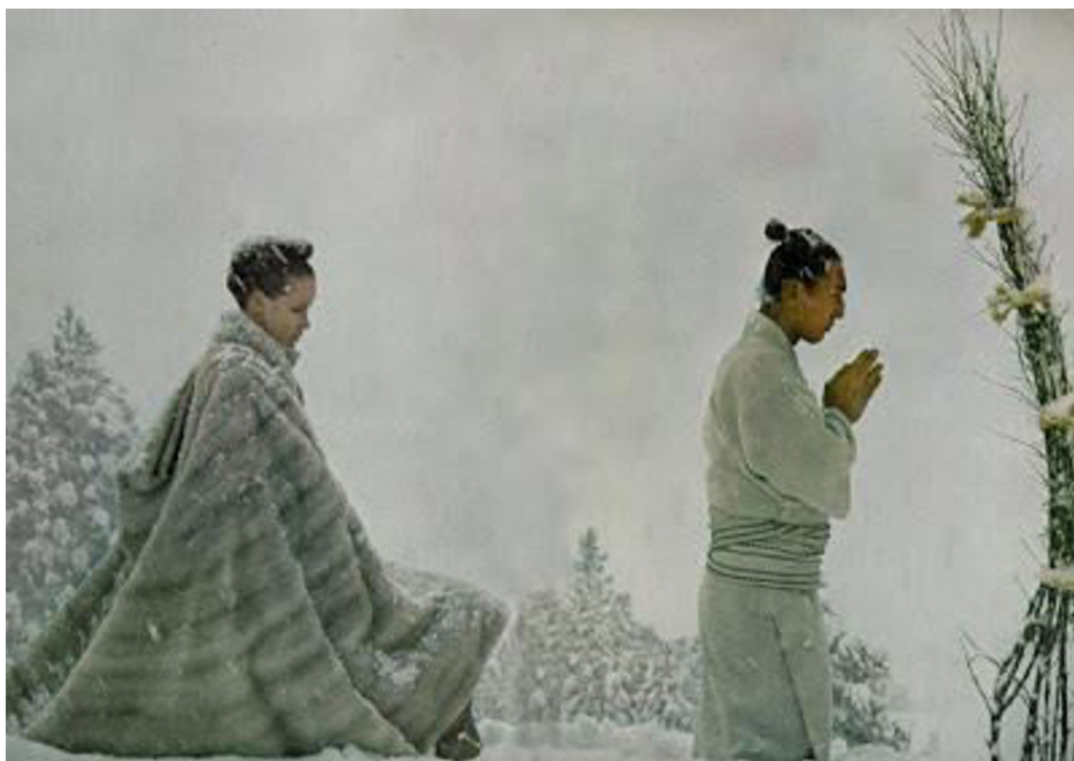
Obr. 2. Richard Avedon, The great fur caravan , 1966

Dostupné z: https://www.artsy.net/artwork/louise-dahl-wolfe-twins-with-elephants-sarasota