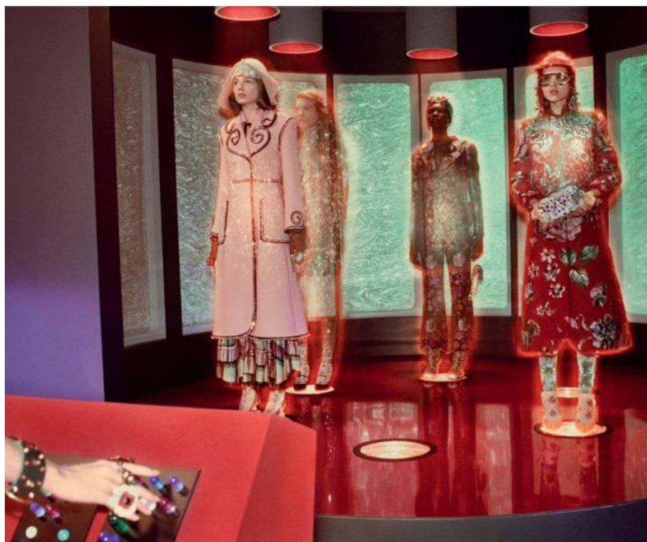
Obr. 9. Glen Luchford, Gucci Podzim/Zima 2017/2018