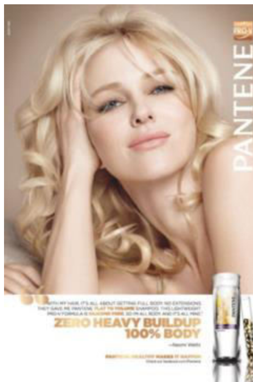
Obr. 4. Jimmy Choo reklama vs. Reklama na šampón Pantene

Dostupné z: https://fashionphantasmagoria.wordpress.com/2016/10/03/the-fiction-in-fashion-narrative-in-fashion-advertising/