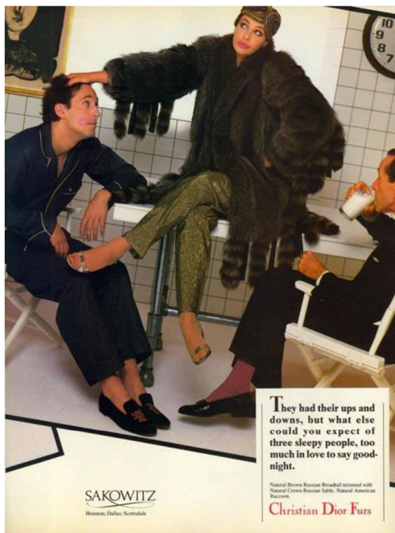
Obr. 2. Richard Avedon, The Diors , Fall-Winter Dior's campaign, text: Doon Arbus, 1982