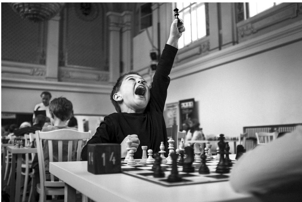
Obr. 3 Jedna z vítězných fotografií Michaela Hankeho ze série Šachové turnaje mládeže z roku 2017, (zdroj: https://ct24.ceskatelevize.cz/kultura/2049032-hanke-aneb-foti-cela-rodina-vystava-nabizi-snimky-z-world-press-photo )