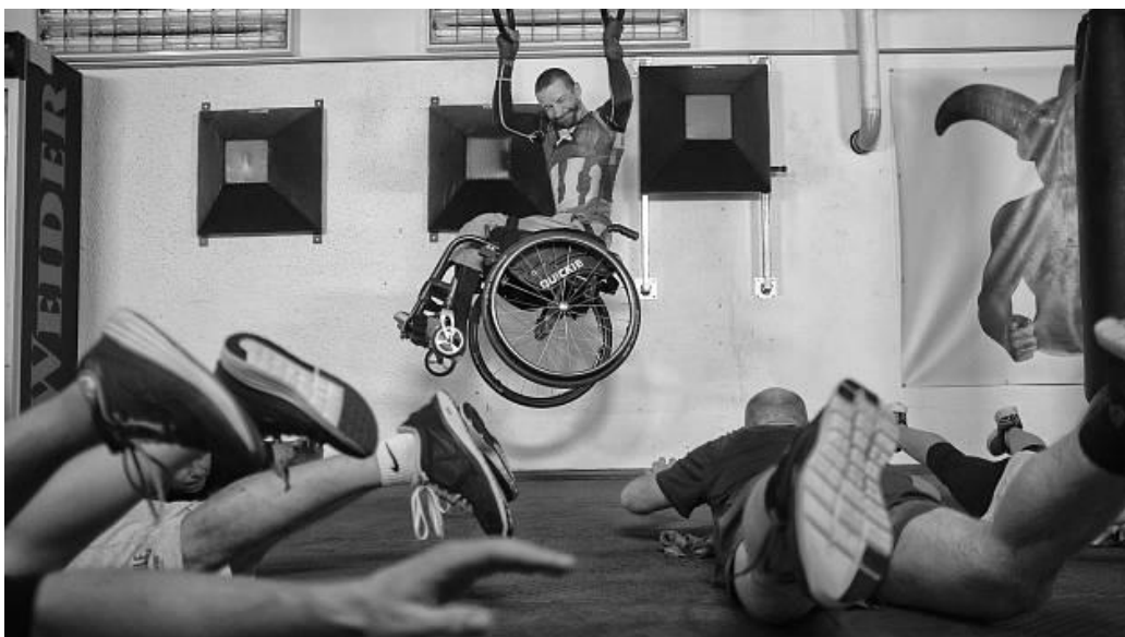
Obr. 4 Jedna z vítězných fotografií Michaela Hankeho ze série Nikdy ho neviděli brečet z roku 2019