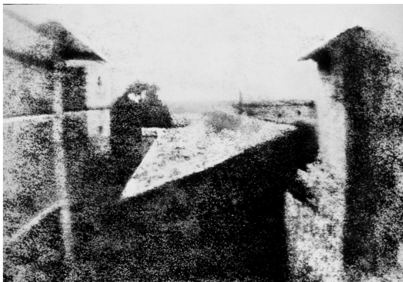
Obr. 2 Historicky první dochovaná fotografie – Podhled z okna