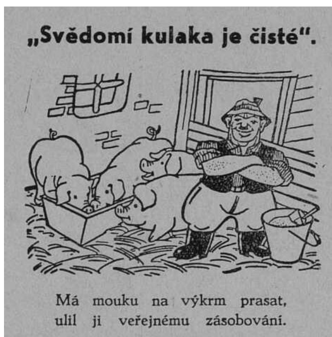
Obrázek č. 15