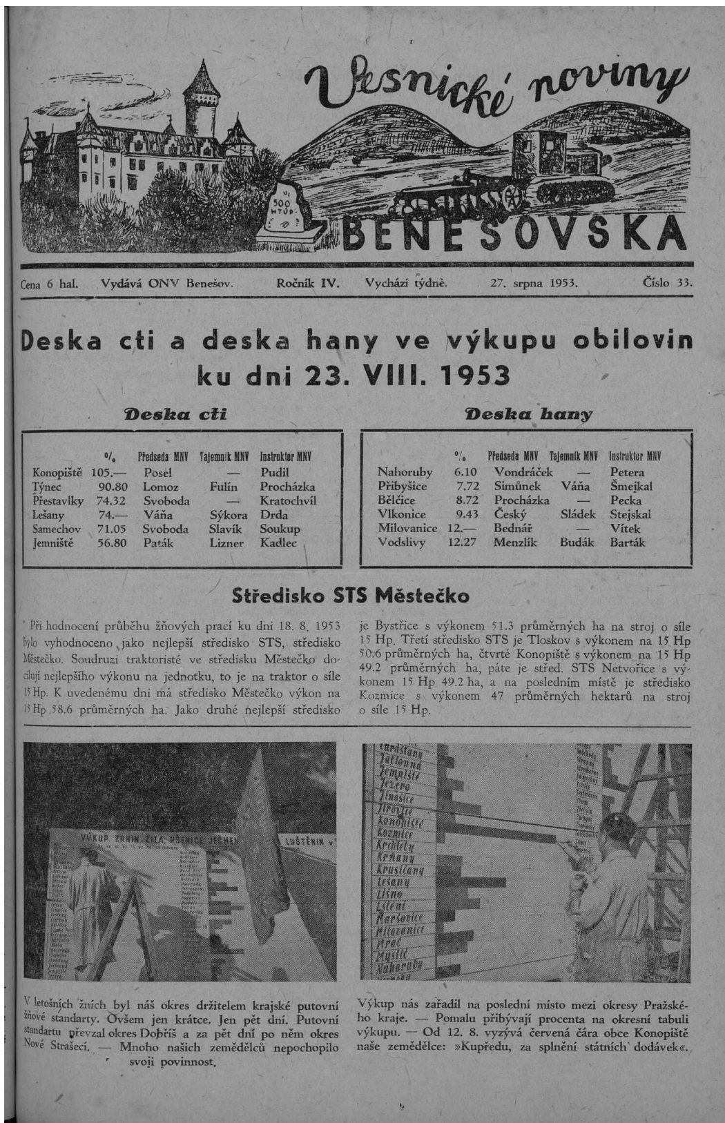
Obrázek č. 11