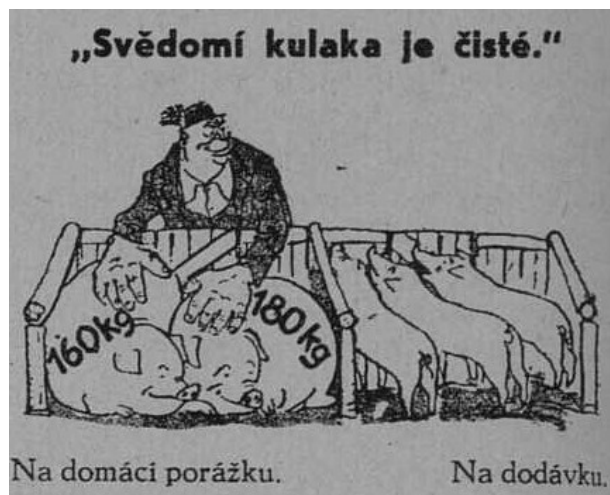
Obrázek č. 14