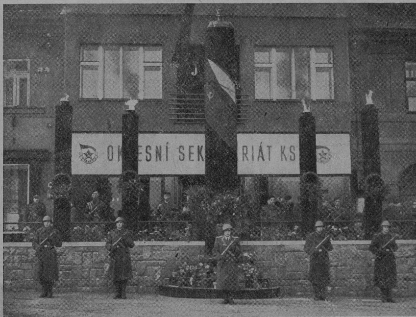
Dne 9. 3. 1953 před budovou OV KSČ v Benešově.