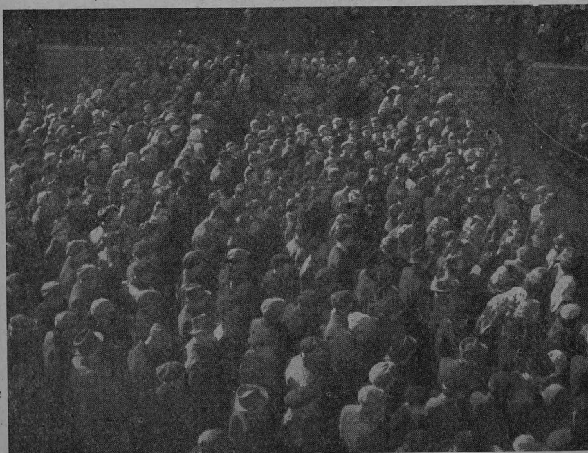
Občané v den pohřbu s. J. V. Stalina na náměstí v Benešově.