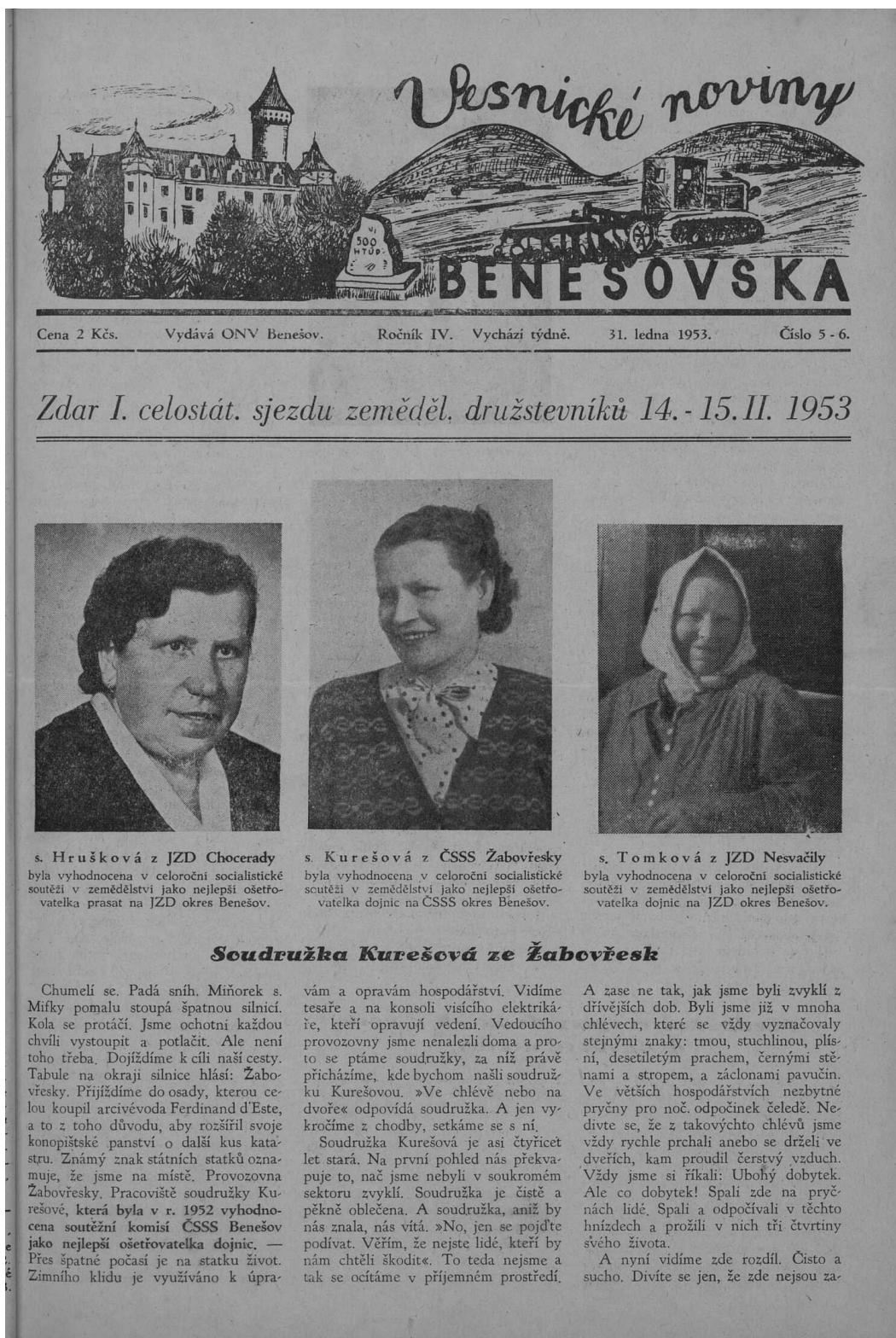
Obrázek č. 5 (zdroj: Vesnické noviny Benešovska 31. 3. 1953)