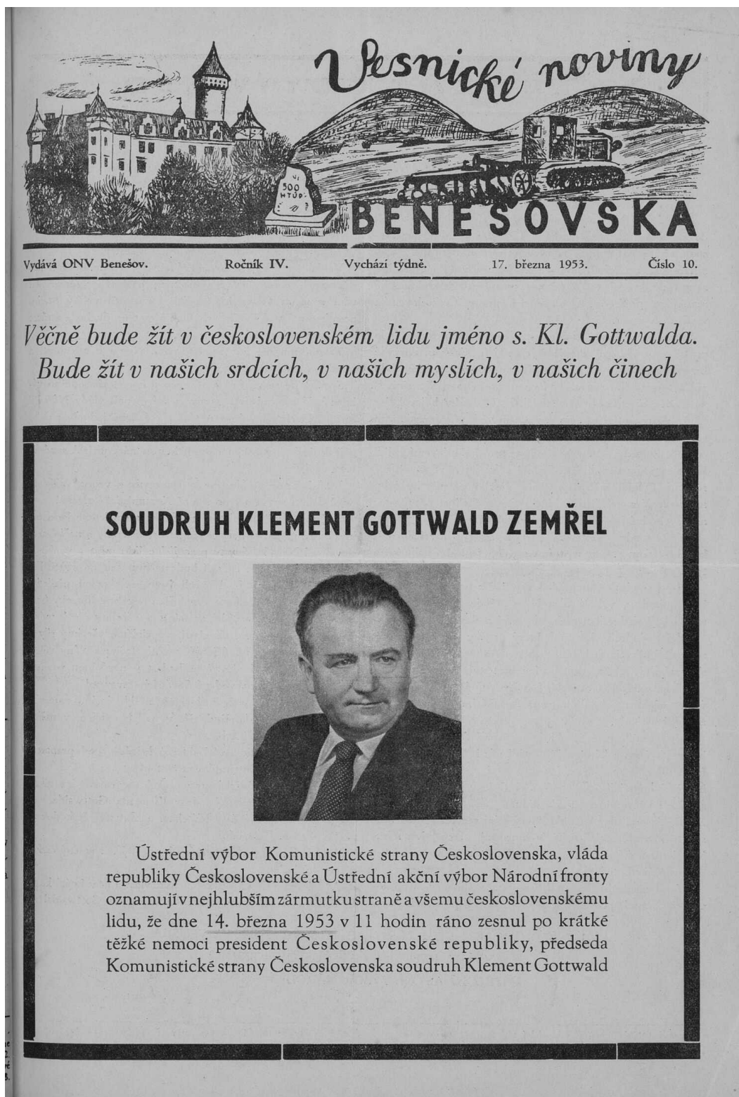
Obrázek č. 6