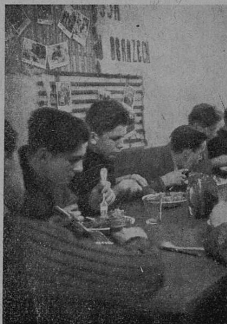
Obrázek č. 16 (zdroj: Vesnické noviny Benešovska 14. 6. 1952)