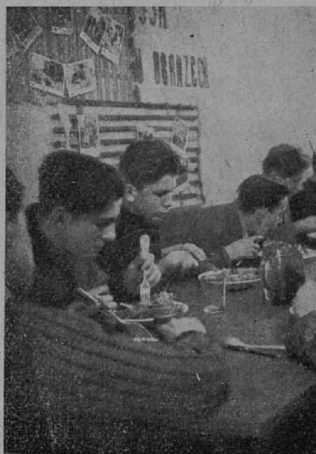
Obrázek č. 16