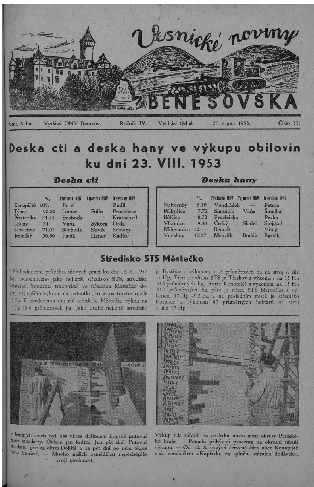
Obrázek č. 11