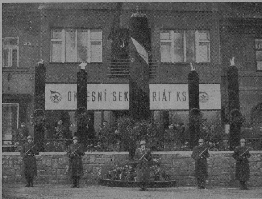
Dne 9. 3. 1953 před budovou OV KSČ v Benešově.