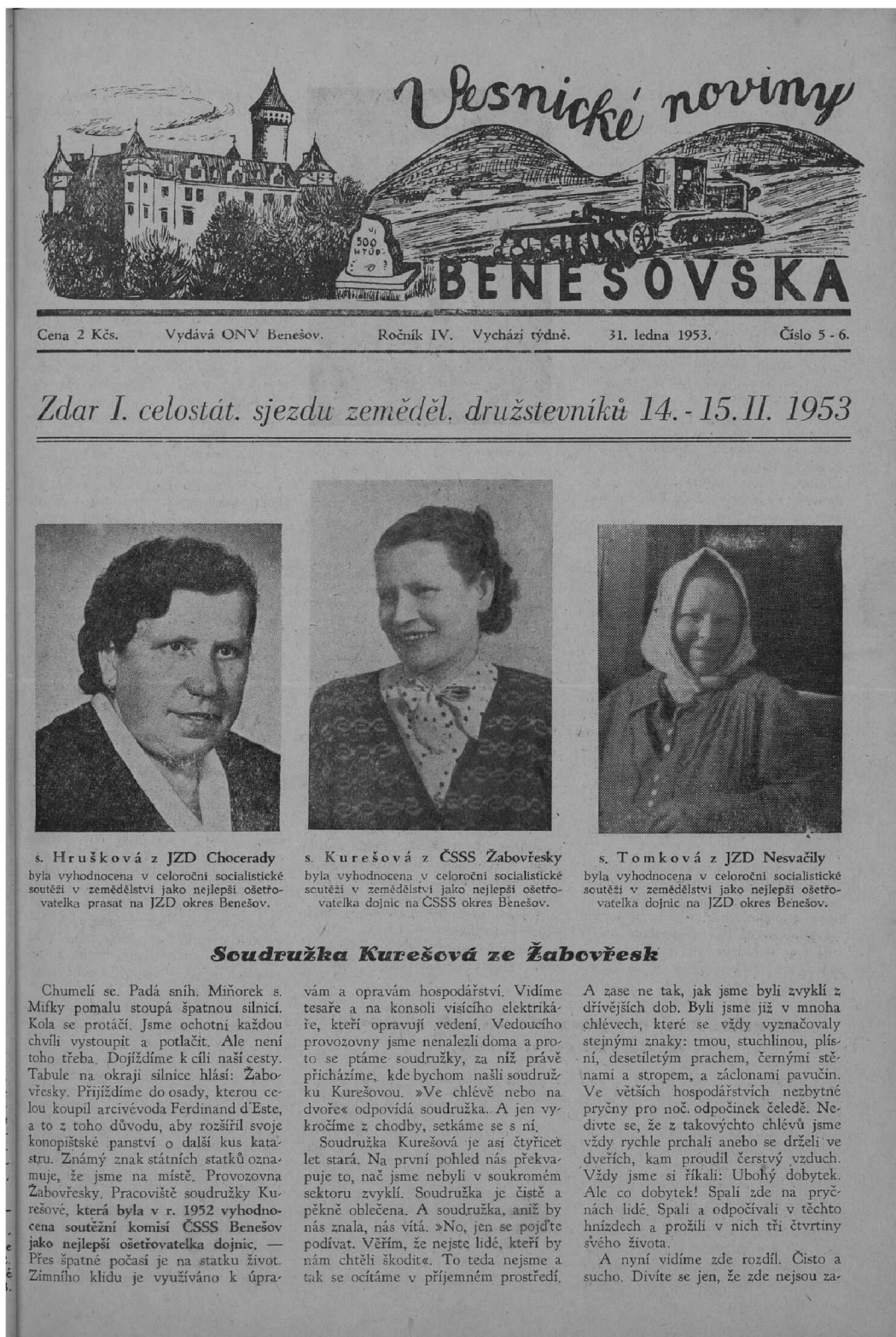
Obrázek č. 5 (zdroj: Vesnické noviny Benešovska 31. 3. 1953)