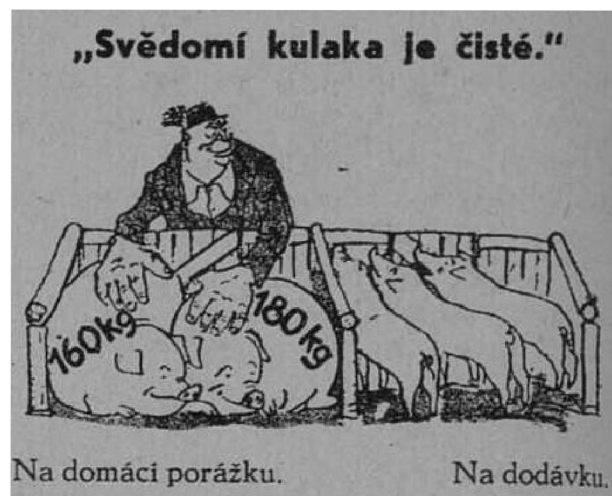
Obrázek č. 14