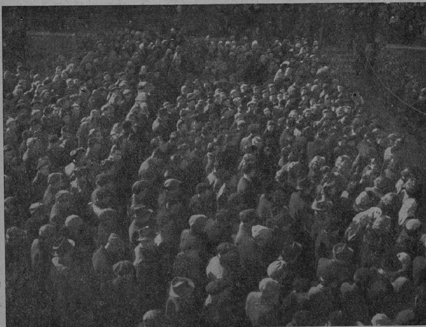
Občané v den pohřbu s. J. V. Stalina na náměstí v Benešově.