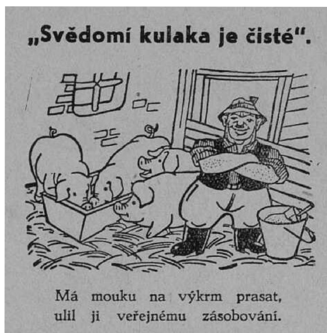
Obrázek č. 15