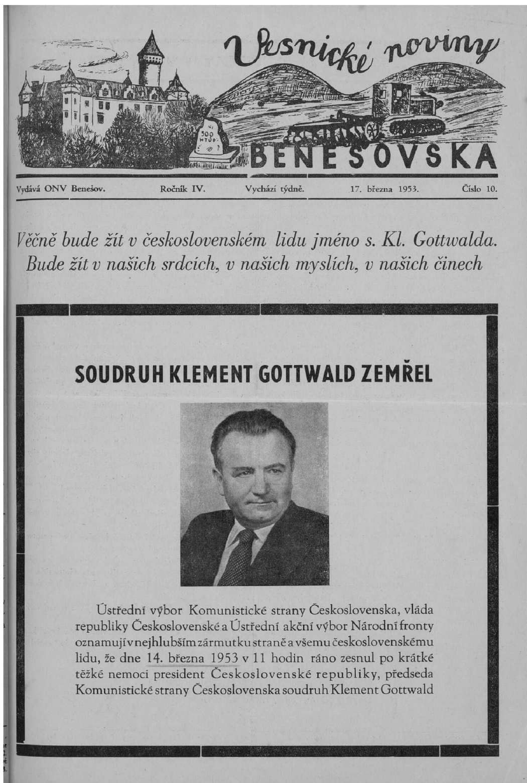
Obrázek č. 6