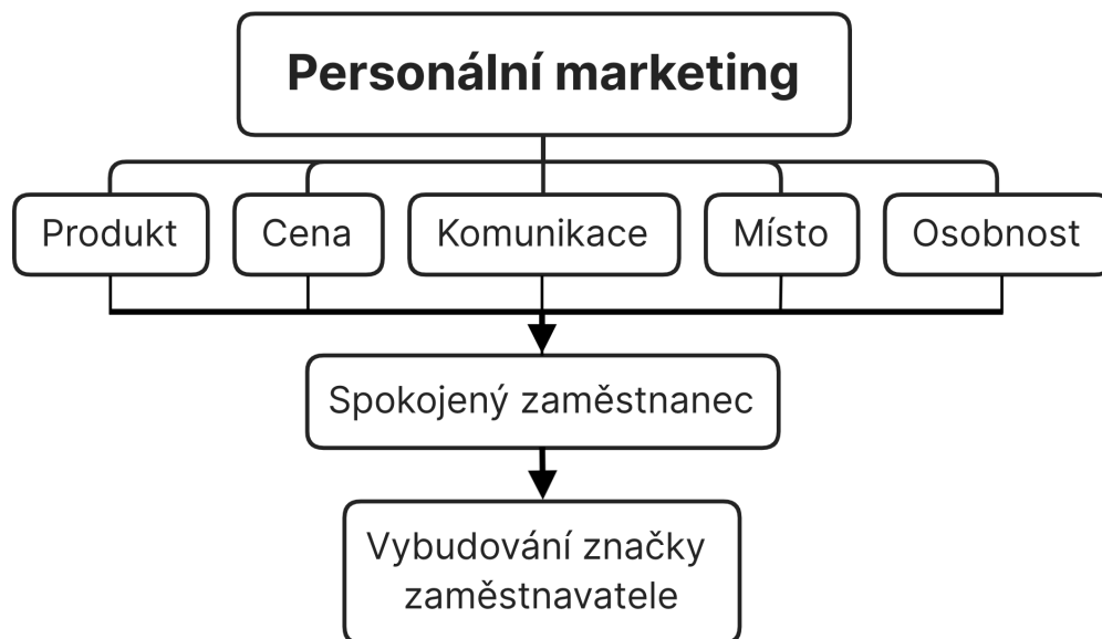
Obrázek 1: Implementování strategií personálního marketingu