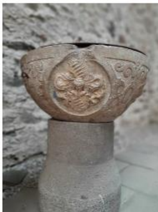
Původní křtílnice s erbem Mauschwitzů.

Předchůdcem dnešního kostela byl malý dřevěný kostelík na místě dnešní hřbitovní kaple. První zmínka o dřevěném kostelíku je z roku 1591. Kolem kostelíka postupně vznikal hřbitov, který je na stejném místě dodnes. Roku 1603 věnoval Christoph Mauschwitz kostelu kamennou křtílnici, která je ozdobena jeho erbem (zelená jezerní růže ve stříbrném poli). Křtílnice je v dnešní době umístěna v kostele. Počátkem 17. století se kostelík přeměnil v evangelickou modlitebnu.