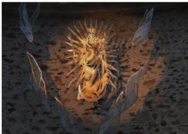
Nynější Bärwaldská madona.