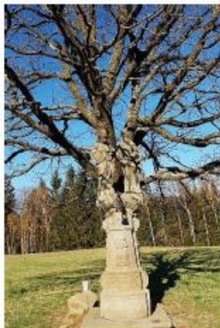
Socha Petra a Pavla.

Specifikem Bärnwaldu (Neratova) bylo i vlastní nářečí. Do jejich běžného jazyka se dostávaly i české výrazy. Příkladem mohou být slova trám a chalupa. Trám, německy Balke, byl v neratovském nářečí „trom“. Chalupa zase „chaluppen“. Typickým rozloučením bylo: „...ei Goots Noama!“, což v překladu znamenalo: „Jděte ve jménu božím.“ Až do roku 1945 byl styk s českou řečí pouze na úřadech. Odvedenci do války se učili základy češtiny v armádě. Děti jezdily na výměnné pobyty do českých rodin, dostaly tak šanci naučit se druhý jazyk.