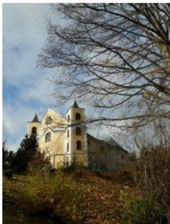
Podoba kostela s provizorním zastřešením věží (2017).