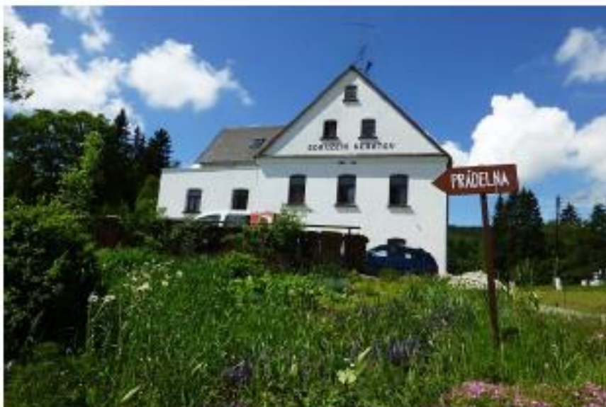
Budova Sdružení Neratov, ve které dříve fungovala bárnwaldská škola.