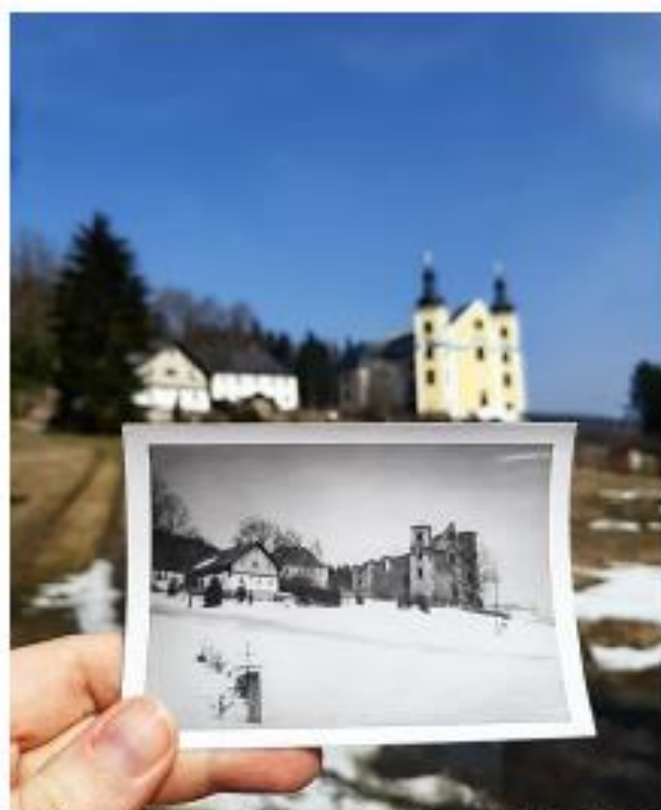
Porovnání podoby kostela – 70. léta 20. století a rok 2021.