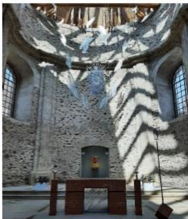
Zazděné dveře za oltářem.