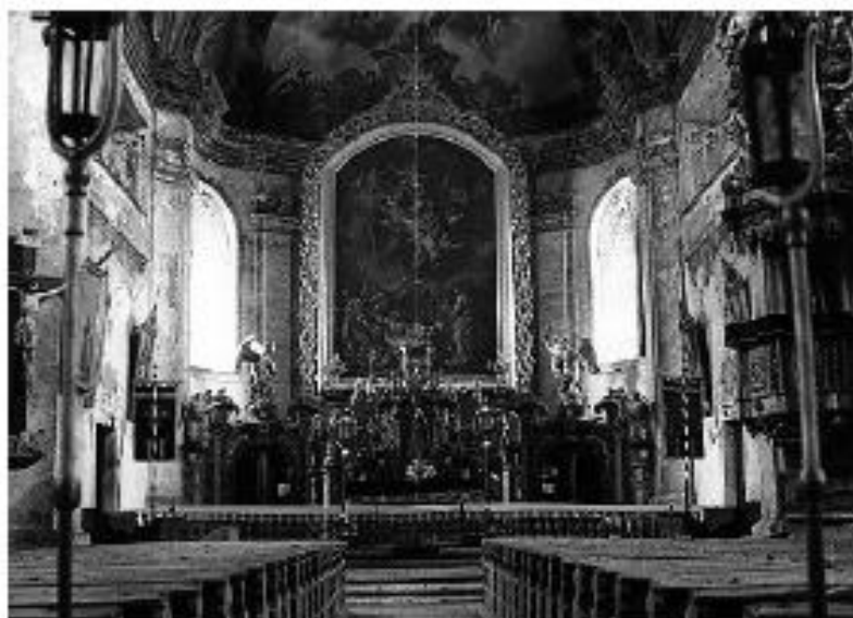
Původní barokní interiér kostela.