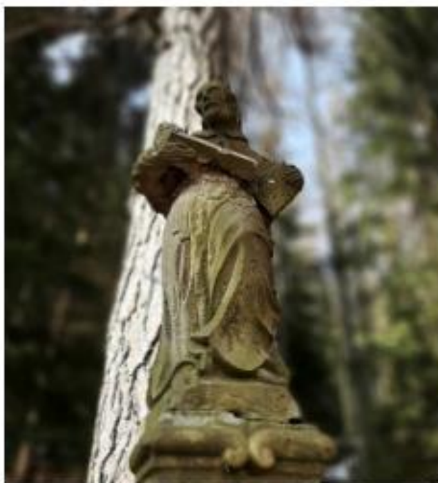
Socha sv. Františka Xaverského u památných modřinů.

Jelikož byl Bärnwald (Neratov) silně věřící vsí není divu, že se ve vesnici i v lesích nachází několik soch s křesťanskou tematikou. V lesích se nachází i linie lehkého a těžkého opevnění, které bylo budováno na obranu před nacistickou okupací. Neratov se pyšní přírodní rezervací Neratovské louky a několika památnými stromy – dvěma javory kleny a třemi modřiny.