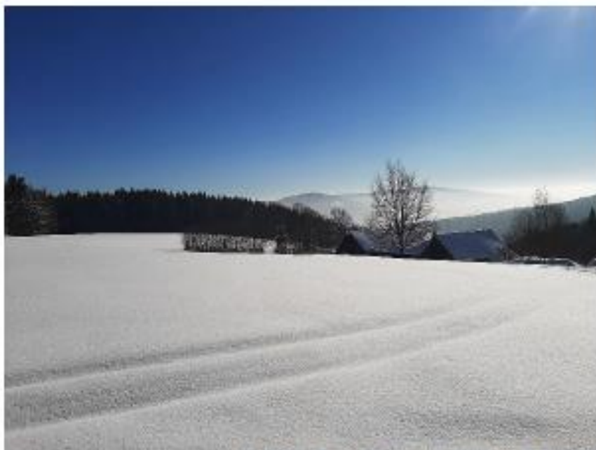
Výhled na Bukovohorskou hornatinu a Suchý vrch.

Do Neratova začali jezdit Češi na rekreační pobyty. Pobyty v chalupách jim nabízely podniky, ve kterých pracovali. Do roku 1949 se nedostatek obyvatel řešil tím, že se nechalo spoustu domů zbourat. Několik domů bylo zachráněno tím, že si je dosídlenci koupili. Jelikož v Neratově i okolních vesnicích nebyli téměř žádní stálí obyvatelé, pouze chalupáři, byly všechny vesnice od Trčkova po Bartošovice roku 1960 spojeny do dvou obcí – Orlické Záhoří a Bartošovice v Orlických horách.