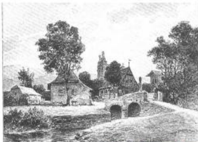
Stará rytina, původní Jánský most.