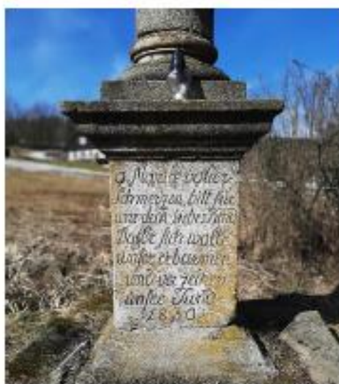
Sloup s modlitbou k Panně Marii na rozcestí.