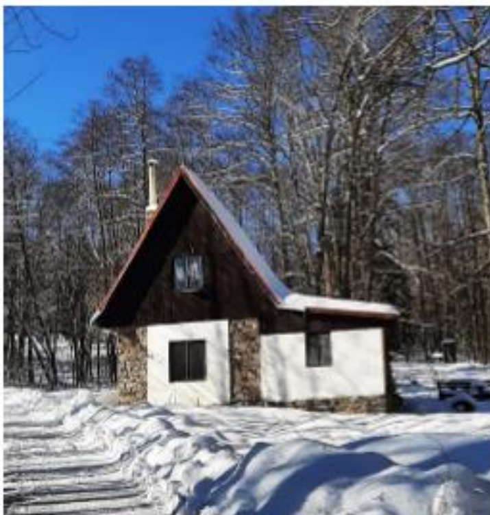
Vrchní nářadovna hasičů.

Bärwald (Neratov) měl i svůj hasičský sbor. Měl 20 až 30 členů. Ve vsi byla nářadovna a vrchní a spodní úložiště stříkačky.