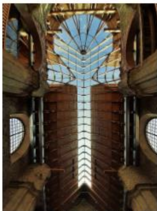
Prosklená střecha ve tvaru kříže.