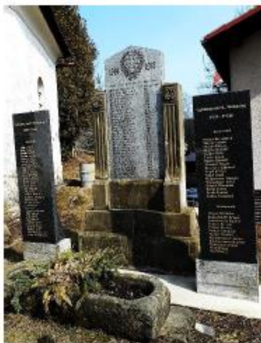
Náhrobky padlých za první a druhé světové války.

Obě světové války významně ovlivnily život v obci. Během první světové války padlo 31 mužů. Při rozdělování území po první světové válce území zůstalo součástí Československa, přestože zde žili německy mluvící obyvatelé. Jednalo se ale o konzervativní obyvatelstvo, které zůstalo věrné žamberskému hejtmanství a neúčastnilo se aktivit provincie Sudety. České vojsko si pohraničí pojistilo obsazením a starostové museli přísahat věnost Československé republice.