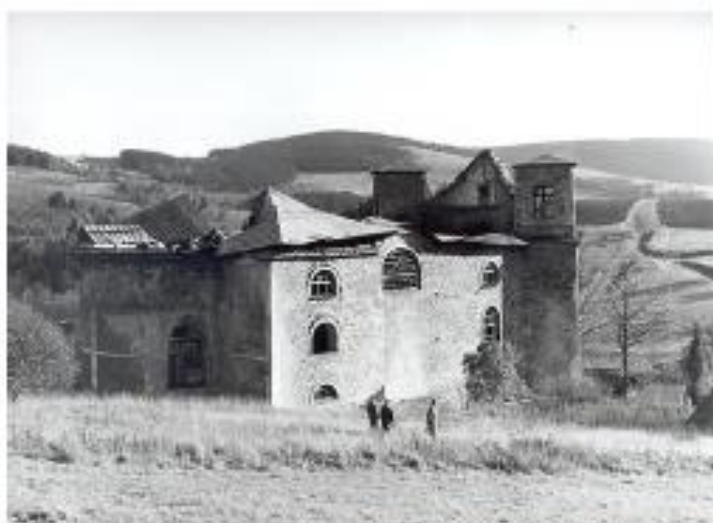
Stav kostela v 60. letech 20. století.

Roku 1950 se již mluvilo o zboření kostela, protože je prý velmi zanedbán. Nedokončená střecha, která nebyla chráněna od vody byla zcela promočená a roku 1957 se zřítla. Jelikož během komunistické moci byla církev v nemilosti, církevním památkám se nevěnovala téměř žádná pozornost. Koncem šedesátých let se probudila naděje, že kostel bude zachráněn. Byl podán návrh na zápis do seznamu státem chráněných památek, což se nevydařilo. Z politických důvodů pak bylo vydáno povolení ke zbourání kostela. Jelikož bylo rokokové schodiště pod ochranou památkové péče, muselo se přemístit. Díky tomu, že se schodiště přemísťovalo, nezbyly peníze na demolici. To kostel zachránilo.