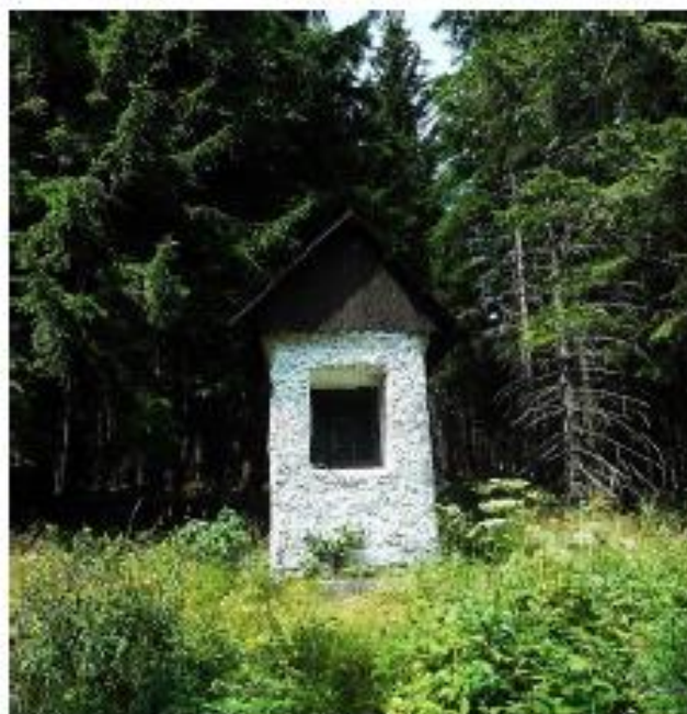
Kampelička sv. Huberta na Vysokém Kořenu.

Neratovský kopec Vysoký Kořen byl v historii hlavní spojující cestou mezi Neratovem a vnitrozemím. Nyní je na kopci vyhlídka s posezením, odkud je výhled na údolí Divoké Orlice, Bukovohorskou homatinu se Suchým vrchem. Na Vysokém Kořenu je i kampelička sv. Huberta, patrona myslivců. Přes Vysoký Kořen se dá dojit na Anenský vrch s Anenskou rozhlednou a dál cesta pokračuje k pevnosti Hanička.