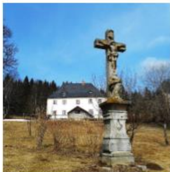
Mohauptův kříž před farou.