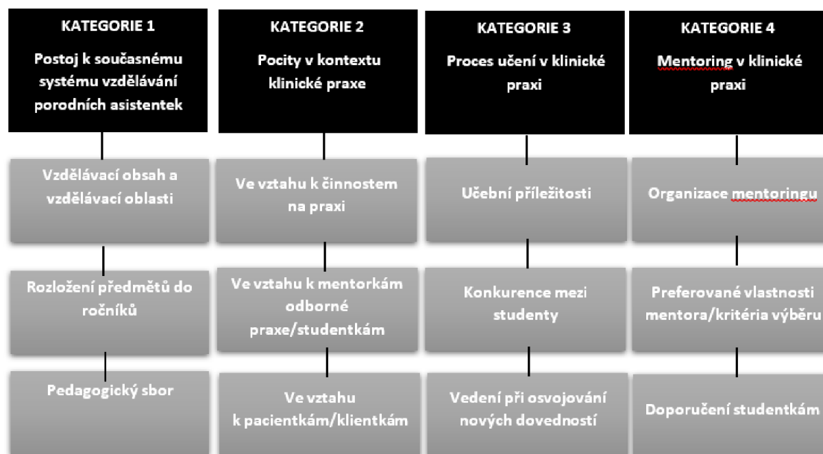
Obrázek 1. Kategorie a podkategorie výsledků