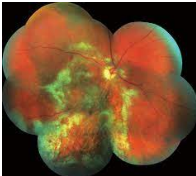
Obrázek 6 CMV retinitida[62]

Před vypuknutím epidemie AIDS byl cytomegalovirus neboli CMV vzácný a postihoval nejčastěji pacienty po transplantaci orgánů. Cytomegalová retinitida je nejčastější oční oportunní infekce a postihuje 30–40 % infikovaných HIV. CMV retinitida má tři klinické formy. První forma se projevuje vznikem lézí retinální nekrózy s krvácením v zadním pólu oka. Léze se postupně zvětšují, až splynou, což může nakonec vést k nekróze sítnice a atrofii pigmentového epitelu. Postižený popisuje ztrátu zorného pole nebo zhoršené vidění. Druhá forma je charakterizována vznikem granulárních periferních retinálních lézí zcela bez nebo s mírným krvácením. Při třetí formě dochází k zánětu cév. V důsledku postižení makuly a optického nervu z důvodu odchlípení sítnice může dojít k oslepnutí. K léčbě se využívají léky, jako je orální nebo intravenózní ganciklovir, ganciklovirový implantát nebo valganciklovir. [59, 60, 61]