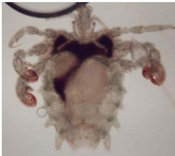
Obrázek 7 Veš muňka [77]

Phthirus pubis neboli veš muňka je lidský parazit, který se přenáší blízkým kontaktem při pohlavním styku nebo z rodiče na dítě, může se šířit i pomocí infikovaného oblečení, ručníků a ložního prádla, kde mohou být nakladena vajíčka. Bez lidského organismu nepřežije veš déle než 24-48 hodin, jelikož se živí krví hostitele až pětkrát denně. Dospělí jedinci phthirus pubis dorůstají do velikosti 1,5-2 mm, tvar jejich těla je podobný krabovi a na konci druhého a třetího páru nohou mají drápy, díky kterým mohou pevně přilnout k ochlupení blízko kůže. Samice jsou větší než samci a kladou denně okolo tří hnid, které se vylíhnou za 7-10 dní. Vyskytují se především v pubickém ochlupení, ale mohou se rozšířit i na hrudník, stehna, vousy, obočí, řasy nebo do podpaží. [9, 76]