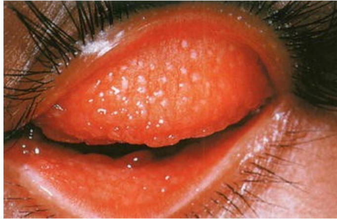
Obrázek 5 Trachom [45]

trachomu závisí především na anamnéze a klinických příznacích, které jsou patrné při vyšetření štěrbinovou lampou, stěru ze spojivky, PCR a barvením spojivkových buněk podle Gimse. [14, 44]