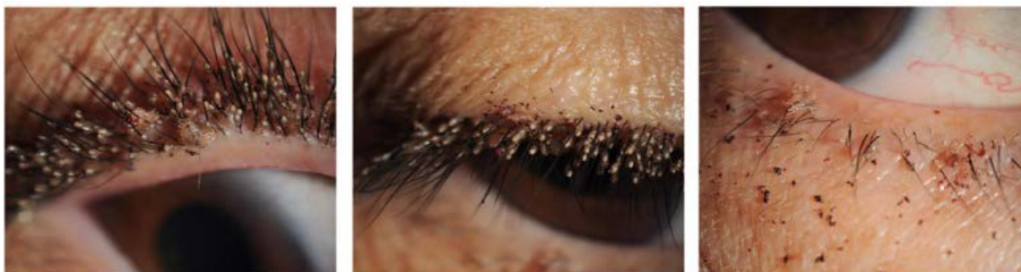
Obrázek 8 Veš muňka na oku [82]