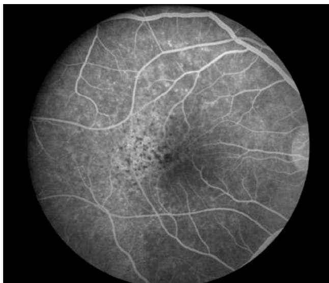
Obrázek 1 Zánět pigmentového epitelu sítnice u zadní uveitidy oční syfilis [22]