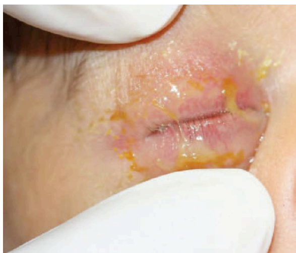
Obrázek 4 Novorozenecká gonokoková konjunktivitida [39]

Ophthalmoblenorrhoea neonatorum je novorozenecká gonokoková konjunktivitida, která může vzniknout uterinní infekcí nebo infikováním během porodu. Riziko přenosu při porodu z infikované matky na dítě je poměrně vysoké a to okolo 30 až 50 % a stoupá při předčasném roztrhnutí plodového vaku nebo při předčasném porodu. U dětí narozených předčasně se konjunktivitida projevuje několik hodin po porodu a u dětí narozených v termínu se první příznaky projeví zhruba po pěti dnech. Nemoc vzniká na obou očích a způsobuje otok víček, otok a zduření spojivky a hnisavou sekreci. Oči jsou velmi bolestivé na dotek. Bez léčby nemoc postihuje rohovku, může dojít ke vzniku zeleného zákalu a v nejhorším případě až k oslepnutí. Jako ochranu před nemocí se doporučuje novorozencům takzvaná kredeizace, kdy se kapou antiseptické oční kapky do spojivkového vaku, nejpozději 2 hodiny po porodu. [9, 16]