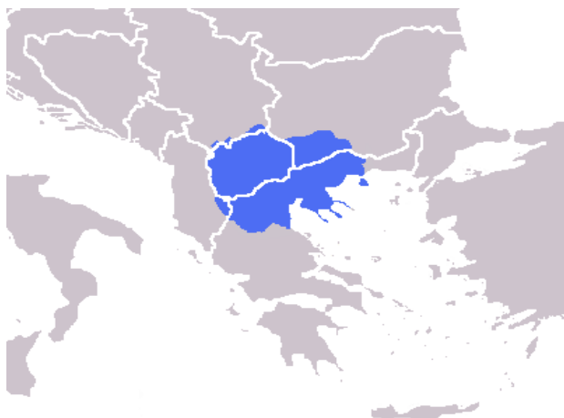
Obrázek 1 – Dnešní rozdělení Makedonie mezi státy