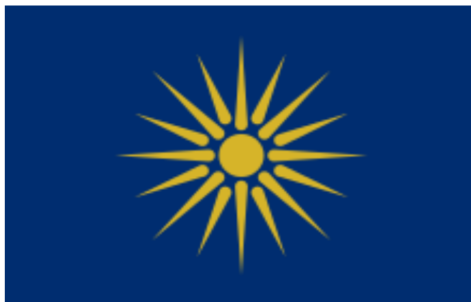
Obrázek 2 – Řecké slunce z verginy (symbol a znak řecké provincie Makedonie)