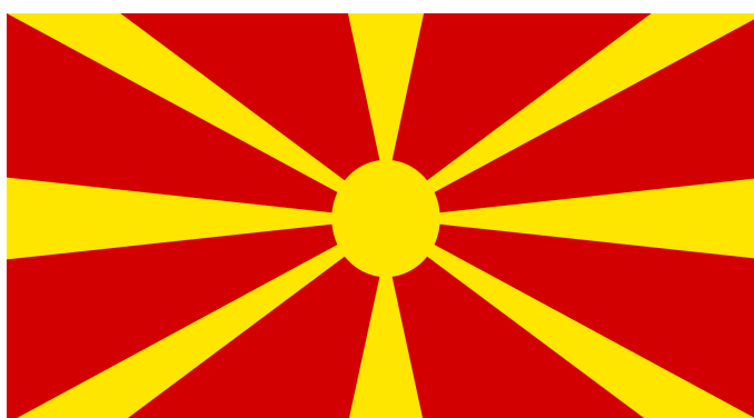
Obrázek 4 – Nová podoba makedonské vlajky po roce 1995