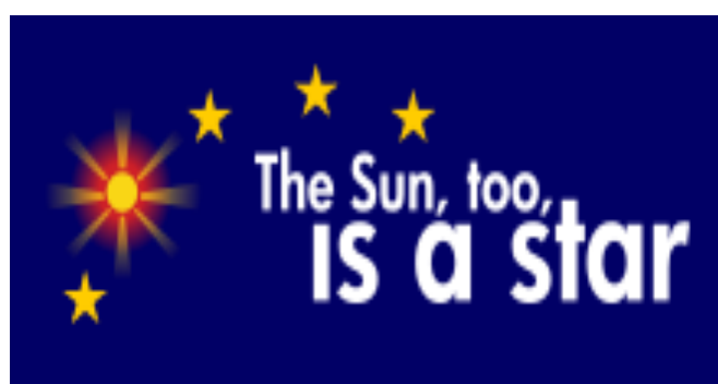
Obrázek 5 – Logo Makedonie o kandidatuře do EU

V rámci kandidatury Makedonie do Evropské unie, používá Makedonie velice zajímavé logo, na kterém je napsaný slogan: „The sun, too, is a star“, což v překladu znamená „Slunce, také je hvězdou“ a makedonská vlajka je vyobrazena na logu jako jedna z hvězd.