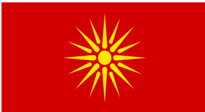
Obrázek 3 - Makedonská vlajka používaná v letech 1992–1995