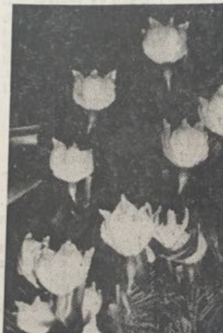
Jaro je tady, a nejen v kalendáři...