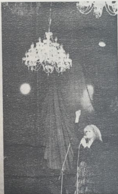
Manekýnky a zpěvačka Eva Pilarová pod lustry Preciosy.