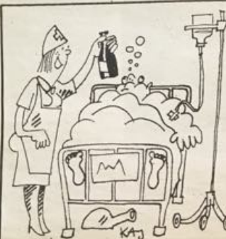
DNES JE SILVESTR, TAK JSEM VÁM DO KAPAČKY ŠOUPLA TROCHU ŠAMPÁNA.