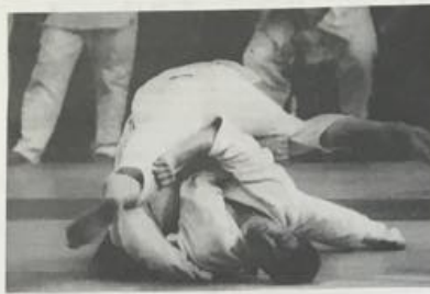
Juničky LIJAZ Jablonce zabíhají letními soutěží ročník L. ligu... Juničky LIJAZ Jablonce zabíhají letními soutěží ročník L. ligu...