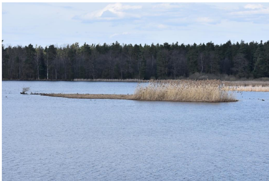
Obr. 3: Částečně pokosený ostrov rybníku Rod