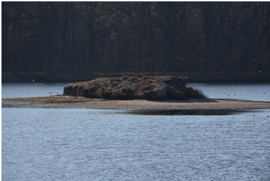
Obr. 2: Pokosený ostrov rybníku Naděje