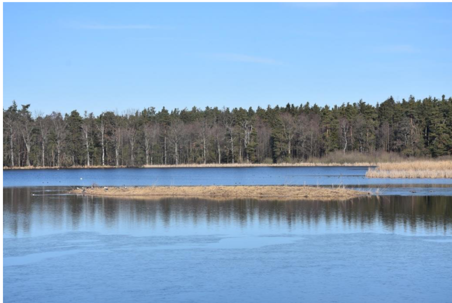
Obr. 1: Pokosený ostrov rybníku Rod

Management (kosení porostu) byl proveden buď na celé ploše ostrovů (Obr. 1 a Obr. 2), nebo jen v určité části (Obr. 3 a Obr. 4). Probíhal vždy v zimě či předjaří před začátkem hnízdní sezóny (Tab. 1). Pro nalezená hnízda byl vyhodnocen jejich osud, a sice, zda bylo hnízdo úspěšné (tj. hnízda, kde bylo vylíhnuto minimálně jedno vejce) či neúspěšné (tj. hnízda, ze kterých nebylo vylíhnuto jediné vejce). Mezi negativní faktory ohrožující osud hnízd bylo zahrnuto opuštění hnízda samicí, predace a zaplavení. Relativní úspěšnost hnízd sledovaných druhů kachen byla vypočtena jako podíl úspěšných hnízd z celkového počtu hnízd.