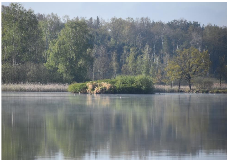
Obr. 4: Částečně pokosený ostrov rybníku Naděje