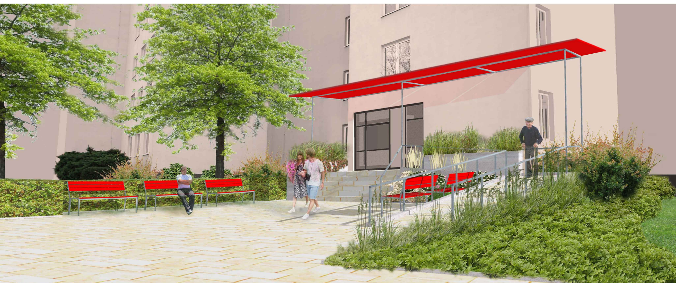
ŘEŠENÍ HLAVNÍHO VSTUPU DO PANELOVÉHO DOMU