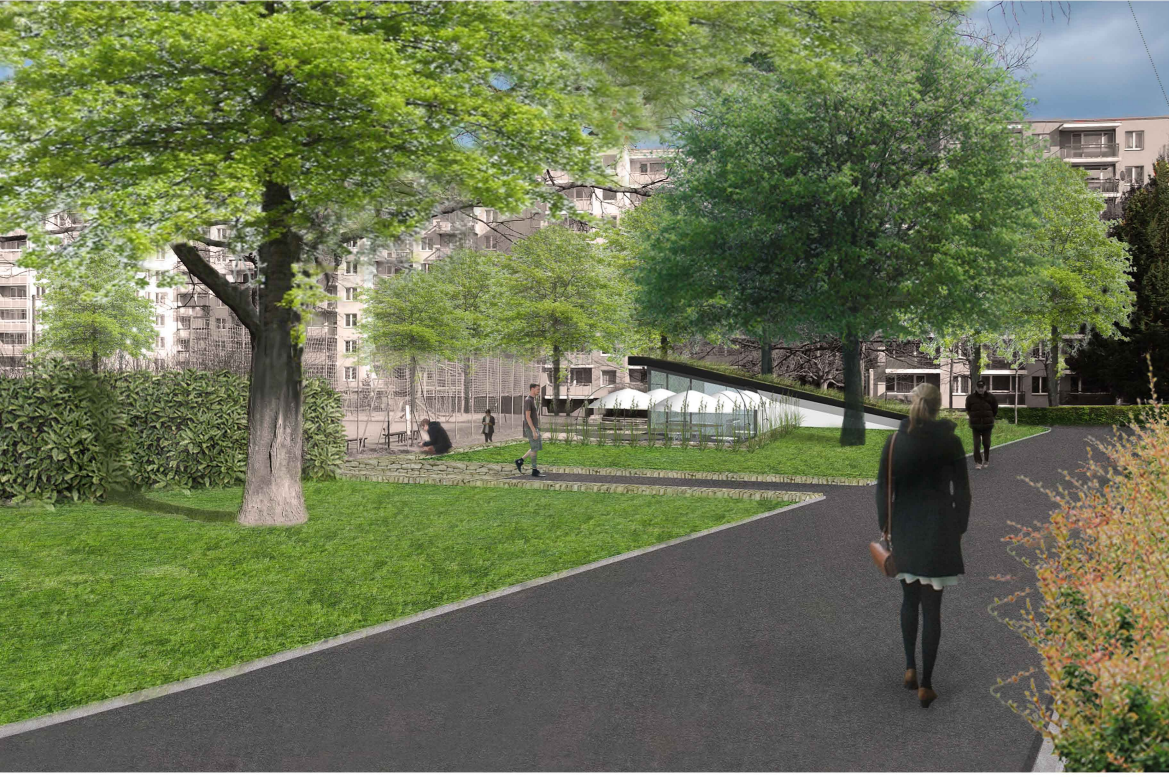
OBYTNÁ SKUPINA SE SPORTOVIŠTĚM A MENŠÍ OBYTNÁ SKUPINA - OBČERSTVENÍ