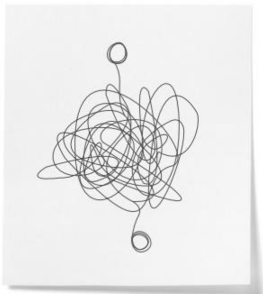
Obrázek 3: Customer journey na základě výzkumu Googlu Messy Middle

Na základě pozorování autoři výzkumu znázornili customer journey následovně. Na papír nakreslili dva body: první bod znázorňuje prvotní impuls ke koupi, druhý bod znázorňuje samotnou koupi. Tyto dva body následně propojuje velmi propletená klikatice, která reprezentuje vše, co se děje, než se zákazník rozhodne koupit. 57