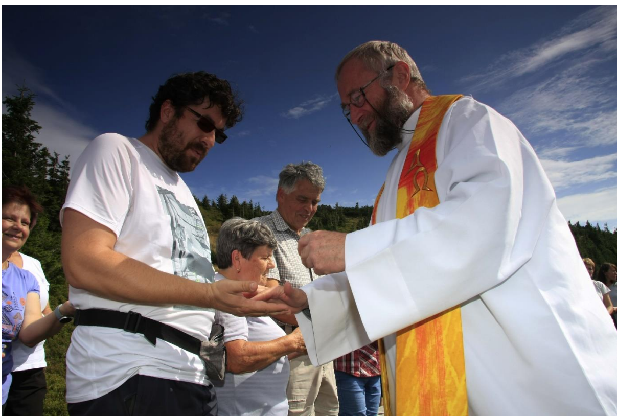
Pouť na Vřesové studánce. Ukázka z mediálního výstupu