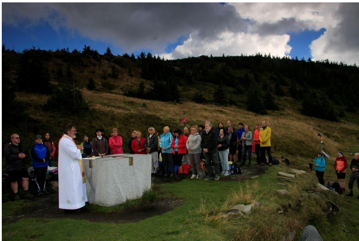
Pouť na Vřesové studánce. Ukázka z mediálního výstupu