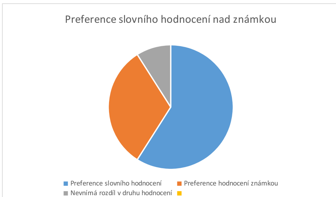
Graf 1: Odpověď respondentů na otázku č. 8