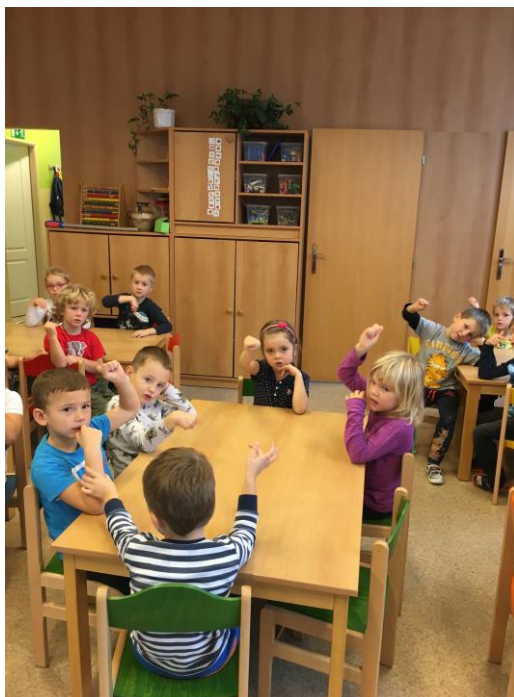
Procvičení zápěstí – větrník