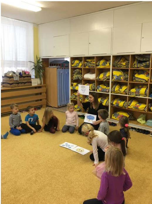
Popisování obrázků počasí