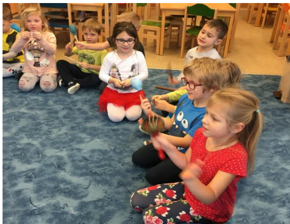
Hra na Orffovi nástroje