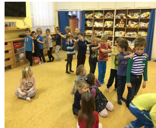
Pohybová hra Na kometu