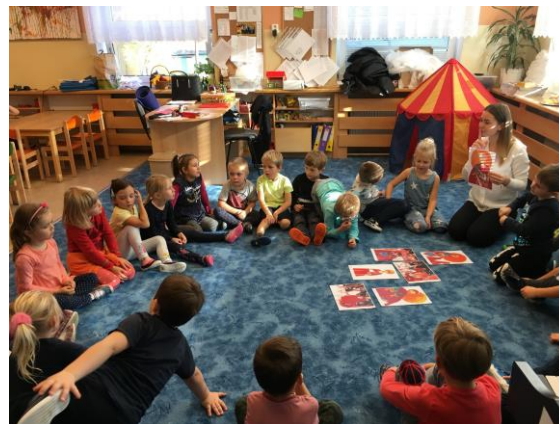
Vyprávění příběhu o sv. Martinovi