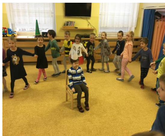
Hra s pohybem Král sedí na trůně