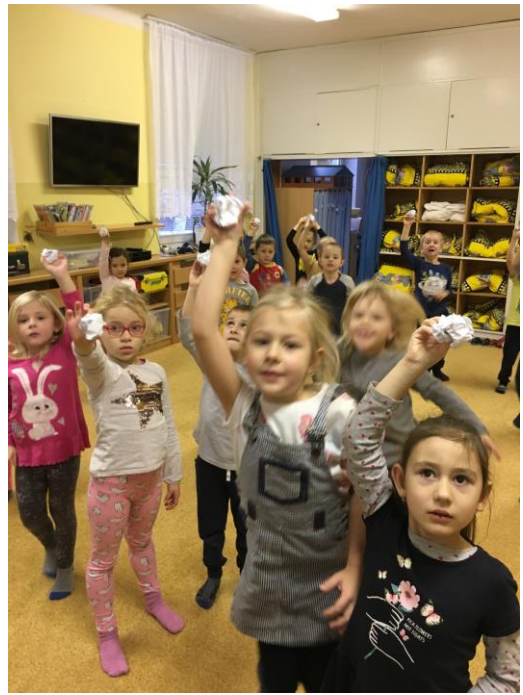
Cvičení se sněhovou koulí