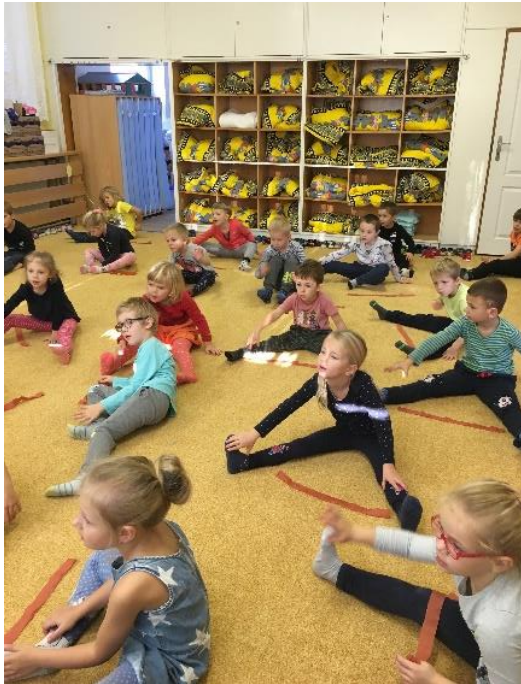
Průpravná část pohybové chvílky