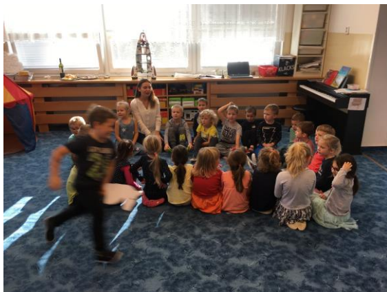
Pohybová hra Martinův kůň