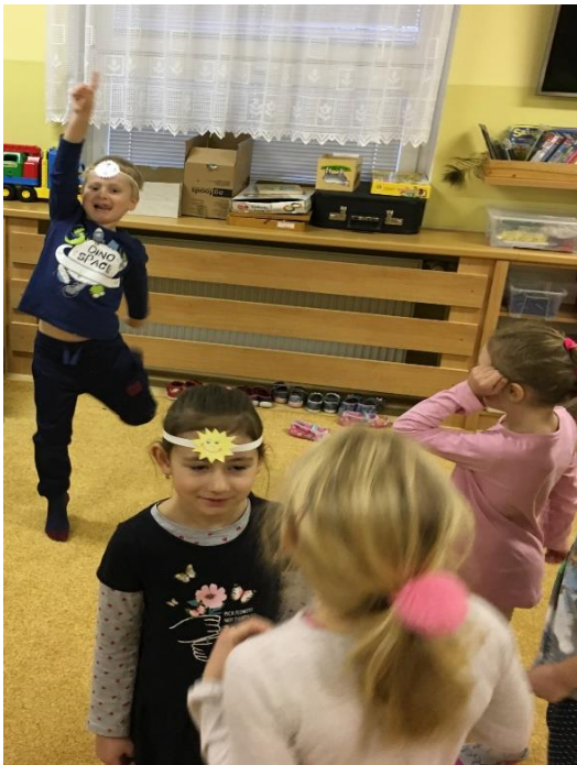
Rušná část – Na Mrazíka a sluníčko