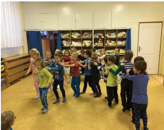
Pohybová hra Na kometu