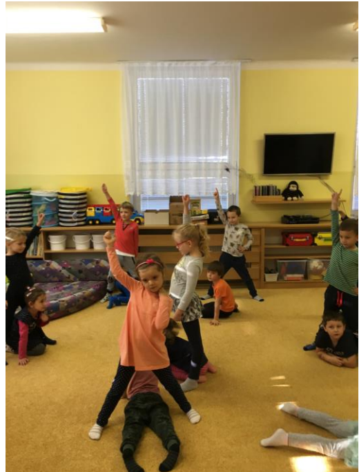
Pohybová hra na koně a stáje