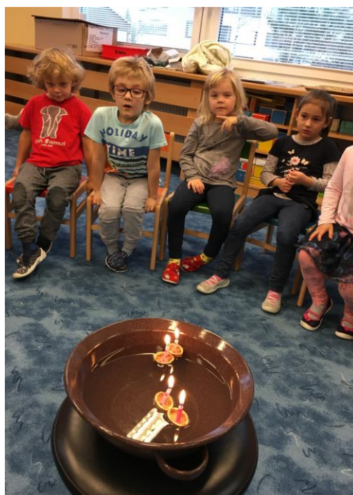
Povídání o tradici pouštění lodiček