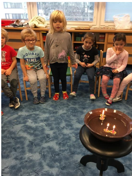
Povídání o tradici pouštění lodiček