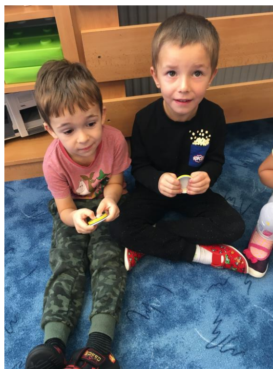
Hra na víčka od přesnídávky