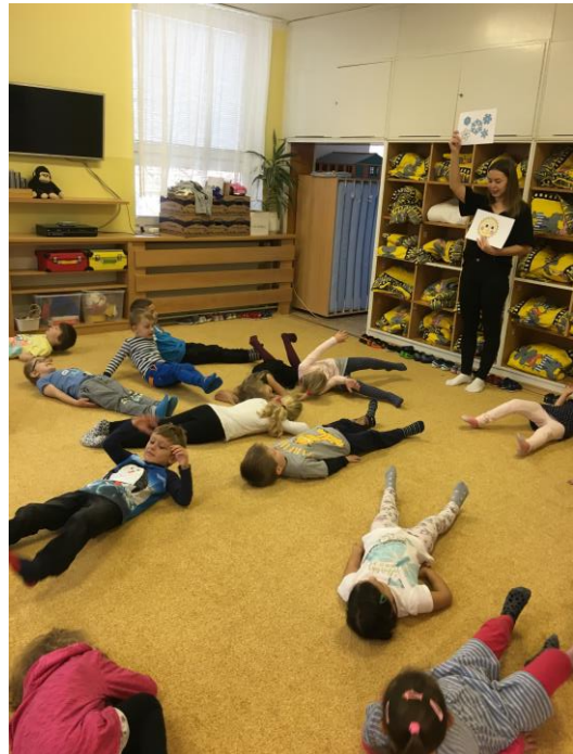
Rušná část pohybové chvílky