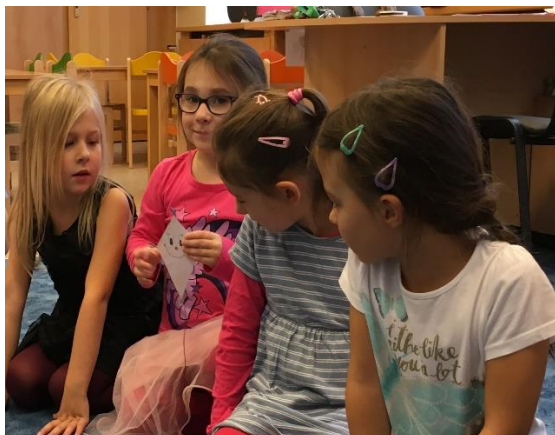
Co viděl dráček