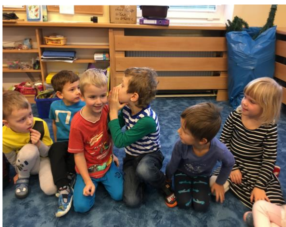
Posílání informace šeptem