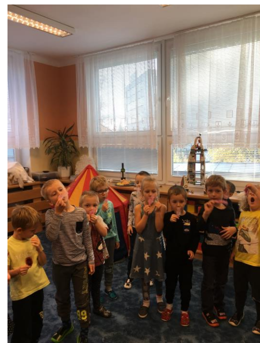
Dechová cvičení s peříčky