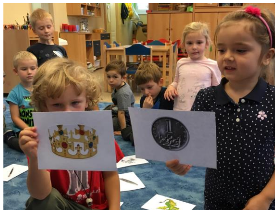
Není drak jako drak