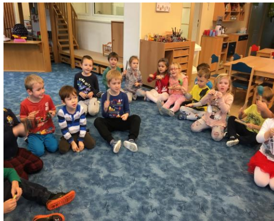
Hra na Orffovi nástroje