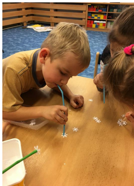
Přenášení vloček brčkem