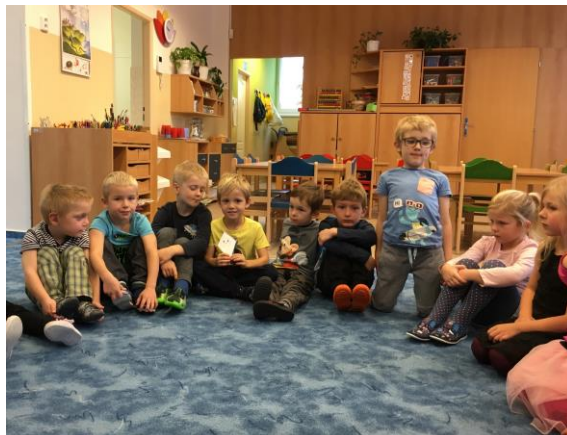
Co viděl dráček