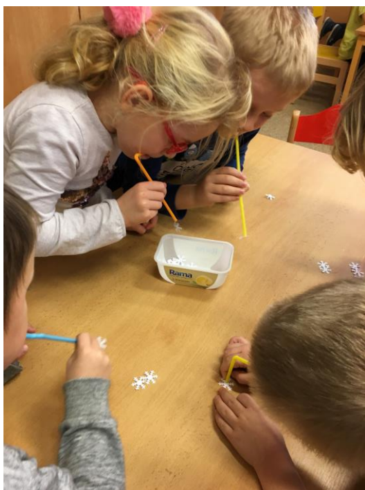
Přenášení vloček brčkem