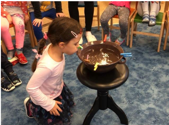
Dechová cvičení s lodičkami