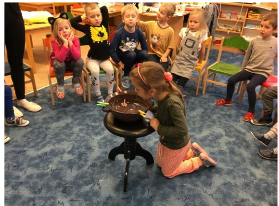
Dechová cvičení s lodičkami