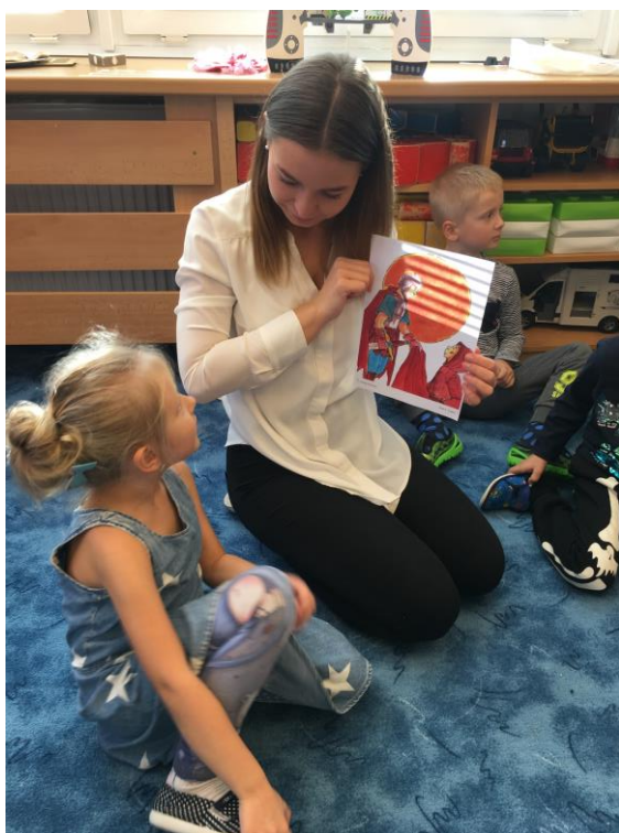
Popis obrázků o svatém Martinovi