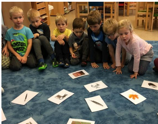
Není drak jako drak