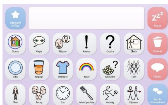
Obr. 10 – Grid3.

Grid 3 – Umožňuje používat počítač jako pomůcku pro komunikaci s okolím. Ta probíhá pomocí předem připravených tabulek (obrázky, slova, písmena), které lze měnit nebo si vytvořit vlastní podle individuálních potřeb uživatele. Díky jednotlivým dlaždicím se slovy si může klient složit vlastní větu, kterou pak program přečte nahlas. Nabízí ovládní PC a mobilního telefonu, používání internetu, poslouchání hudby stažené do počítače apod., ovládní spotřebičů a osvětlení v domácnosti. Tento program lze ovládat jak klasickou myší a dotykem, tak i např. spínači, trackballem, pohybem očí a pohybem hlavy. Přes tento program mohou uživatelé také telefonovat, odesílat a přijímat SMS, odesílat a přijímat emaily, vyhledávat a poslouchat hudbu na internetu nebo v počítači a sledovat videa z počítače. Nabízí i snadný přístup na web a snadnější formu práce se sociálními médii (Facebook, Twitter, You Tube).