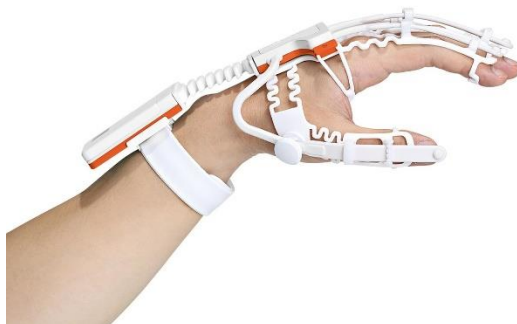
Obr. 2 – Rapael Smart Glove. Foto madisson.cz

Pacient rehabilituje pomocí různých her, které jsou dostupné na tabletu, který je dodáván společně s chytrou rukavicí. (zdroj: madisson.cz)