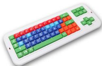
Obr. 6 – Klávesnice Clevy.

Speciální klávesnice (Clevy, Bigkeys) se sníženým počtem kláves, nebo barevně rozlišenými klávesami. Jsou odolnější a větší. Vhodné pro lidi s poruchou jemné motoriky (zdroj: Spektra.eu).