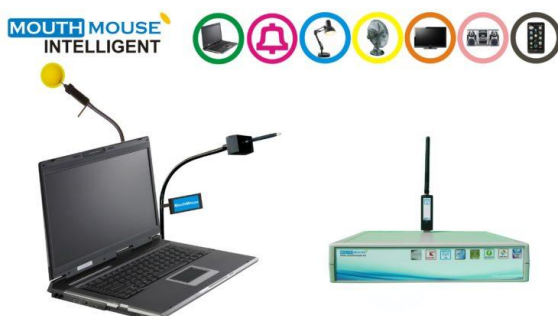
Obr. 9 - MouthMouse Intelligent.

Firma Benetronic nabízí osobám se zdravotním postižením MouthMouse , neboli ústní myš. K dostání je ve verzi Basic , která nabízí pohyb myši hlavou, bradou, dotykem či ústy. Tato základní verze je také používána v lůžkových zařízeních jako rychlý zvonek. Na konci nemá trubičku, která slouží k ovládání počítače, ale je opatřena balónkem, se kterým stačí pohnout a on vydá signál na sesternu a přivolá pomoc. Verze Intelligent pak nabízí i dálkové ovládání chytré televize, DVD, rádia, klimatizace atd (mouthmouse.eu, 2016). Uživatelé si díky tomu mohou např. hlasem přepnout televizi, za předpokladu spojení s programem Diktovačka, kterou taktéž nabízí firma Benetronic. Diktovačka umožňuje převádět mluvené slovo do textu. Text vkládá kamkoliv umístíme kurzor myši. Dále můžeme ovládat mobilní telefon a televizi hlasem (zdroj: Diktovacka.cz).