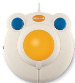
Obr. 7 – Trackball BigTrack.

Alternativy k běžným počítačovým myším. Vhodné pro lidi s poruchou jemné motoriky, ale i pro ty, které trápí třes rukou, kvůli kterému mají nepřesné pohyby. Tyto myši jsou větší a snadněji uchopitelné. Lze je kombinovat s tlačítkem Buddy Button , které nahrazuje levé (potvrzovací) tlačítko klasické počítačové myši. Není třeba instalovat žádný program, připojí se k počítači jako klasická myš. Spektra nabízí Optima Joystick , který nabízí tři varianty úchopu (joystick, téčko, balonek). Pro klienty s menším rozsahem pohybu je vhodný Trackball BigTrack , který funguje jako velká myš. Pro případ, že klient nemůže ovládat počítač rukou, existuje alternativa ovládání počítače pohyby hlavy - Quha Zono (zdroj: Spektra.eu).