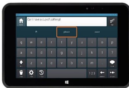
Obr. 5 – Grid Pad Go.

Komunikační zařízení jsou nabízena buď ve formě tabletu nebo formou jednoduchého tlačítkového komunikátoru. Komunikační zařízení INDI , které nabízí Spektra, funguje na základě obrázků. Určen je proto především pro děti, kterým stačí komunikace na základě jednoduchých obrázků. Nechybí ani hlasový český výstup. Podobné je i komunikační zařízení Grid Pad Go , které taktéž najdeme v sortimentu Spektra. Zástupcem jednoduchých komunikátorů je Tabulkový komunikátor GoTalk , který je tvořen dotykovou tabulkou, kterou lze upravovat. Obsahuje taktéž hlasový výstup (zdroj: Spektra.eu).