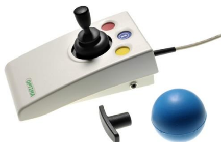
Obr. 8 – Optima Joystick.