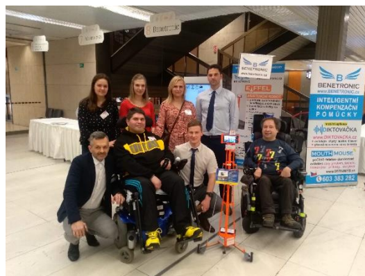
Obr. 11 – Tým CITAK na konferenci INSPO se zástupci firmy Benetronic.

Konference INSPO (Internet a informační systémy pro osoby se specifickými potřebami) je konference konající se jednou ročně v Praze. Zde jsou během jednoho dne představeny různými firmami novinky v oblasti technologií pro osoby se specifickými potřebami (zdroj: inspo.cz)