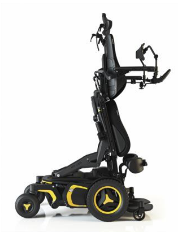
Obr. 3 – Vertifikační vozík.