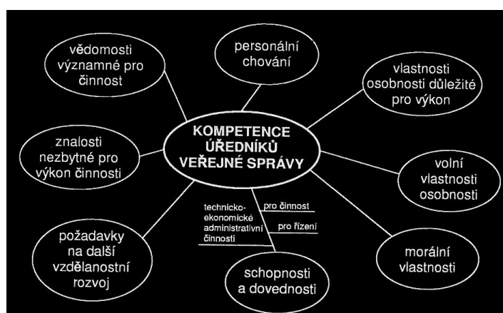
Obrázek 1 – Určení podstatných profilujících znaků pracovníka veřejné správy 28

Zaměstnanci veřejné správy jsou vysoce kvalifikovanými úředníky se specifickými požadavky na výkon této profese podle organizační úrovně (hierarchie), druhu práce (koncepční, rutinní), základní odbornosti (profese, specializace), občanské spolehlivosti a bezúhonnosti a osobních předpokladů (týmová práce, zvládání stresových situací, práce s problémovými klienty apod.) Z toho všeho pak jasně vyplývá základní koncept kompetence úředníka veřejné správy. 27