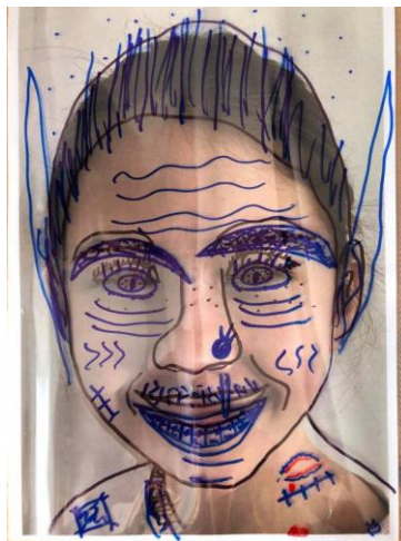
Příloha 20 PROMĚNA C (dívka 6 let, A4)