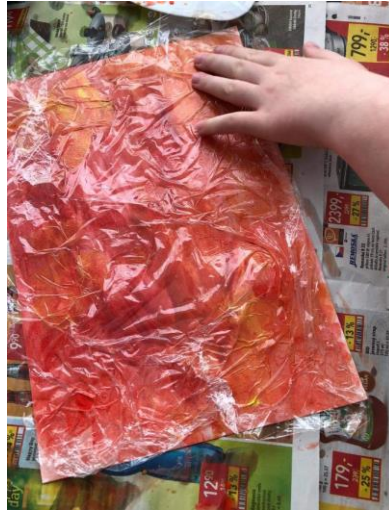
Příloha 22 PRÁCE S POTRAVINÁŘSKOU FOLIÍ