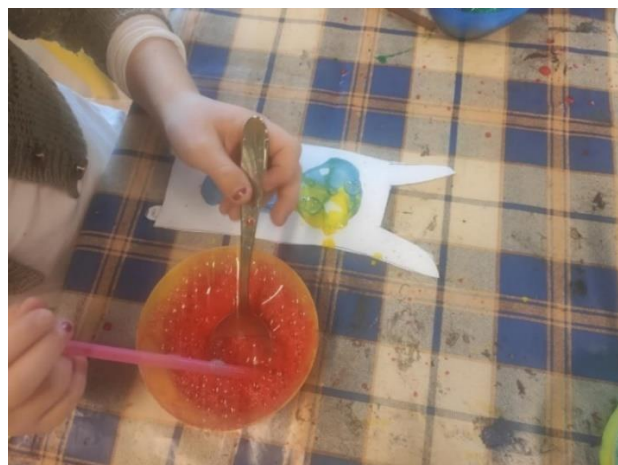
Příloha 9 PŘENÁŠENÍ BUBLIN