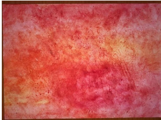
Příloha 23 PODKLAD PRO OHEŇ