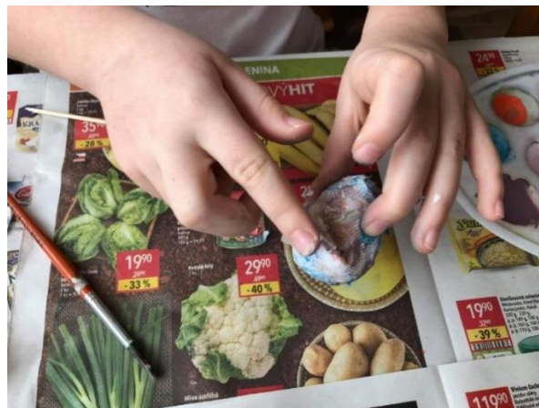
Příloha 12 LEPENÍ PAPIROVÉ UTĚRKY NA VEJCE Z ALOBALU