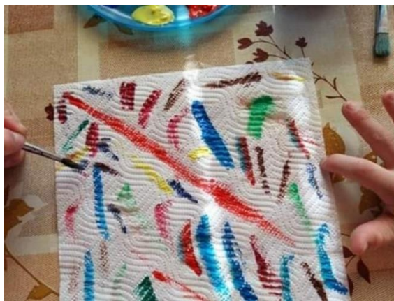
Příloha 11 BARVENÍ PAPIROVÉ UTĚRKY