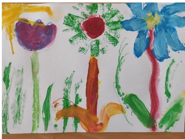
Příloha 34 "LEDOVÉ" KVĚTINY A (dívka, 5 ½ let, A4)