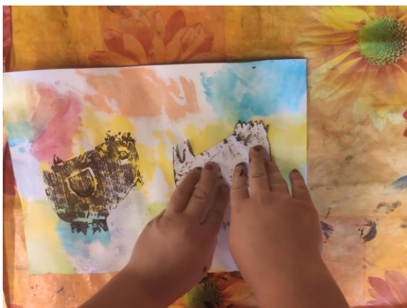
Příloha 4 TISK Z PAPIROVÉ KOLÁŽE