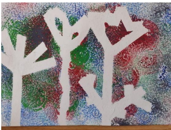
Příloha 30 BALÓNKOVÉ KVĚTINY A (dívka, 5 let, A4)