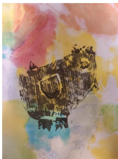
Příloha 6 OTISK PAPIROVÉ KOLÁŽE B (dívka, 6 let, A4)