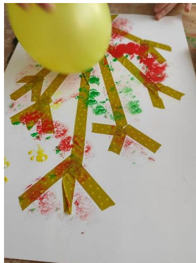
Příloha 27 "BALÓNKOVÁNÍ"