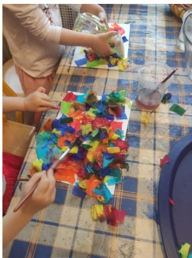
Příloha 1 MALOVÁNÍ KREPOVÝM PAPIREM