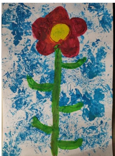
Příloha 38 KVĚTINA PRO MAMINKU A (dívka, 5 ½ let, A4)