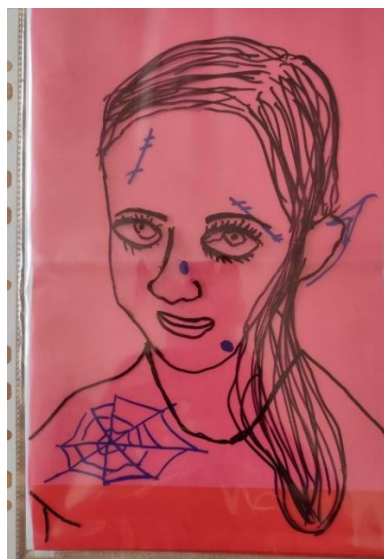
Příloha 18 PROMĚNA A (dívka, 6 let, A4)