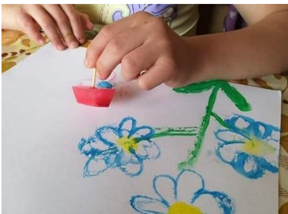
Příloha 32 MALOVÁNÍ LEDOVÝMI BARVAMI