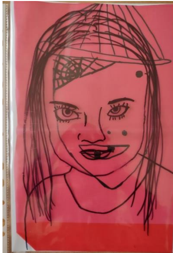
Příloha 19 PROMĚNA B (dívka, 5 ½ let, A4)