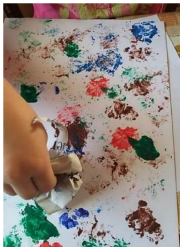
Příloha 36 VYTVÁŘENÍ STRUKTURY POMOCÍ ZMAČKANÝCH NOVIN