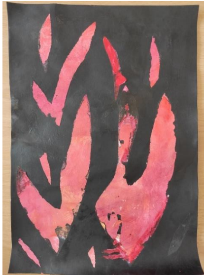
Příloha 25 OHEŇ B (chlapec, 4 roky, A4)