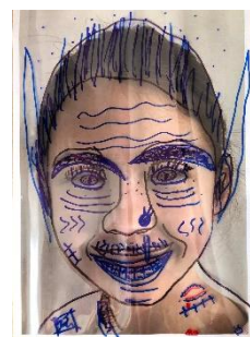
Obr. 5 Proměna

Společně mohou děti hádat kdo je ukrytý v podobě čarodějnice. Děti si navzájem ukáží svou čarodějnickou proměnu. Můžou se pokusit popsat, co jim přibylo, jak se proměnily.