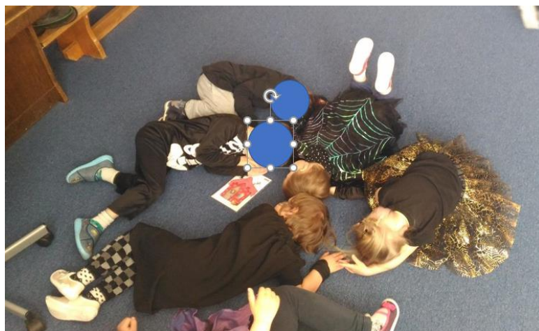
Priloha 49 SPÍCÍ ČARODĚJNICE - HRA NA BAFEVNÉ CHAJDY