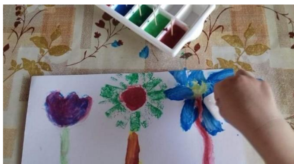
Příloha 33 POUŽITÍ LEDOVÝCH BAREV