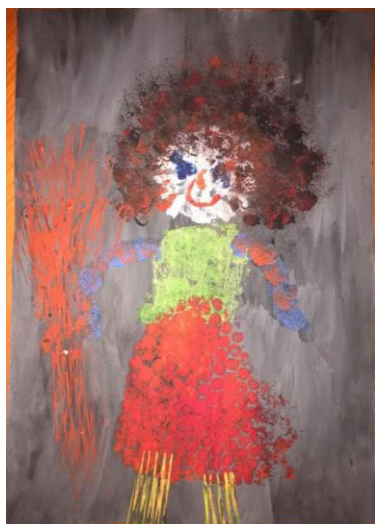
Příloha 16 ČARODĚJNICE B (dívka, 5 let, A3)