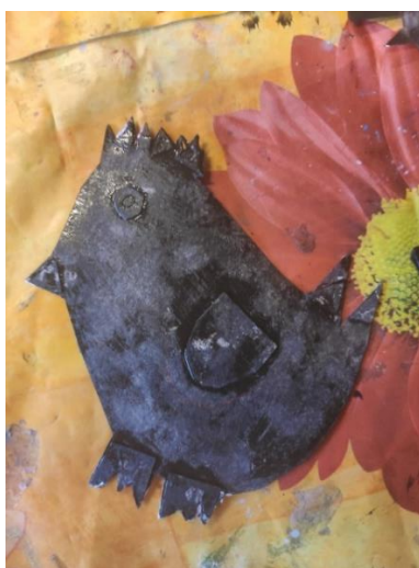
Příloha 5 POUŽITÁ PAPIROVÁ KOLÁŽ (dívka, 6 let)