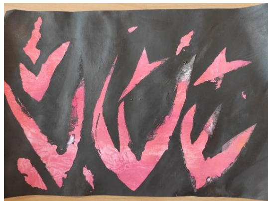
Příloha 24 OHEŇ A (dívka, 5 let, A4)