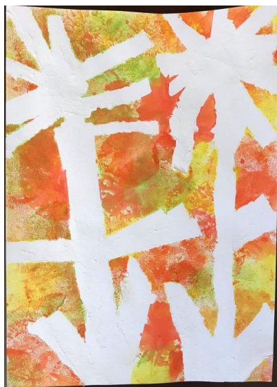
Příloha 31 BALÓNKOVÉ KVĚTINY B (dívka, 3 ½ roku, A3)