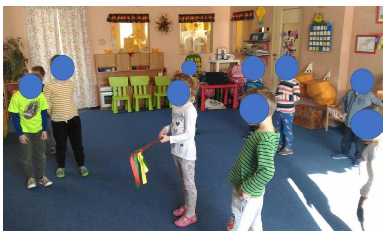
Příloha 48 HONIČKA S POMLÁZKOU