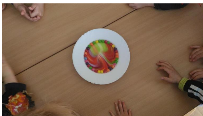
Příloha 44 POKUS S BONBÓNY