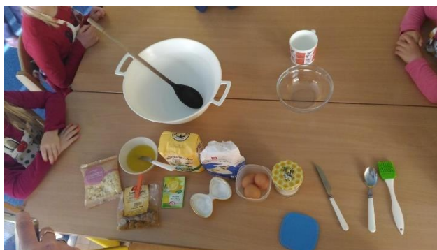
Příloha 41 PŘÍPRAVA SUROVIN NA PEČENÍ