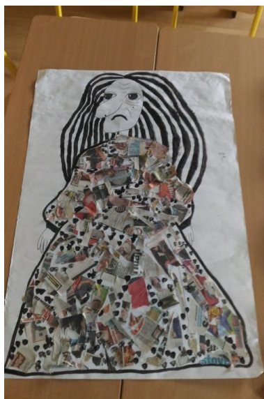
Příloha 46 VÝLEDNÁ ČARODĚJNICE