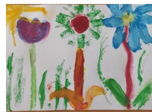
Obr. 8 Ledové květiny

Jak se dětem pracovalo? Chtěly by s ledovými barvami pracovat ještě někdy příště? Co jim vykvetlo?