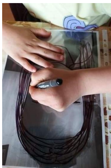
Příloha 21 KRESBA NA FOLII