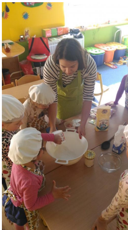
Příloha 42 SPOLEČNÁ PŘÍPRAVA TĚSTA NA MAZANEC