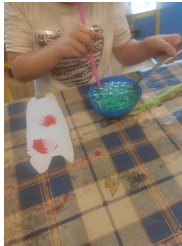
Příloha 8 FOUKÁNÍ BUBLIN