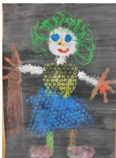
Příloha 15 ČARODĚJNICE A (dívka, 6 let, A3)