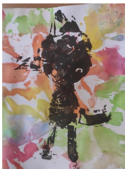
Příloha 3 OTISK PAPIROVÉ KOLÁŽE A (chlapec, 5 let, A4)