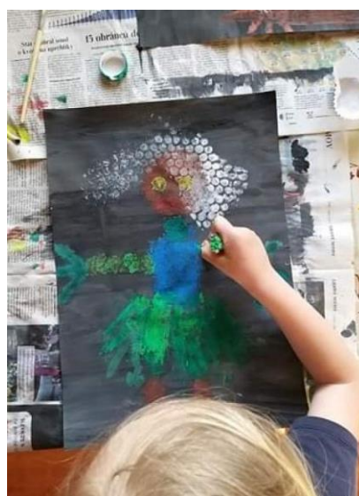
Příloha 14 ČARODĚJNICE JE SKORO NA SVĚTĚ