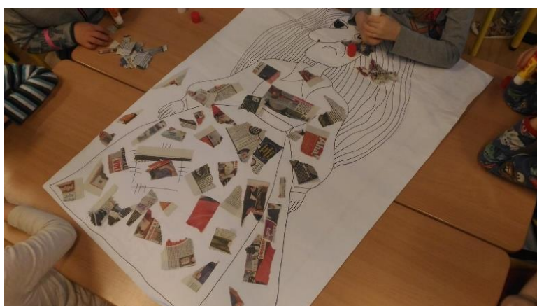
Příloha 45 ŠATY PRO ČARODĚJNICI