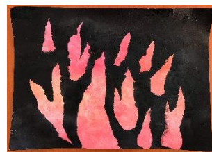
Obr. 6 Ohýnek

Zhodnocení činnosti paní učitelkou, pochvala dětí. Povídání o ohni. K čemu můžeme oheň využít apod.