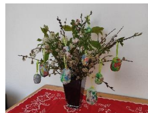
Obr. 3 Váza s kočíčkami

Společné zdobení kočíček vytvořenými kraslicemi. Povídání si o tom, jak probíhá příprava na Velikonoce u nich doma. Zda pomáhají barvit a zdobit vajíčka, s kým je zdobí, zda mají doma také vázu s kočíčkami apod.