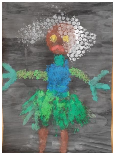
Příloha 17 ČARODĚJNICE C (chlapec, 5 let, A3)