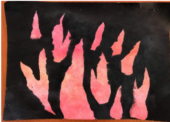
Příloha 26 OHEŇ C (dívka, 6 let, A4)