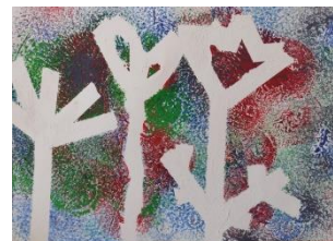
Obr. 7 Rozkvetlá louka