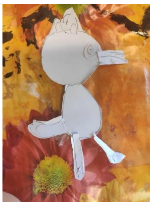
Příloha 2 PAPIROVÁ KOLÁŽ (chlapec, 5 let)