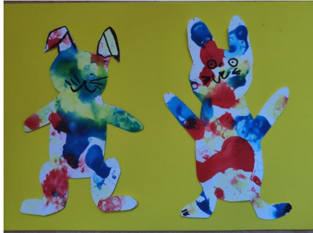
Příloha 10 BUBLINOVÍ ZAJÍČCI (dívka, 5 ½ /chlapec, 4 roky, A4)