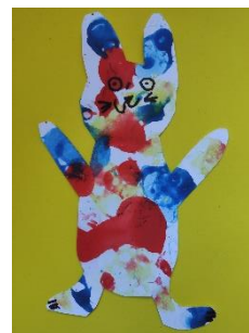
Obr. 2 Bublínkový zajíček

V kruhu – děti představí svého velikonočního zajíčka (mohou mu vymyslet jméno) a řeknou, co dobrého umí jejich zajíček, v čem přináší lidem štěstí.