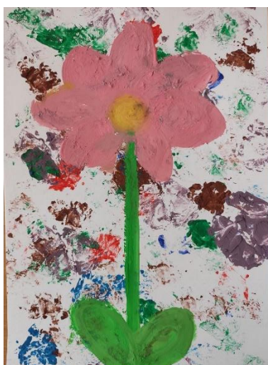
Příloha 39 KVĚTINA PRO MAMINKU B (dívka, 6 let, A4)