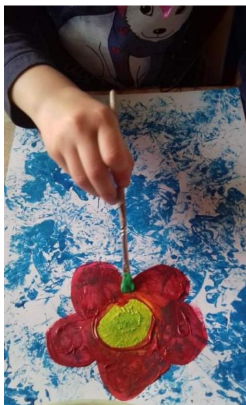
Příloha 37 MALOVÁNÍ KVĚTINY