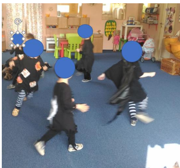
Priloha 50 ČARODĚJNICKÝ REJ