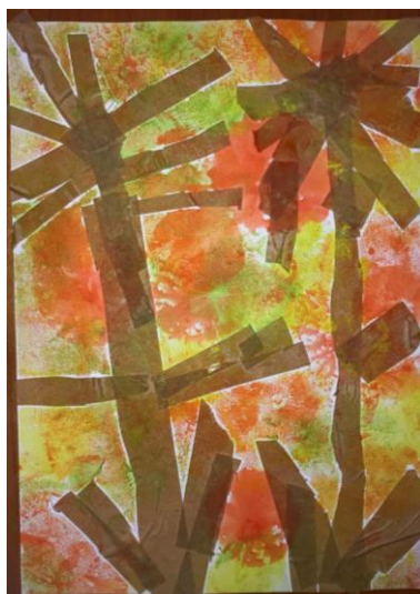
Příloha 28 MALOVÁNÍ POMOCÍ BALÓNKŮ