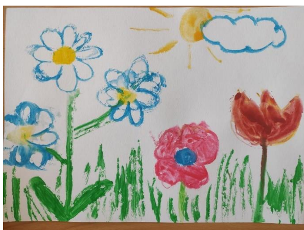
Příloha 35 ROZKVELTÝ MÁJ (dívka, 6 let, A3)