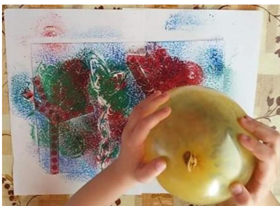
Příloha 29 NANÁŠENÍ BARVY BALÓNKEM