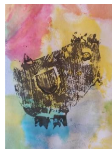
Obr. 1 Velikonoční slepička

V kruhu – děti postupně ukáží svůj obrázek ostatním a popíší, koho na něm mají (kuřátko, slepici, slepici s kuřátky, kohouta apod.) Povídání o slepicích, kohoutech a kuřatech – vzhled, co jedí, kde žijí, jak se o ně lidé starají a o jejich souvislosti s Velikonocemi.