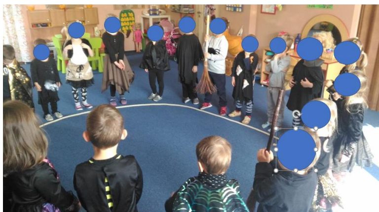
Příloha 47 ČARODĚJNÁ KOŠTATA