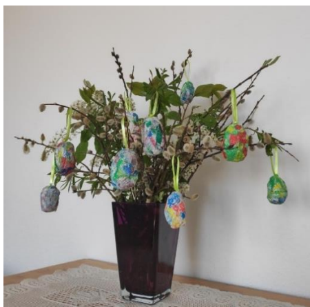
Příloha 13 VÁZA S "KRASLICEMI"