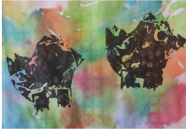
Příloha 7 OTISK PAPIROVÉ KOLÁŽE C (dívka, 6 let, A4)