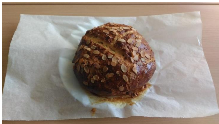
Příloha 43 UPEČENÝ MAZANEC