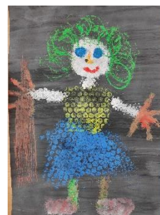
Obr. 4 Čarodějnice

Nejprve děti představí svou čarodějnici a zkusí ji svým kamarádům popsat. Děti si vyberou obrázek čarodějnice, která se jim líbí a řeknou proč – co se kamarádovi povedlo apod.