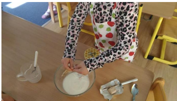
Příloha 40 PŘÍPRAVA KVÁSKU