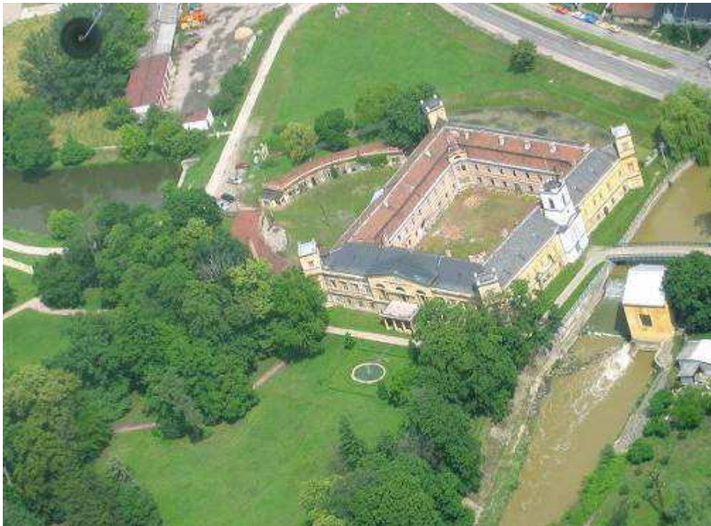
Obr.10 Letecký pohled na zámek