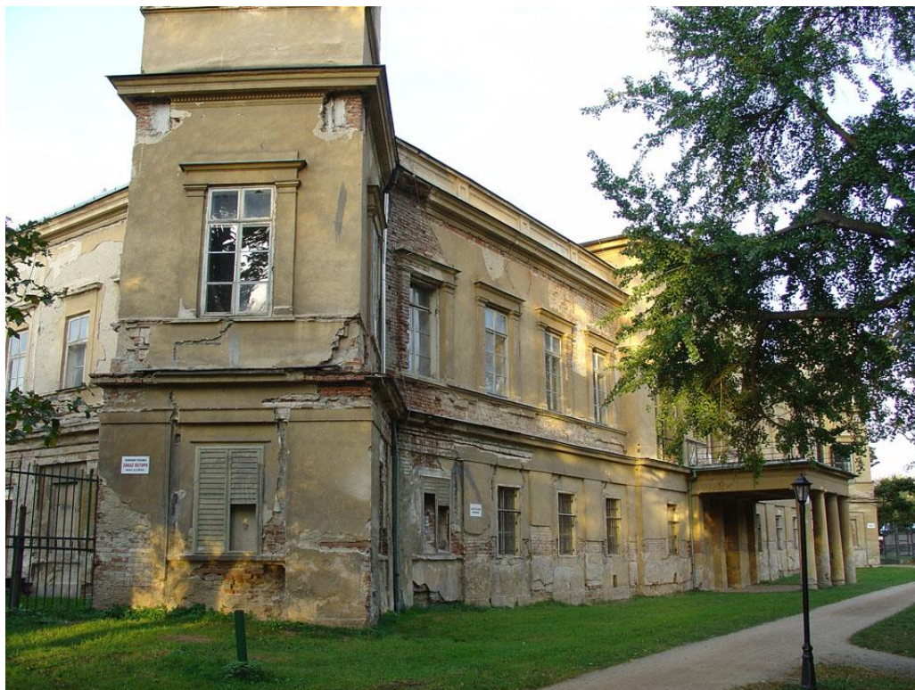
Obr. 12 Zámek v současnosti