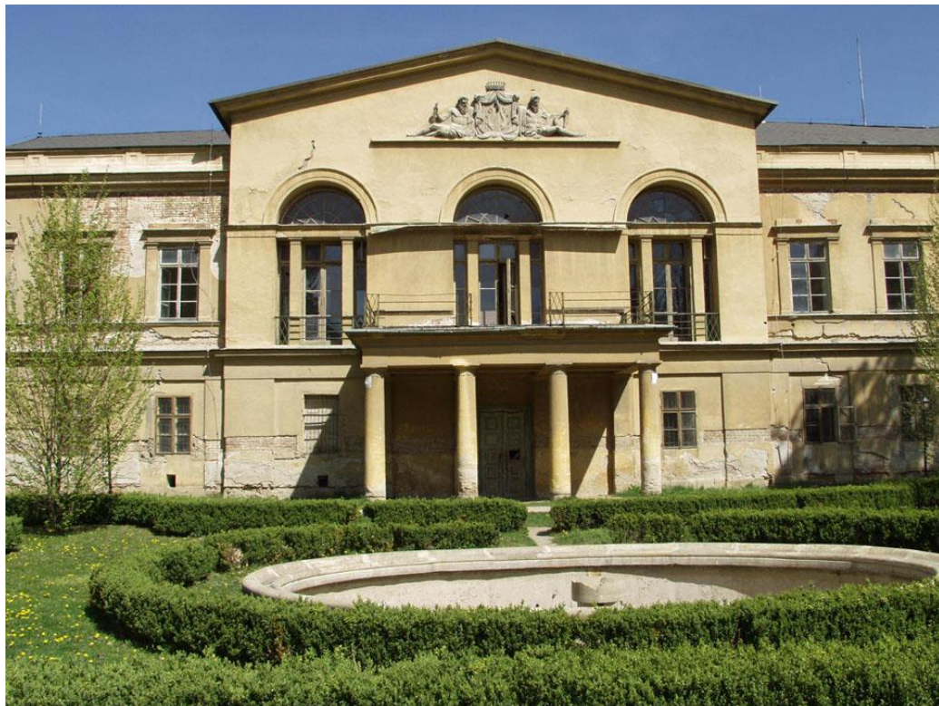
Obr. 9 Zahradní průčelí zámku

Zdroj: Stavebně-historický průzkum, Veselí nad Moravou – zámek, vypracovala PhDr. Slavomíra Kašpárková, Olomouc 2005