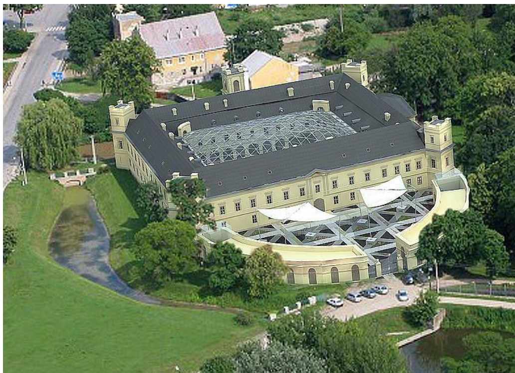
Obr. 14 Celkový pohled