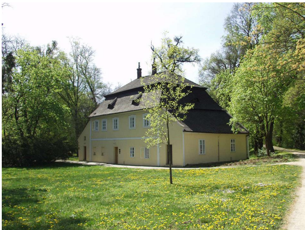
Obr. 13 Objekt bývalé myslivny