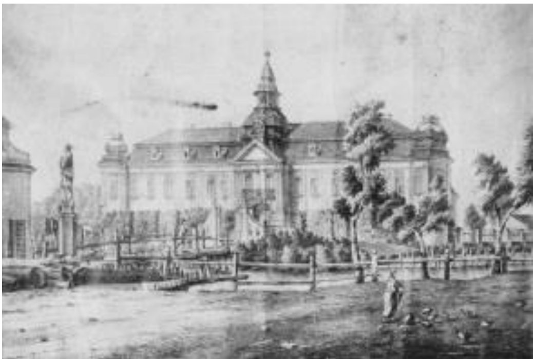
Obr. 4 Západní část zámku, 18. století