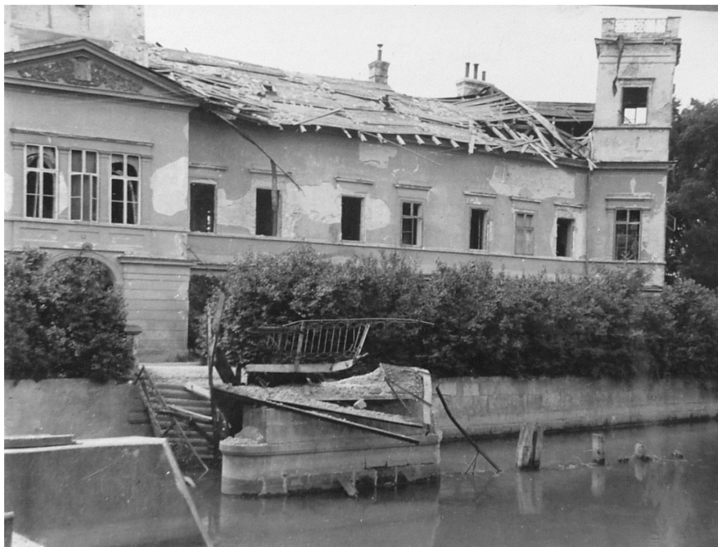
Obr. 8 Pohled na východní křídlo zámku po 2. světové válce, rok 1945