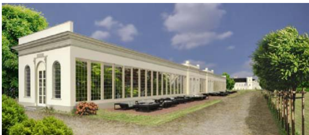
Obr. 17 Oranžerie