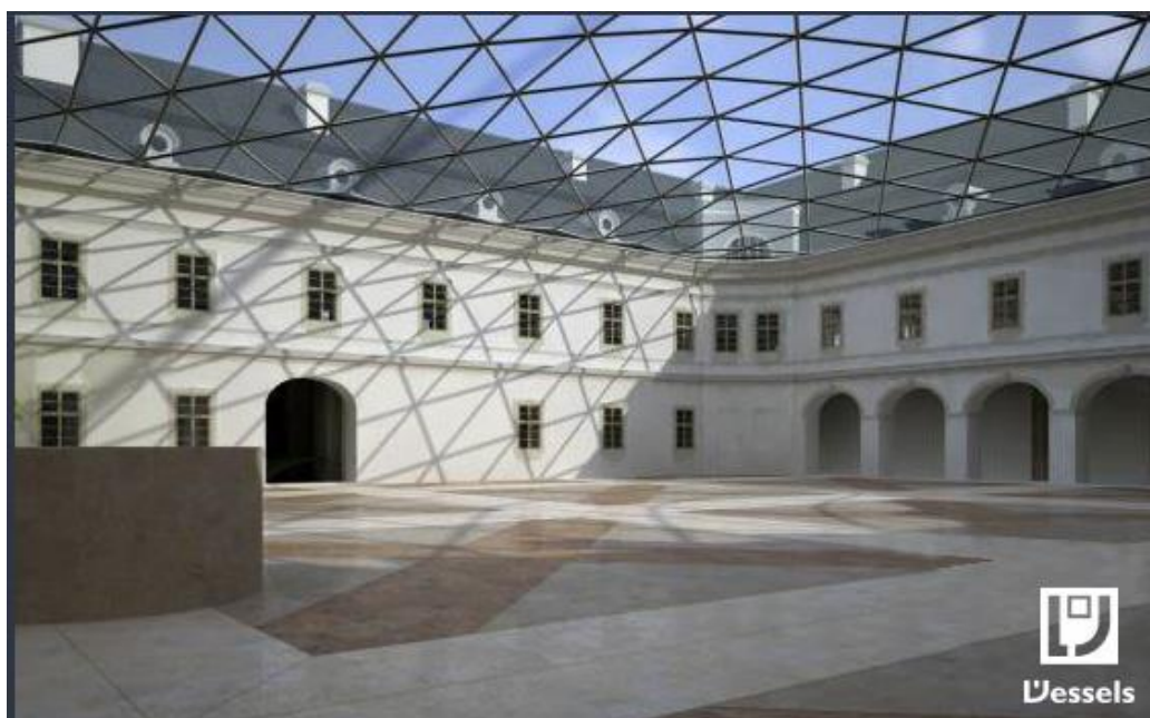
Obr. 15 Zastřešené nádvoří