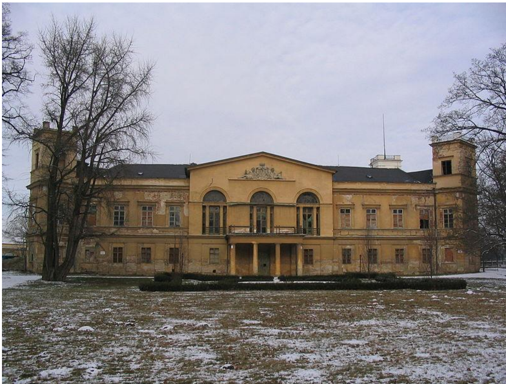
Obr. 11 Zahradní průčelí, konec 20. století