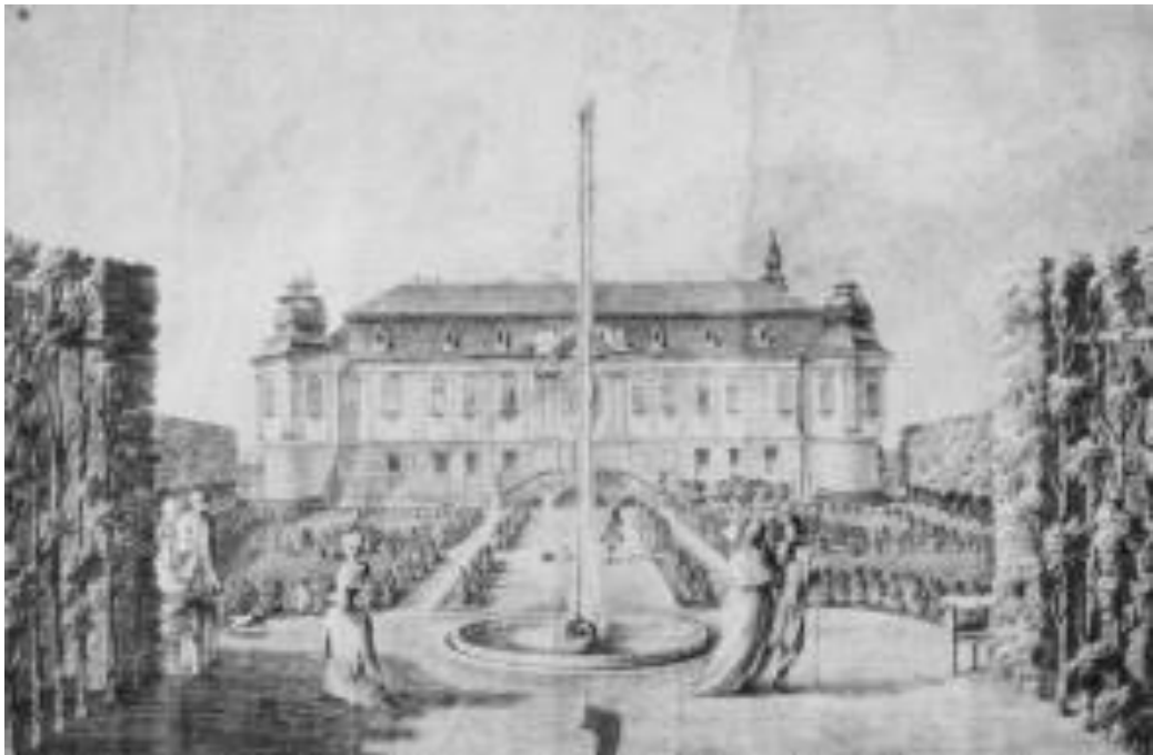
Obr. 3 . V průběhu 18. století, za Jana Františka Chorinského, došlo k přestavbě zámku na barokní šlechtické sídlo