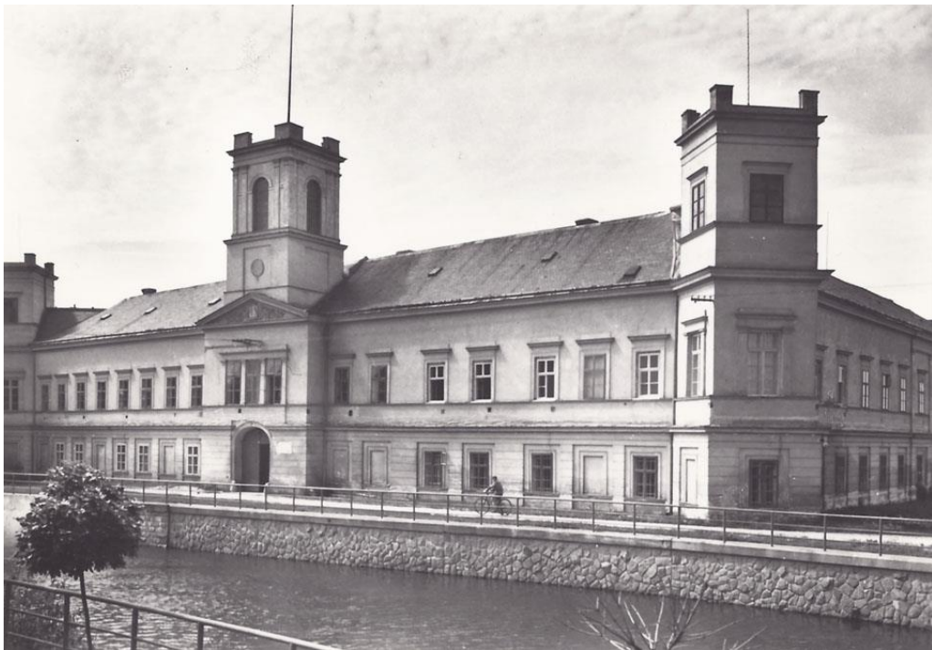
Obr. 6 Zámek v 19. a v počátku 20. století