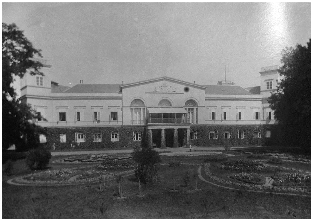
Obr. 7 Jižní průčelí zámku v 19. století

Zdroj: http://www.wessels.cz/fotky/pohlednice/pohV_05.html ze dne 27.3.2014