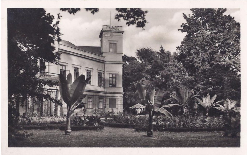
Obr. 5 Zámek v 19. století