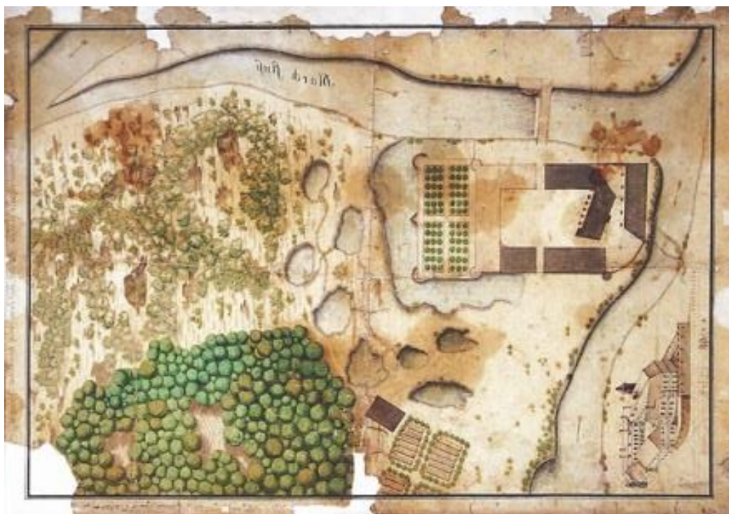
Obr.1 Mapa zámecké zahrady s půdorysem zámku z roku 1748