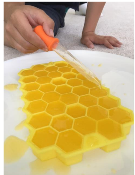
Obr. č. 9. Simulace sběru nektaru (Meriková,2022) Obr. č. 10. Plnění plástve sladinou (Meriková, 2022)