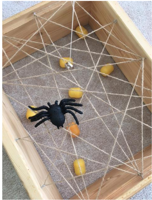
Obr. č. 13. Aktivita Pavučina (Meriková, 2022)

Zhodnocení: Tato aktivita děti velmi bavila. Okamžitě byly připraveny pomáhat včelkám v ohrožení. Tímto demonstrovali pozitivního postoj k živému a prosociální chování. A to je ochota pomoci slabšímu, zranitelnějšímu, někomu v ohrožení.