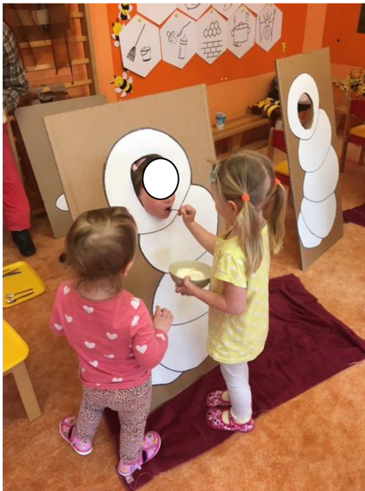
Obr.č. 4. Krmení larvy (Meriková, 2018).

Pokud bude zvolena varianta výroby krmné směsi z pylu, medu a mateří kašičky, je potřeba mít připraveno dostatečný počet misek a lžiček. Děti často lžičku olizují nebo neodhadnou množství ingrediencí, a tak bude potřeba pedagogický dohled nad aktivitou.