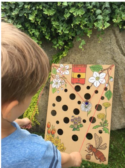
Obr. č. 2. Kuličková dráha (Meriková, 2018).

Závěr: Děti tato aktivita nesmírně bavila a chtěly ji neustále opakovat, zkoušely různou obtížnost. Zde si děti procvičily odhad, pravou a levou orientaci, jemnou motoriku, koordinaci těla.