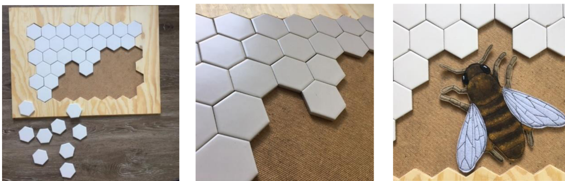
Obr. 8. Edukační pomůcka – stavba plástve, keramické dlažky na dřevěném podkladu (Meriková, 2022)

Zhodnocení: Obecně děti mají rádi rušné části u kterých se běhá a navíc staví. Ve třídě bylo rušno, jako v úlu. I přes to, že jim bylo připomínáno, že včelky spolupracují, mnozí soutěžili. Nadšení se hlavně projevovalo, když někdo našel schovanou šestibokou dlaždičku, reprezentující včelí buňku. A silným emočním momentem bylo, když chyběli dva dílky, celá třída hledala a nikdo již nedoufal v jejich nalezení. Ale když se po delší době tak stalo, třída propukla v nadšení.