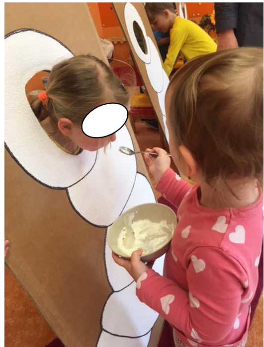
Obr.č. 5. Krmení larvy (Meriková, 2018).