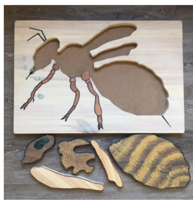
Obr. 7. Dřevěné části puzzle (Meriková, 2019)