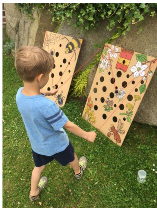
Obr. č. 3. Kuličková dráha (Meriková, 2018).