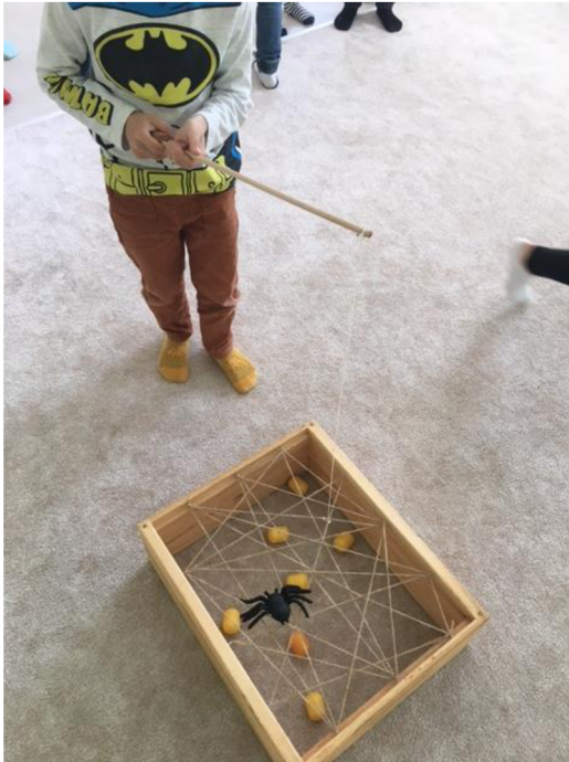
Obr. č.12. Aktivita Pavučina (Meriková, 2022)