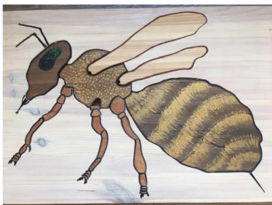
Obr. 6. Dřevěné puzzle (Meriková, 2019)

Pro představení anatomické skladby těla včely medonosné dětem je použita edukační pomůcka z přírodního materiálu, kterou si lektorka sama individuálně zhotovila. Na dřevěné desce o velikosti 50 X 70 cm je zobrazena včela medonosná, a to z bočního pohledu. Z dřevěného obrázku včely lze vyjmout pět částí těla tohoto zástupce hmyzu. Jedná se o hlavu, hrud', zadeček, jedno přední a zadní křídlo. Tyto vyjímatelné části jsou na začátku programu poschovávány ve třídě, a to takovým způsobem, aby byla viditelná alespoň malá část z celku.