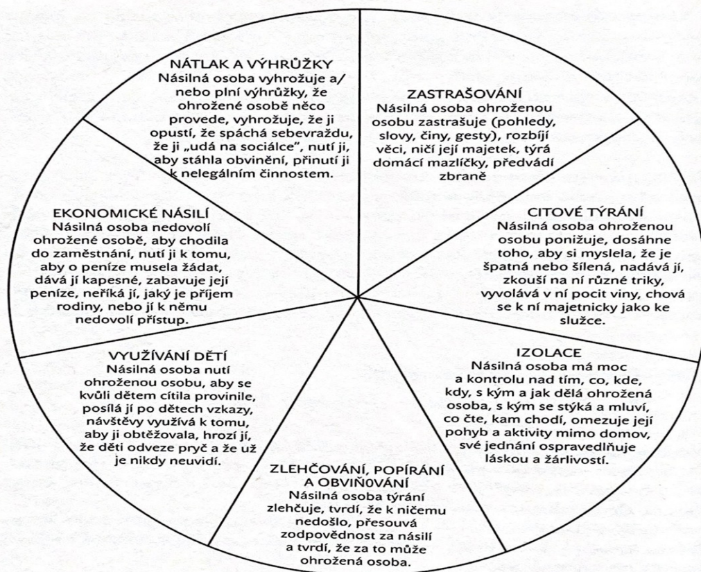
Obr. 3 Duluthský model kontroly a moci (upraveno)