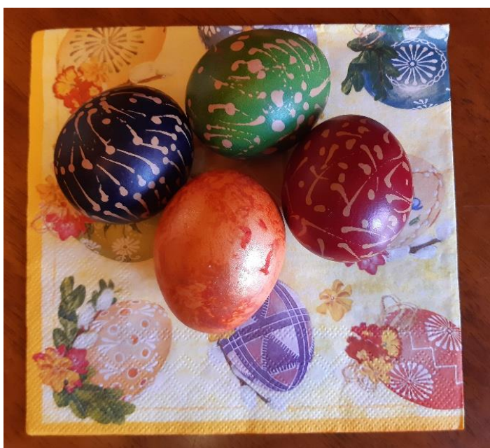
Výtvarná činnost – 4. ročník