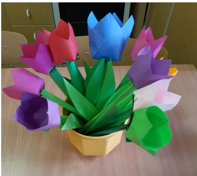
Obrázek č.3 Pracovní činnost – 3. ročník speciální třídy