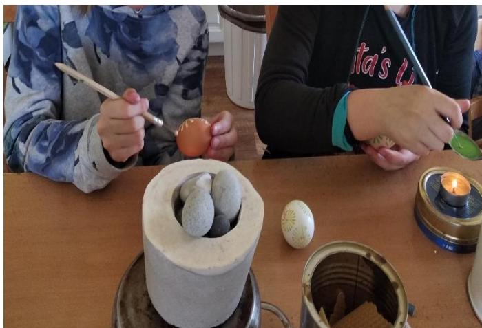
Výtvarná činnost – 4. ročník speciální třídy