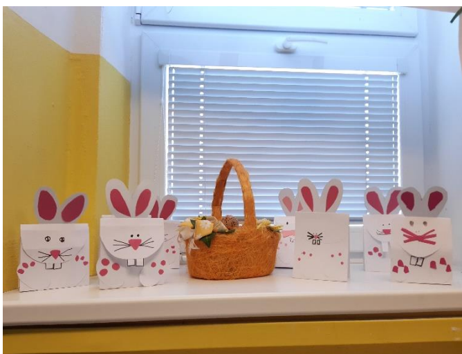
Obrázek č.2 Pracovní činnost – 2. ročník