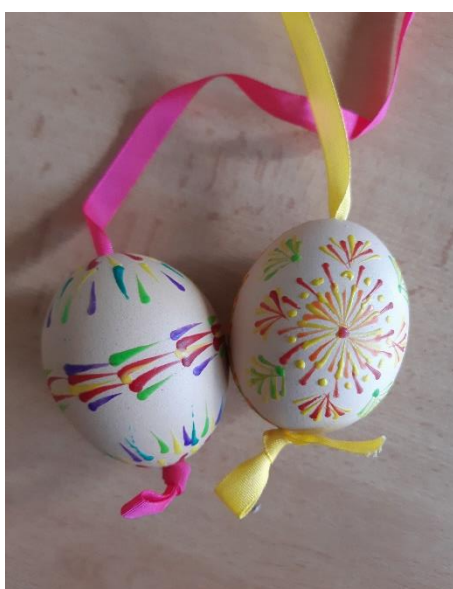
Výtvarná činnost – 5. ročník