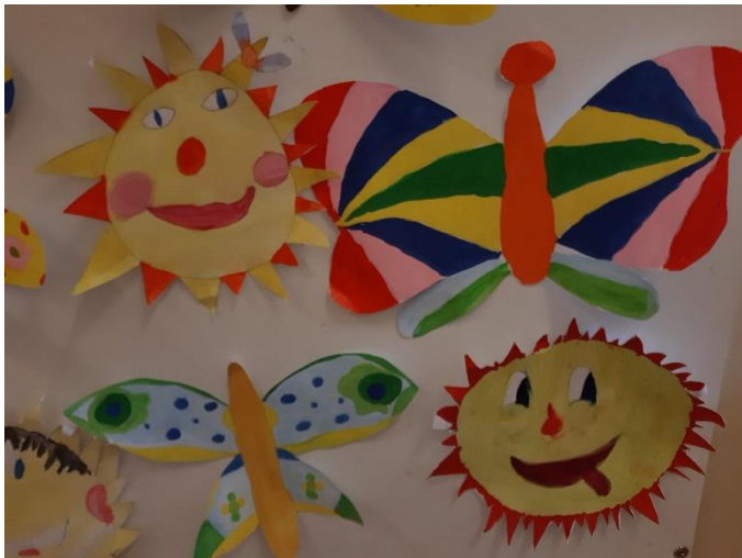
Obrázek č.1 Výtvarná činnost – 1. ročník