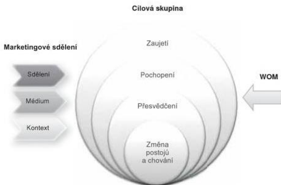
Obrázek 2, Model marketingové komunikace, Zdroj: Karlíček, Král, str. 23

Další nezbytnou podmínkou efektivního fungování je optimální tvorba komunikačního mixu a vzájemné propojení jednotlivých nástrojů do koncepce integrované marketingové komunikace. „ Integrovaná marketingová komunikace (IMC) představuje nový pohled na celek, kdy zákazník nevnímá jednotlivé parciální položky marketingového komunikačního mixu, ale k rozhodnutí o nákupu či jiném chování k podniku nebo produktu ho vede integrovaný vjem všech nástrojů a prostředků marketingové komunikace. Stěžejním úkolem IMC je schopnost doručit konzistentní zprávu. “ 37