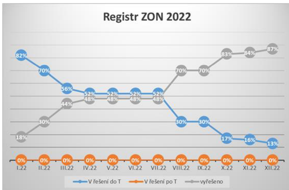
1 Obrázek Registr ZON EZÚ

V registru ZON (Zpráva o Opatření k Nápravě) za rok 2022 je 55 nových nálezů z toho je 13 % (7ks) v řešení do termínu a 87 % (48ks) vyřešeno. Za minulé sledované období zbývá dořešit celkem 3 nálezy.