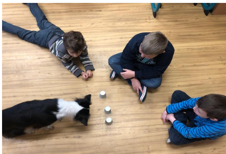
Obrázek 3 – canisterapeutická jednotka – hraní skořápek