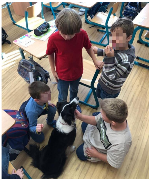
Obrázek 2 – žáci si hladí psa během canisterapeutické jednotky