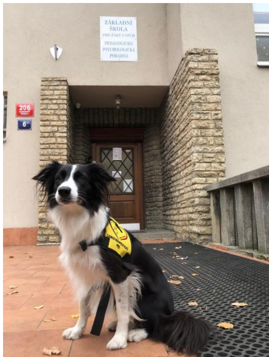
Obrázek 1 – terapeutický pes Bageta autor: Barbora Dudařová