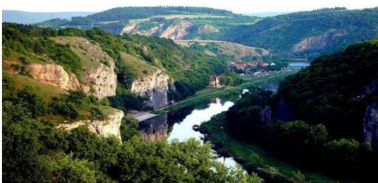
Obr. 78 Kaňon řeky Berounky