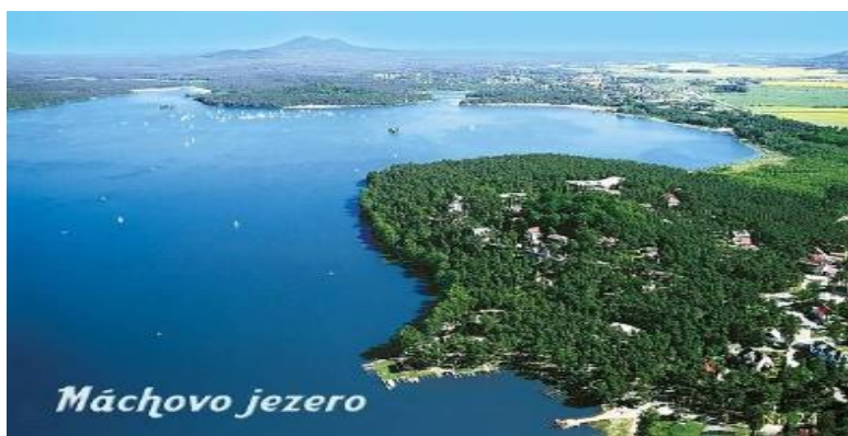
Obr. 79 Letecký pohled