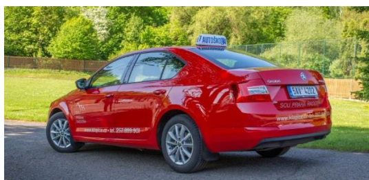
Obr. 74, 75