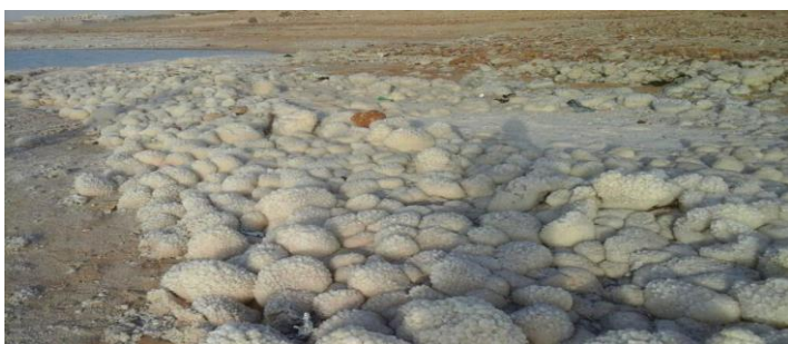
Obr. 81 Krystaly soli - Mrtvé moře