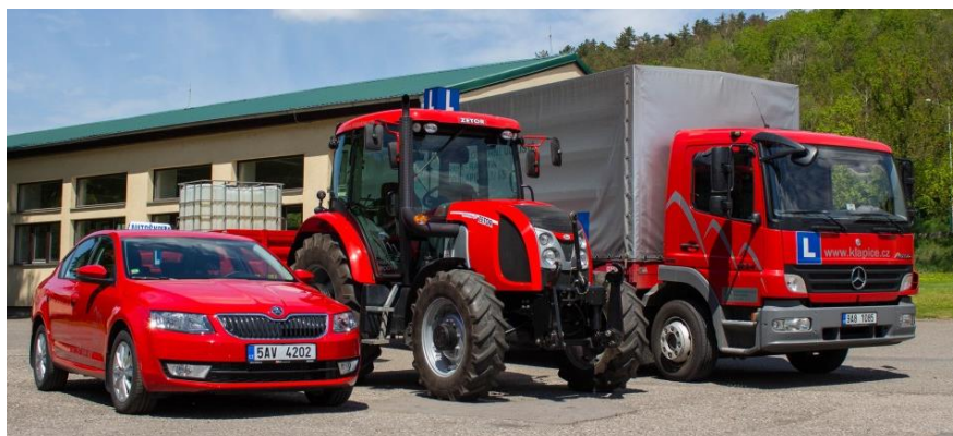
Obr. 77 „Flotila“